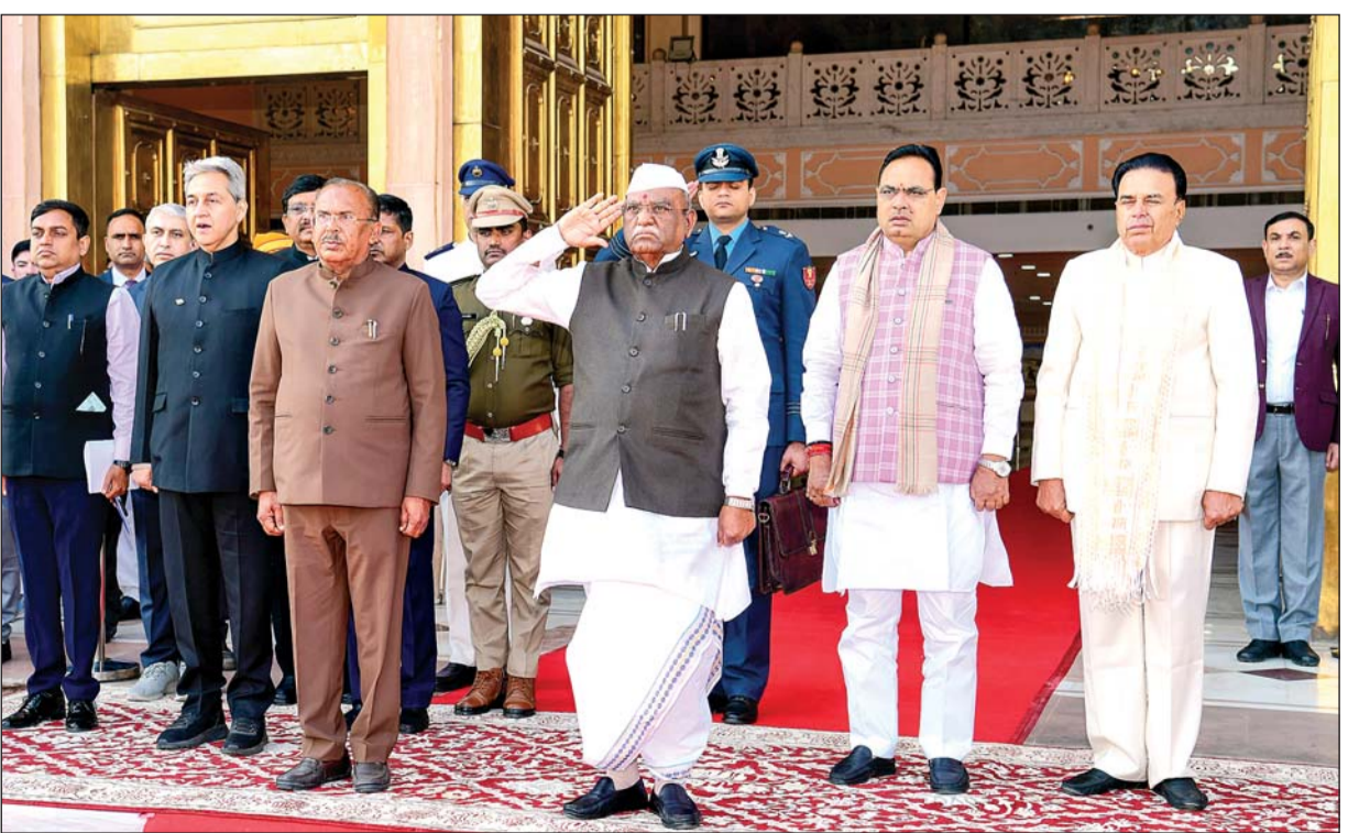
राज्यपाल हरिभाऊ बागड़े ने 16वीं विधानसभा के तीसरे सत्र के प्रथम दिन करीब 1 घंटे 26 मिनट अभिभाषण पढ़ा। उन्होंने पिछली कांग्रेस सरकार को पेपरलीक, जल जीवन मिशन घोटाले, थर्मल प्लांट्स में कोयले की कमी, राजस्थान में बिजली संकट सहित कई मुद्दों पर घेरा।

वसुंधरा राजे के नेतृत्व वाली सरकार ने शुरू किया था। दुर्भाग्य से, विगत सरकार के समय राजनीतिक लाभ के कारण इस परियोजना को अटकया जाता रहा। हमारी सरकार ने इसे राम जल सेतु परियोजना का नाम दिया। मध्य प्रदेश के साथ इस परियोजना को लेकर एमओयू (शेष अंतिम पृष्ठ पर)