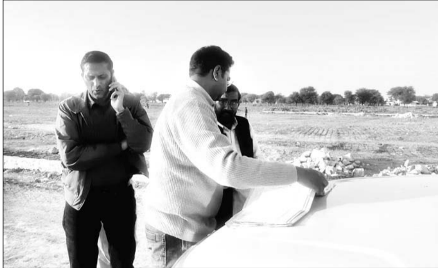
मुहाना गृह निर्माण सहकारी समिति के समापक और जयपुर विकास प्राधिकरण की प्रवर्तन शाखा ने गुरुवार को मुहाना स्थित सचिवालय नगर योजना में अवैध निर्माण व अतिक्रमण को रुकवाया।

जयपुर। मुहाना गृह निर्माण सहकारी समिति के समापक और जयपुर विकास प्राधिकरण की प्रवर्तन शाखा ने गुरुवार को मौके पर पहुंचकर मुहाना स्थित सचिवालय नगर योजना में अवैध निर्माण व अतिक्रमण को रुकवाया। यह अवैध निर्माण जेडीए के अनुमोदित नक्शे के विपरीत 132 के.वी. की हाइड्रेंटशन लाइन के पास सेक्टर रोड पर हो रहा था।