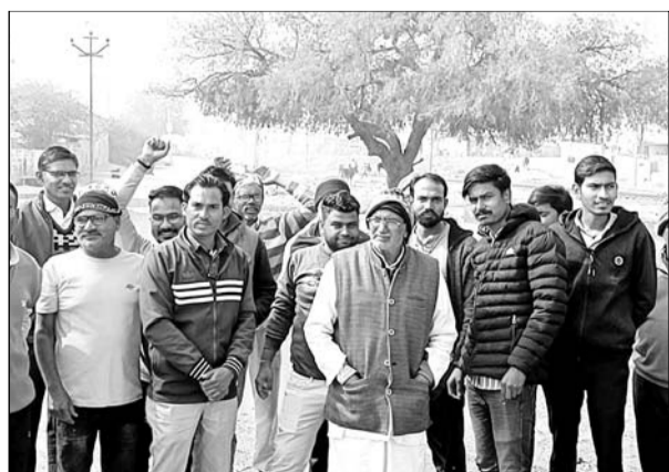
समस्या को लेकर लोगों ने प्रदर्शन किया।