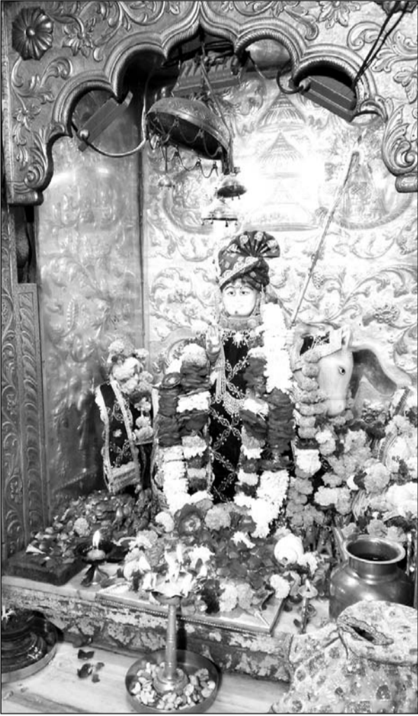
बाबा रामदेव की विश्राम स्थली के नाम से विख्यात बिटूजाधाम स्थित प्राचीन रामसापीर के मंदिर में प्रतिमा सजाई।