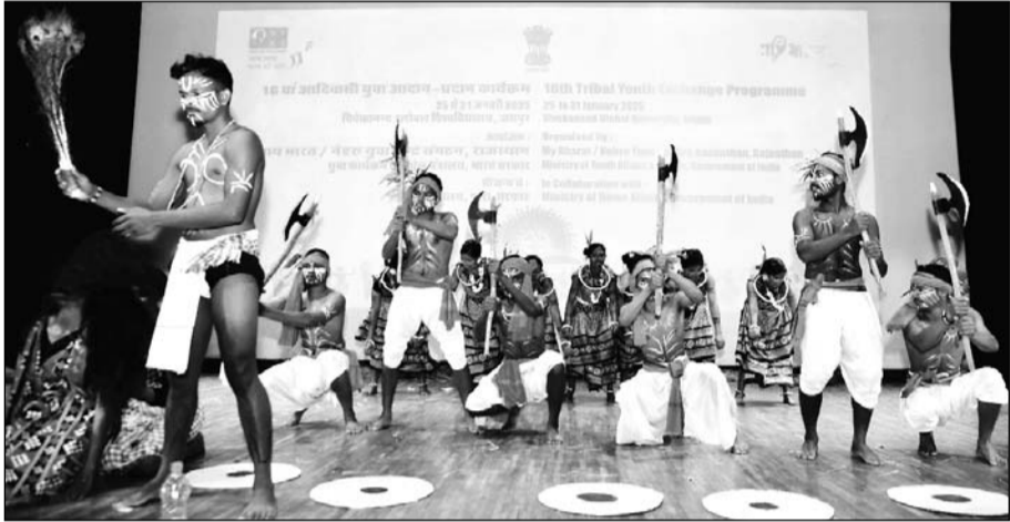
आरएएफ कैंप, लालवास में आयोजित सांस्कृतिक संध्या में विभिन्न राज्यों के आदिवासी कलाकारों ने अपनी पारंपरिक प्रस्तुतियों से दर्शकों को मंत्रमुग्ध कर दिया

जयपुर। आरएएफ कैंप, लालवास में आयोजित सांस्कृतिक संध्या में विभिन्न राज्यों के आदिवासी कलाकारों ने अपनी पारंपरिक प्रस्तुतियों से दर्शकों को मंत्रमुग्ध कर दिया। कार्यक्रम भारत सरकार के नेहरू युवा संगठन द्वारा गृह मंत्रालय के सौजन्य से आदिवासी युवा आदान-प्रदान कार्यक्रम के तहत आयोजित किया गया। झारखंड, ओडिशा और छत्तीसगढ़ के लोक कलाकारों ने अपने-अपने क्षेत्रीय नृत्य प्रस्तुत किए, जिनमें कृषि, प्रकृति, पारंपरिक आस्था और सामाजिक संदेश झलकते दिखे।