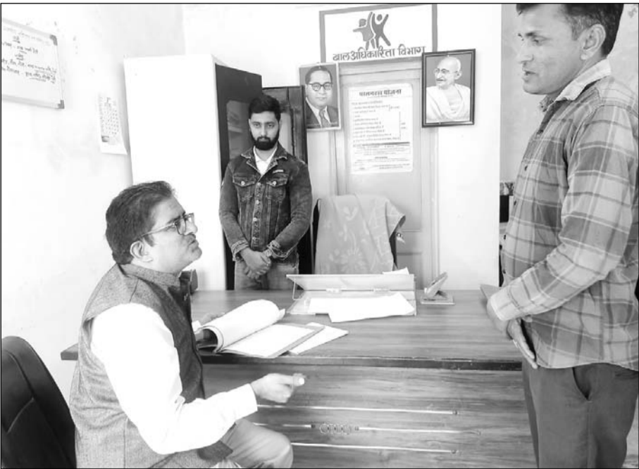
जालोर के राजकीय किशोर एवं सम्प्रेषण गृह का निरीक्षण जिला विधिक सेवा प्राधिकरण के सचिव न्यायाधीश अहसान अहमद ने किया।

सचिव ने उपस्थित कर्मचारियों को निर्देश दिया कि यहां पर रहने वाले विधि से संघर्षित बालकों, किशोरों एवं शिशुओं को नियमानुसार उपलब्ध करवाई जाने वाली सुविधाओं में किसी प्रकार की कोताही नहीं बरते। इस दौरान उन्होंने उपस्थित बालकों से वार्तालाप कर उनके प्रकरणों के संबंध में जानकारी ली और उपस्थित कर्मचारियों को निर्देश दिए कि जिनके प्रकरणों में अपील और जमानत नहीं लगाई गई उनके प्रकरणों में शीघ्र जमानत, अपील की कार्यवाही की जावे। इस दौरान उन्होंने रसोई घर का भी निरीक्षण किया और बनाए जाने वाले भोजन की जानकारी ली। उन्होंने निर्देश दिए कि बालकों के रहने के कक्षों, रसोई घर आदि की साफ सफाई प्रतिदिन और अधिक बेहतर तरीके से की जावे। इस दौरान उन्होंने कहा कि मौसम बदल रहा है इसलिए बालकों, शिशुओं के स्वास्थ्य का विशेष ध्यान रखा जाये यदि