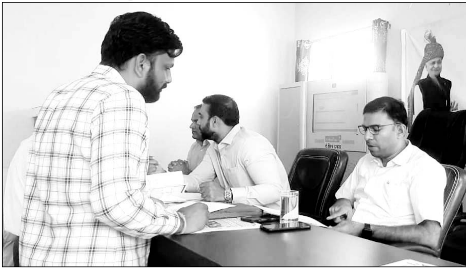
छतरगढ़ में आयोजित ब्लॉक स्तरीय जनसुनवाई में जिला कलेक्टर भगवती प्रसाद कलाल ने आमजन की समस्याएं सुनीं।

जिला कलेक्टर ने अधिकारियों को निर्देश दिए कि वे अपने अधीनस्थ कार्यालयों के निरंतर निरीक्षण करें, जिससे व्यवस्था संबंधी फीडबैक मिल सके। उन्होंने उपखंड अधिकारी एवं विकास अधिकारी, ब्लॉक चिकित्सा अधिकारी को निर्देश दिए। मुख्यमंत्री चिरंजीवी स्वास्थ्य बीमा योजना के तहत शत प्रतिशत परिवारों का पंजीकरण करवाया जाए। जिला कलेक्टर ने जल जीवन मिशन कार्यो की समीक्षा करते हुए कहा कि 507 हेड के पास घेघड़ा झील में जल जीवन मिशन योजना के