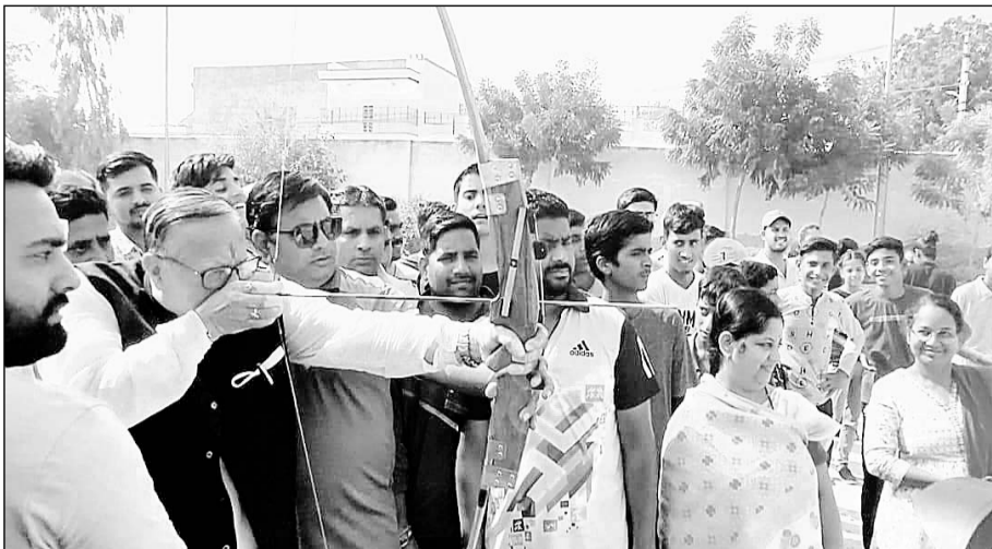
राजकीय बालिका उच्च माध्यमिक विद्यालय बारहगुवाड़ में शिक्षा मंत्री डॉ. बी. डी. कल्ला ने तीर चलाकर जिला स्तरीय स्कूली तीरंदाजी प्रतियोगिता का शुभारंभ किया।

राज्य सरकार द्वारा खिलाड़ियों को आउट ऑफ टर्न राजकीय नौकरी दी जा रही है। इसके अतिरिक्त अंतरराष्ट्रीय स्तर की स्पर्धाओं में स्वर्ण रजत तथा कांस्य पदक जीतने पर क्रमशः 3-2-1 करोड़ रूपए की राशि दी जा रही है।