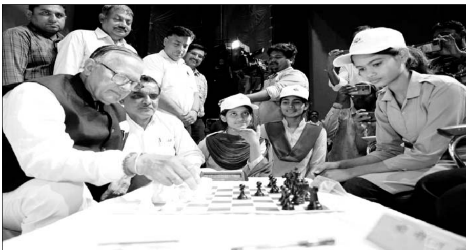
बीकानेर में शिक्षा मंत्री डॉ. बी. डी. कल्ला ने रविन्द्र रंगमंच पर मोहरे चलाकर 'चेस इन स्कूल' कार्यक्रम का शुभारंभ किया।

बीकानेर, (कासं)। राज्य की समस्त स्कूलों में प्रत्येक माह के तीसरे शनिवार को नौ बैंग डे के दौरान विद्यार्थियों को चेस खेलने का अवसर प्रदान किया जायेगा। इसकी शुरुआत गुरूवार को बीकानेर से की गई। शिक्षा मंत्री डॉ. बी. डी. कल्ला ने गुरूवार को रवीन्द्र रंगमंच पर स्कूली शिक्षा में राज्य सरकार की नई पहल 'चेस इन स्कूल' कार्यक्रम का शुभारंभ किया। इस अवसर पर राज्य स्तरीय समारोह में डॉ. कल्ला ने कहा कि 19 नवम्बर से प्रदेश की समस्त स्कूलों में एक साथ यह कार्यक्रम प्रारंभ होगा। यह अपने आपमें इतिहास होगा। इससे बच्चों के मानसिक विकास को बाल मिलेगा। उन्होंने कहा कि राजीव गांधी प्रोग्राम ओलंपिक खेलों में ग्रामीण क्षेत्रों के 30 लाख खिलाड़ी जुड़े। कल्ला ने कहा कि मुख्यमंत्री की घोषणा के अनुसार शहरी क्षेत्र में भी इन खेलों