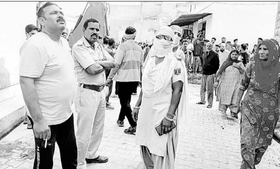
वार्ड 20 मोहल्ला नरडियान में अवैध अतिक्रमण हटाने के दौरान महिलाओं ने विरोध किया।

जैसे ही प्रशासनिक अधिकारी नायब तहसीलदार ने पालिका टीम के सहयोग से पीला पंजा चलाने की तैयारी प्रारंभ करनी चाही तो मौके पर उपस्थित अवैध अतिक्रमणकारी ने प्रशासन से