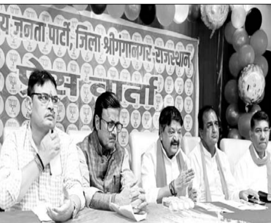
श्रीगंगानगर में भाजपा राष्ट्रीय महामंत्री कैलाश विजयवर्गीय (बीच में) ने पत्रकार वार्ता को संबोधित किया।

आये हैं। उन्होंने बताया कि वे लगातार तीन दिन तक राजस्थान का दौरा कर पोलिंग बुच कार्यक्रमों, युवा कों, सभी मांचों कार्यकर्ताओं, मण्डल समितियों, जिला कार्यकारिणी कार्यकर्ताओं आदि भाजपा के पूरे संगठनात्मक ढांचे के बारे में