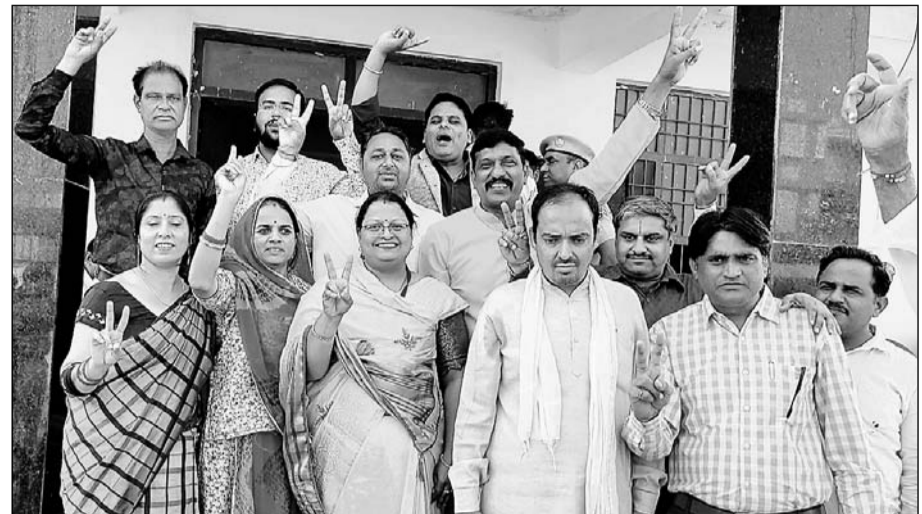
उपचुनाव में जीत के बाद भाजपा पार्षद खुश नजर आए।

क्रॉस वोटिंग के चलते कांग्रेस की डूबी नैया