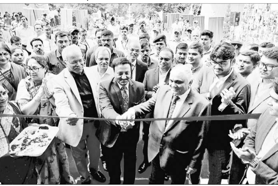
मुख्य चुनाव आयुक्त राजीव कुमार और चुनाव आयुक्त अनूप चंद्र पाण्डेय ने गुरुवार को महाराष्ट्र के सावित्रीबाई फुले पुणे विश्वविद्यालय में "मतदाता पंजीकरण-लोकतंत्र की दिशा में पहला कदम" विषय पर एक मल्टीमीडिया प्रदर्शनी का उद्घाटन किया।

रूप में चुनाव प्रक्रिया में भाग लेने के महत्व को रेखांकित करती है और भारतीय चुनावों की भव्यता को प्रदर्शित करती है। सूचना और प्रसारण मंत्रालय के तहत केंद्रीय संचार ब्यूरो (सीबीसी) द्वारा जिला चुनाव अधिकारी, पुणे के सहयोग से आयोजित थे तीन दिवसीय प्रदर्शनी, मतदाता जागरूकता को बढ़ाने की एक कवायद है जो आज मतदाता सूची का विशेष पुनरीक्षण 2023 के राष्ट्रपतीय लॉन्च के अवसर पर की जा रही है। डीईओ पुणे ने प्रदर्शनी स्थल पर युवा मतदाताओं को नार्मांकित करने के लिए विशेष पंजीकरण शिबिर भी लगाए