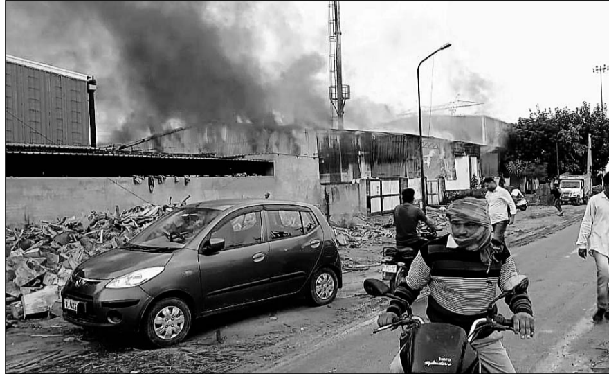
हवा चलने की वजह से धू-धू कर जलने लगी प्लाईवुड फैक्ट्री।

सूचना पर दमकल की 8 गाड़ियां मौके पर पहुंची तथा आग पर पानी डालकर काबू पाने का प्रयास किया लेकिन आग इतनी फैल चुकी थी जिस पर काबू पाना कोई आसान काम नहीं था। बताया जा रहा है कि गोविंद प्लाईवुड फैक्ट्री में शाम करीबन 5 बजे अचानक शॉर्ट सर्किट से आग लग गई थी जिसके बाद आग की लपटें देख मौके पर लोगों की भीड़ लग गई। हवा चलने की वजह से आग की तीव्रता इतनी तेज थी कि कुछ ही देर में आग ने विकल रूप धारण कर लिया और फैक्ट्री धू-धू कर जल उठी। दूर दूर तक तक आग की लपटें दिखाई दे रही थी।