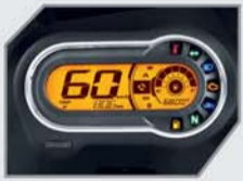
RTMI** के साथ फुल डिजिटल मीटर