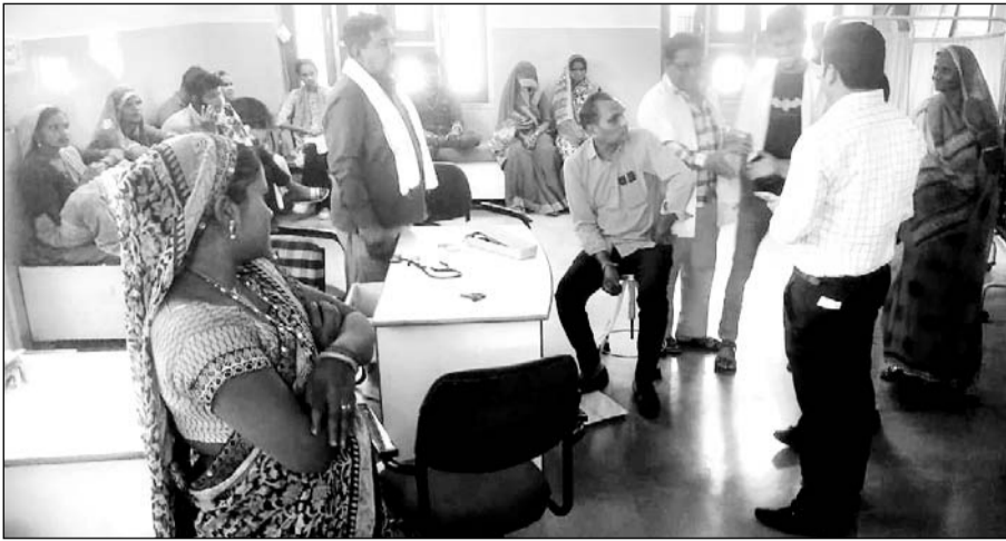
जिले में खानपुर के दो सोनोग्राफी सेन्टर का निरीक्षण कर पीसीपीएनडीटी अधिनियम की सख्ती से पालना करने हेतु पाबन्द किया।

आज खानपुर में संचालित सोनोग्राफी एजे मंचू हास्पिटल एवं मेहता सोनोग्राफी सेन्टर का औचक