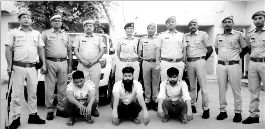
पुलिस ने अपहरणकर्ताओं को मात्र 20 मिनट में ही गिरफ्तार कर लिया।

तारानगर, (निर्स)। तारानगर में पुलिस ने बड़ी कार्रवाई करते हुए तीन अपहरणकर्ताओं को सूचना मिलने के मात्र 20 मिनट में गिरफ्तार कर लिया। अपहरणकर्ताओं ने दो व्यक्तियों का तारानगर में अपहरण कर पांच लाख की फिरौती मांगी और जान से मारने की धमकी दी थी।