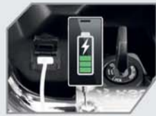
USB मोबाइल चार्जर