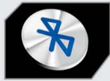
कॉल और SMS अलर्ट के साथ ब्लूटूथ