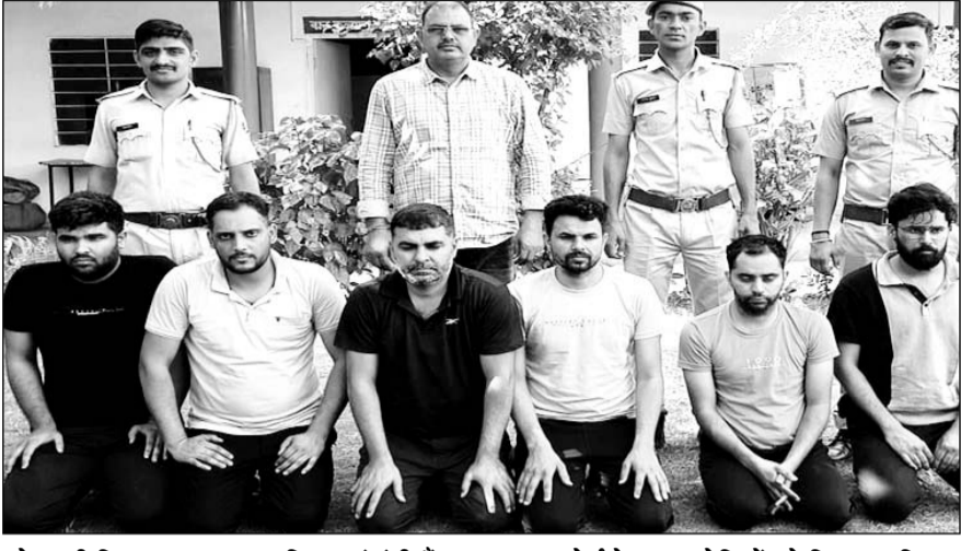
कोटा की विज्ञान नगर थाना पुलिस एवं एंटी गैंगस्टर टास्क फोर्स ने छह आरोपियों को गिरफ्तार किया।

कोटा/जयपुर, (निर्स)। कोटा जिले की विज्ञान नगर थाना पुलिस एवं एंटी गैंगस्टर टास्क फोर्स ने बड़ी कार्रवाई करते हुए इंडियन कोस्ट गार्ड के पेपर-2/2024 में नकल करवाने वाले गिरोह का पर्दाफाश कर छह आरोपियों को गिरफ्तार कर मोबाइल व एक क्रेडा कार जब्त की है। मोबाइल में परीक्षा के एडमिट कार्ड व प्रश्न पत्र की सामग्री पाई गई है। यह सभी आरोपी कंप्यूटर हैक कर पेपर को सॉल्व कर देते थे। इसकी एवज में आरोपी लाखों रुपए अभ्यर्थियों से वसूलते थे। इसके लिए यह कंप्यूटर सिस्टम में रिमोट सिस्टम का एक्सेस डालते थे। इस मामले में पुलिस आरोपियों से पूछताछ कर रही है।