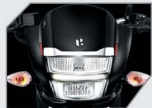
HIPL* के साथ LED हेडलैंप