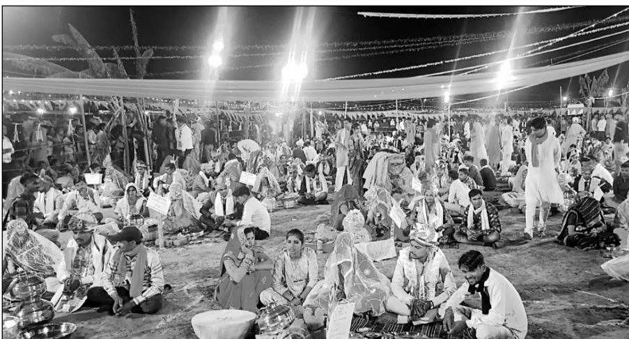
लोधा 'लवबंधी' समाज द्वारा प्रथम निःशुल्क विवाह सम्मेलन अलीनगर गांव में सम्पन्न हुआ।

लोधा समाज का निःशुल्क विवाह सम्मेलन सम्पन्न