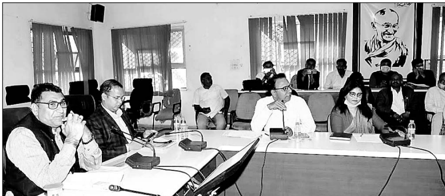
राजस्व मंत्री रामलाल जाट व जिला कलेक्टर आशीष मोदी के आतिथ्य में कलेक्ट्रेट सभागार में नगर विकास न्यास के कार्यों की समीक्षा बैठक आयोजित हुई।

भीलवाड़ा, (निस्)। राजस्व मंत्री रामलाल जाट व जिला कलेक्टर आशीष मोदी के आतिथ्य में जिला कलेक्ट्रेट सभागार में मंगलवार को नगर विकास न्यास के कार्यों की समीक्षा बैठक आयोजित हुई। राजस्व मंत्री ने बैठक में मौजूद अधिकारियों को कहा कि समिति का गठन कर सर्वे कवाएं जिससे कि शहरी नगरीय क्षेत्र के पेराफेरी ग्रामों में पट्टे से वंचित आमजन को पट्टे जारी किए जा सकें। राजस्व मंत्री जाट ने बताया कि आमजन की समस्याओं के निराकरण के लिए राजस्व नियमों में मुख्यमंत्री अशोक गहलोत द्वारा नियमों में सरलीकरण किया गया है। उन्होंने अधिकारियों को निर्देश दिए कि मुख्यमंत्री बजट घोषणा के अंतर्गत जारी कार्यों को जल्द पूरा किया जाए एवं कम्प्युनिटी हॉल, शमशान इत्यादि का प्राथमिकता से विकास करी। जिला कलेक्टर ने संबंधित अधिकारियों को