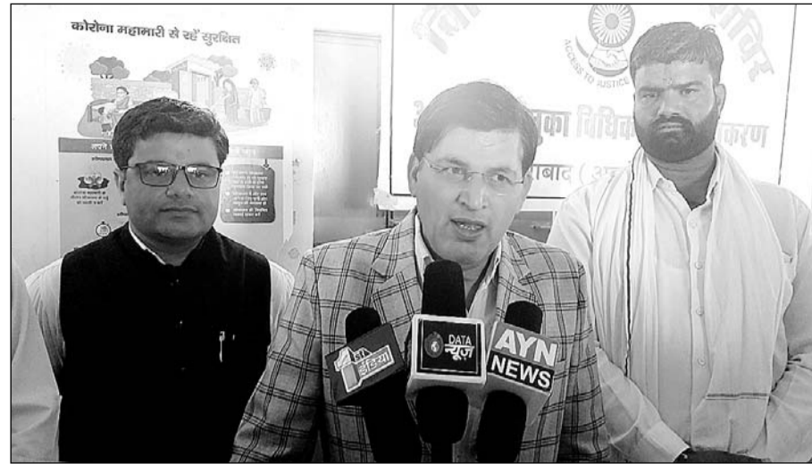
राष्ट्रीय लोक अदालत को सफल बनाने के लिए जिला विधिक सेवा प्राधिकरण अजमेर द्वारा जागरूकता शिविर आयोजित किया गया।

नसीराबाद, (निस्)। न्याय विभाग की पहल पर अदालतों में बढ़ते प्रकरणों के निस्तारण के लिए राष्ट्रीय लोक अदालत लगाकर परिवारियों से समझौता करने की पहल न्याय विभाग ने चला रखी है। इसी के तहत देरांडू ग्राम पंचायत मुख्यालय पर आगामी 12 मार्च को लगने वाली राष्ट्रीय लोक अदालत को सफल बनाने के लिए मंगलवार को जिला विधिक सेवा प्राधिकरण अजमेर द्वारा जागरूकता शिविर आयोजित किया गया। इसमें देरांडू निवासियों के लम्बित प्रकरणों में पक्षकारों के बीच समझौदा करने हेतु पंचायत मुख्यालय बुलाया गया। जिसमें आये सभी पक्षकारों को