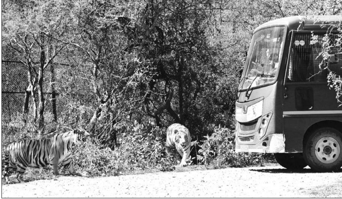
रविवार को नाहरगढ़ जैविक उद्यान में सफारी के दौरान सैलानियों ने टाईगर्स का नजदीक से अवलोकन किया।

नाहरगढ़ जैविक उद्यान में संचालित दो प्रमुख सफारियाँ - टाइगर सफारी और लायन सफारी - इन दिनों जयपुरवासियों और बाहर से आने वाले पर्यटकों के लिए बड़ी आकर्षण का केंद्र बनी हुई है। शहर के मध्य में प्राकृतिक हरियाली और