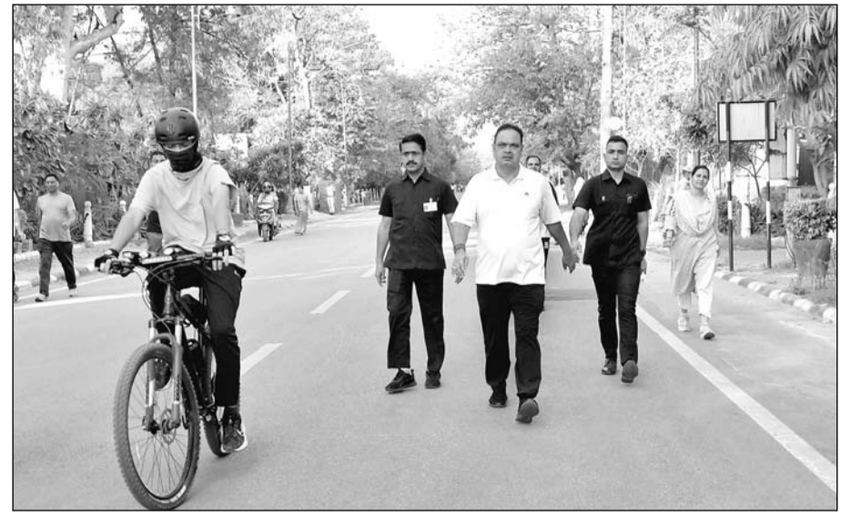
मुख्यमंत्री भजनलाल शर्मा ने रविवार सुबह मुख्यमंत्री निवास के बाहर लोक भवन रोड पर मॉर्निंग वॉक की।

योग एवं व्यायाम को बताया स्वस्थ जीवन का सूत्र