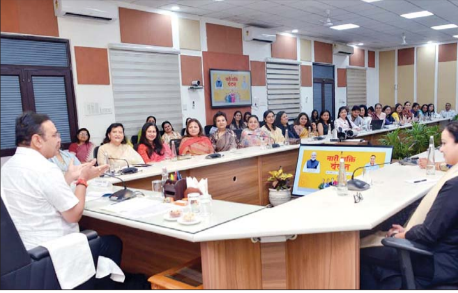
मुख्यमंत्री भजनलाल शर्मा ने रविवार को मुख्यमंत्री निवास पर 'नारी शक्ति वंदन' अधिनियम पर आयोजित कार्यक्रम में विभिन्न क्षेत्रों से जुड़ी महिलाओं को संबोधित किया।

सदनों में एक तिहाई सीटें महिलाओं के लिए आरक्षित होंगी। उन्होंने कहा कि डबल इंजन सरकार ने अनेक जन कल्याणकारी योजनाओं के माध्यम से देश व प्रदेश की मातृशक्ति को