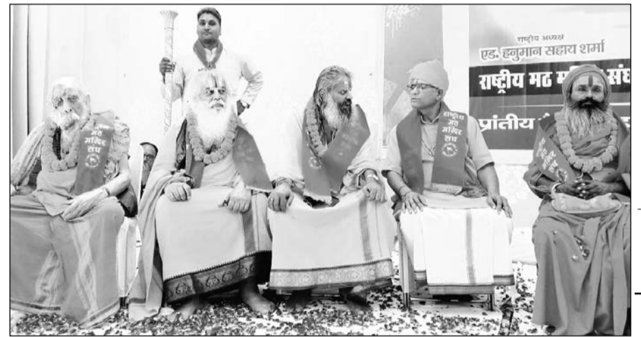
राष्ट्रीय मठ मंदिर संघ की ओर से जयपुर में आयोजित महाधिवेशन में संत-महंतों ने हिस्सा लिया।

जयपुर। राष्ट्रीय मठ मंदिर संघ द्वारा जयपुर में महाधिवेशन का आयोजन किया गया, जिसमें विभिन्न मठ-मंदिरों के महंत, पुजारी एवं संगठन के पदाधिकारियों ने भाग लेकर धार्मिक एवं सामाजिक विषयों पर विस्तार से विचार-विमर्श किया। कार्यक्रम में मुख्य अतिथि के रूप में विधायक गोपाल शर्मा उपस्थित रहे।