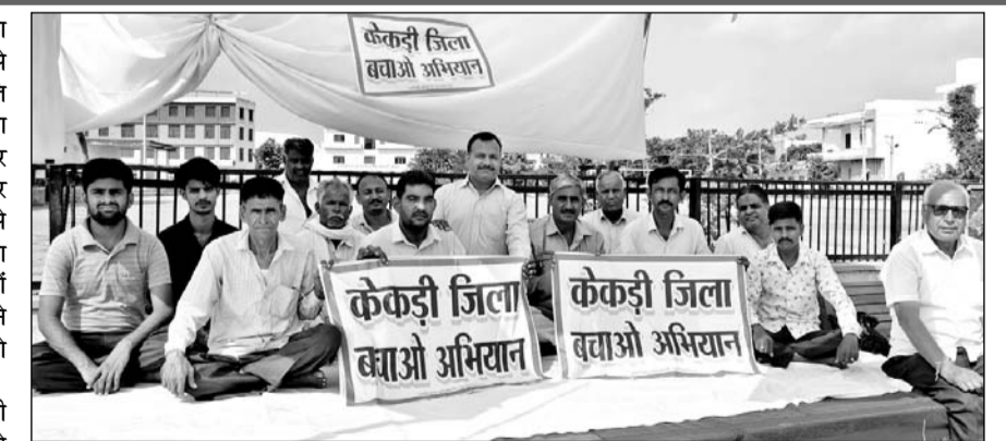
केकड़ी जिले को अयथावत रखने की मांग को लेकर धरना जारी रहा।