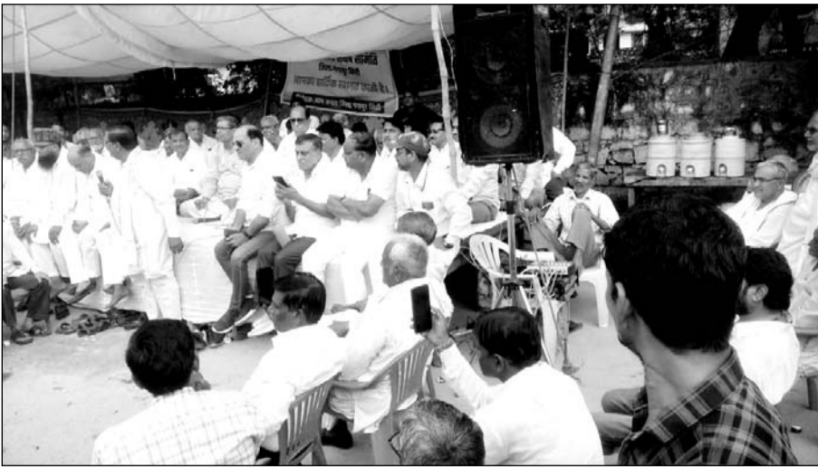
धरना प्रदर्शन में शामिल शहर के सभी संगठनों के पदाधिकारी।

गंगापुर सिटी । अब नई सरकार में नए जिलों के रिव्यू करने की घोषणा और इसके बाद कमेटी बनाने के बाद अब कई नए जिलों पर संकट आने की बात सामने आ रही है। ऐसे में गंगापुर सिटी को जिला बनाए रखने के लिए जिला बचाओ संघर्ष समिति के बैनर तले कलेक्ट्रेट के सामने धरना प्रदर्शन शुरू किया गया है। उल्लेखनीय है कि पिछले साल अप्रैल 2, 2023 में पूर्व मुख्यमंत्री अशोक गहलोत ने 19 जिलों की घोषणा की थी और इनमें एक गंगापुर सिटी को भी मापदंड पूरा करता है, यहां की भौगोलिक स्थिति भी सही है, लेकिन जिला नहीं बनने से यहां की जनता की