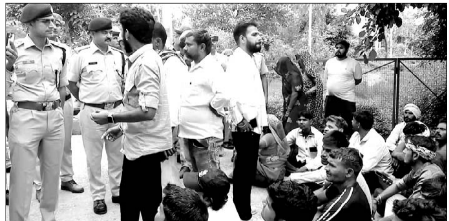
गांव जया में ट्रैक्टर से कुचलने से एक बालक की मौत के बाद परिजनों एवं ग्रामीणों ने प्रदर्शन किया।