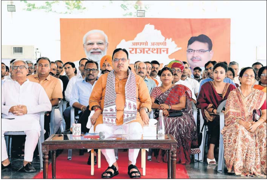
मुख्यमंत्री भजनलाल शर्मा ने आमजन के साथ अपने निवास पर प्रधानमंत्री नरेन्द्र मोदी की मन की बात का उद्बोधन सुना।

मुख्यमंत्री भजनलाल शर्मा ने आमजन के साथ प्रधानमंत्री का सम्बोधन सुना