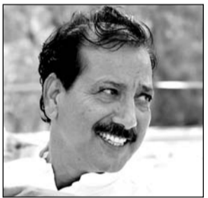
पूर्व मंत्री राजेंद्र सिंह गुढ़ा।