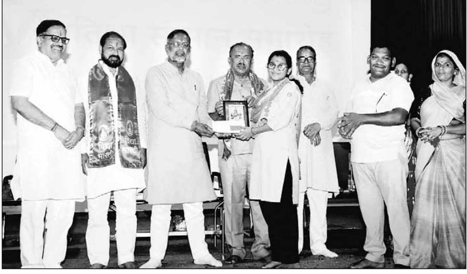
विधानसभाध्यक्ष वासुदेव देवनानी रिवार को कोटा में विद्या भारती शिक्षा संस्थान के प्रतिभा सम्मान समारोह को मुख्य अतिथि के रूप में संबोधित किया।

जयपुर। विधानसभा अध्यक्ष वासुदेव देवनानी ने कहा कि समाज में परिवर्तन लाने के लिए नई पीढ़ी को संस्कारवान बनाना हम सभी की जिम्मेदारी है। नई पीढ़ी को राष्ट्रीयता, देश प्रेम एवं मूल्यों की शिक्षा देकर उनमें देश के लिए समर्पण का भाव उत्पन्न कर हम 2047 तक विकसित भारत का संकल्प पूरा कर सकेंगे। देवनानी रिवार को कोटा में विद्या भारती शिक्षा संस्थान के प्रतिभा सम्मान समारोह को मुख्य अतिथि के रूप में संबोधित कर रहे थे।