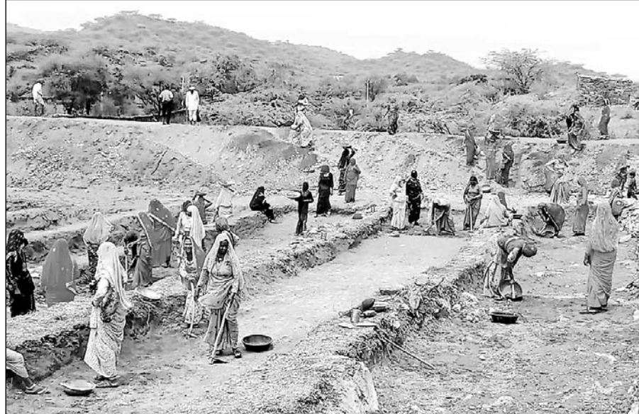
ग्राम काशीपुरा में मनरेगा योजना के अंतर्गत 5 साल से हर वर्ष 100 दिन का रोजगार मिल रहा है।