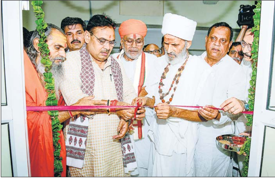
मुख्यमंत्री भजनलाल शर्मा ने जयपुर में राजपुरोहित छात्रावास का उद्घाटन किया। इस सार्वजनिक कार्यक्रम में संतजनों की भी उपस्थिति रही।

जयपुर, 7 जुलाई (का.सं.)। मुख्यमंत्री भजनलाल शर्मा ने रविवार को जयपुर में संतजनों की उपस्थिति में राजपुरोहित ग्लोबल सेंटर ऑफ़ ऐक्सिलेंस (राजपुरोहित छात्रावास) का फीता काटकर उद्घाटन किया। इस अवसर पर आयोजित समारोह को संबोधित करते हुए उन्होंने कहा कि राजपुरोहित समाज शिक्षा के क्षेत्र में अग्रणी भूमिका निभा रहा है। इस छात्रावास का निर्माण शिक्षा के क्षेत्र में समर्पण और सामाजिक सरोकार की सच्ची मिसाल है। यह छात्रावास युवाओं को गुणवत्तापूर्ण शिक्षा प्राप्त करने के लिए मजबूत आधार प्रदान करेगा। मुख्यमंत्री ने कहा कि छात्रावास में विभिन्न क्षेत्रों के विद्यार्थी साथ रहते हैं, जिससे बेहतर संवाद स्थापित होता है और उनका आत्मविश्वास बढ़ता है। मुख्यमंत्री ने छात्रावास परिसर का अवलोकन भी किया।