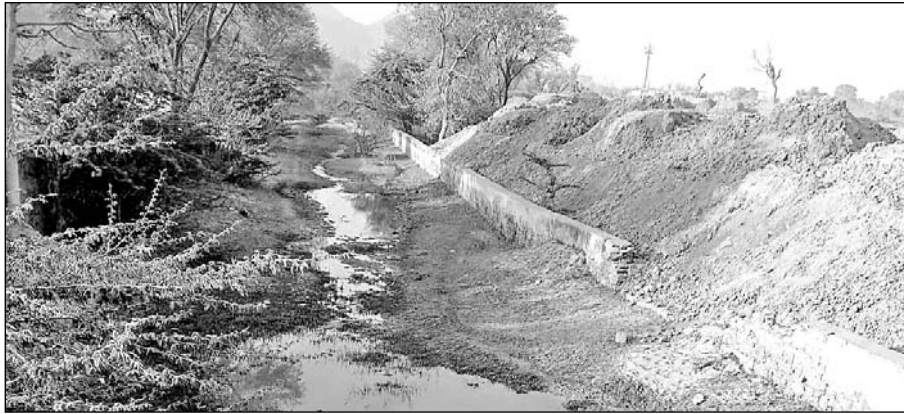
कासावती नदी के बहाव क्षेत्र में नियम विरुद्ध खनन से नदी में आने वाला पानी पूर्ण रूप से डाइवर्ट हो गया है।