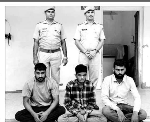
पुलिस ने हनीट्रेप मामले में तीन आरोपियों को गिरफ्तार किया।