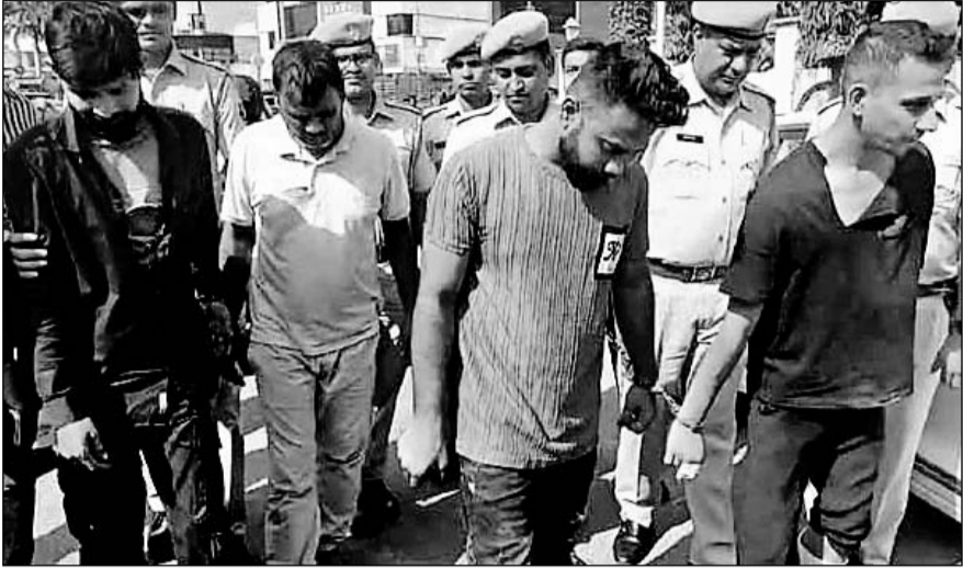
पुलिस ने अपहरण के मामले में चारों आरोपियों की अजमेर शहर में परेड कराई।