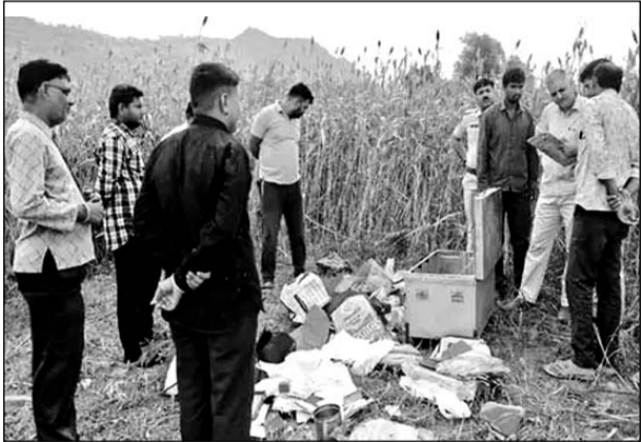
पुलिस ने खेत में पड़े बक्से की जानकारी ली।

सोओ साउथ ओमप्रकाश ने बताया कि बीती देर रात अलवर गेट थाना क्षेत्र में करीब 12 से 3 बजे अज्ञात नकबजनों ने चोरी की वारदात अंजाम दी है। चोरों ने जैन मंदिर के पास चार दुकानों के ताले तोड़े, लेकिन तीन दुकानों से सामान चोरी किया। एक मेडिकल की दुकान के