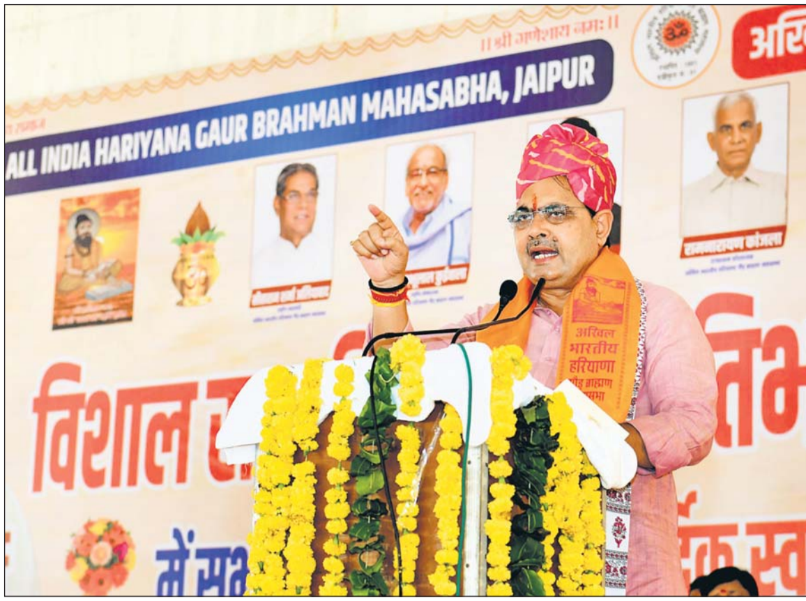
मुख्यमंत्री भजनलाल शर्मा ने अखिल भारतीय हरियाणा गौड़ ब्राह्मण महासभा के समारोह में भाग लिया। इस अवसर पर उन्होंने कहा कि ऐसे आयोजकों से प्रतिभाओं को प्रोत्साहन मिलता है।