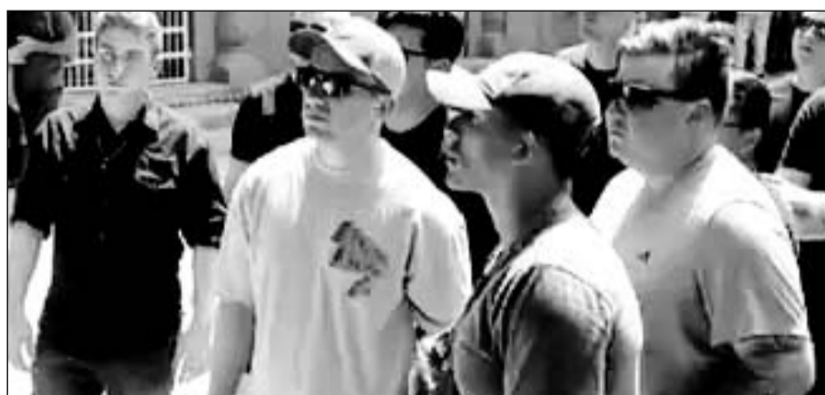
अमेरिकी सैनिकों ने जूनागढ़ फोर्ट को निहारा।

महाजन फोर्ट फायरिंग रेंज में चल रहे युद्धाभ्यास में रविवार को अवकाश का दिन रहा। दोनों देशों के जवानों ने बीकानेर का भ्रमण किया।