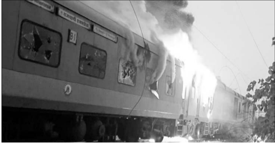
ट्रेन का थर्ड एसी और एएसएलआर कोच जलकर पूरी तरह खाक हो गए।