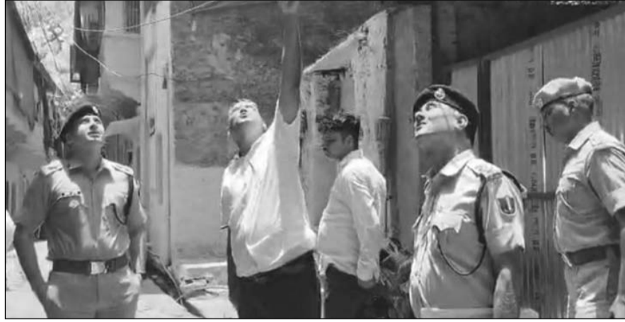
लूट की वारदात के बाद पुलिस टीम ने घटना स्थल का जायजा लिया।

■ बदमाश घर में रखे सोने-चांदी के जेवरत से भरे 7 से 8 पीपे और करीब 10 लाख रुपए की नकदी ले गये