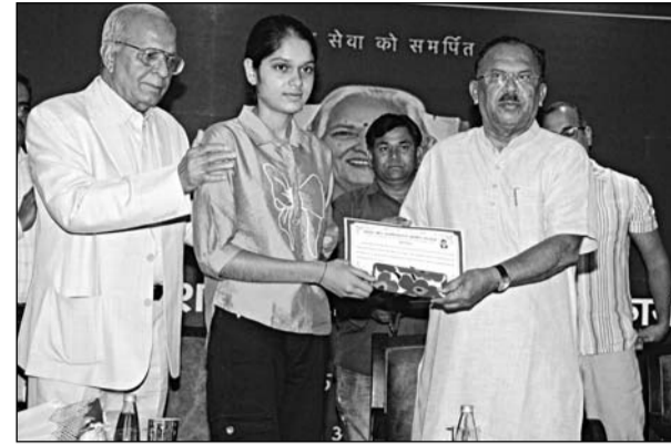
विधानसभा अध्यक्ष वासुदेव देवनानी ने 6 ग्रामीण बालिकाओं को छात्रवृत्ति प्रदान की।