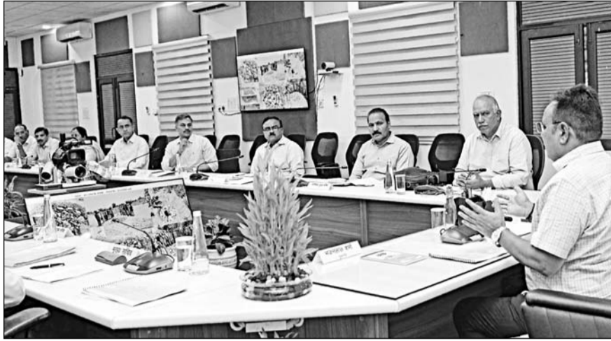
मुख्यमंत्री भजनलाल शर्मा ने वंदे गंगा जल संरक्षण-जन अभियान, जल संचय जन भागीदारी 2.0 और कर्मभूमि से मातृभूमि अभियान को लेकर रविवार को उच्च स्तरीय बैठक ली।

जयपुर। मुख्यमंत्री भजनलाल शर्मा ने कहा कि वंदे गंगा जल संरक्षण जन अभियान को केवल सरकारी कार्यक्रम तक सीमित न रखकर गांव-गांव तक पहुंचाया जाए और जन आंदोलन बनाया जाए। उन्होंने कहा कि जल संचय को बढ़ावा देने में यह अभियान महत्वपूर्ण कड़ी है। इसलिए शहरों से लेकर ग्राम स्तर तक आमजन एवं प्रशासन की भागीदारी इस अभियान में सुनिश्चित की जाए। मुख्यमंत्री ने रविवार को मुख्यमंत्री निवास पर वंदे गंगा जल संरक्षण-जन अभियान, जल संचय जन भागीदारी 2.0 और कर्मभूमि से मातृभूमि अभियान को लेकर उच्च स्तरीय बैठक ली।