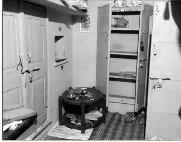
घर को निशाना बनाकर लूट की वारदात को अंजाम दिया गया।

पत्नी छत से नीचे पहुंचे तो अंदर से गेट बंद मिला। काफी मशक्कत के बाद गेट तोड़कर अंदर पहुंचे, तब तक बदमाश सामान लेकर भाग रहे थे। परिवार ने बदमाशों को हाथों में पीपे लेकर भागते हुए देखा। बताया जा रहा है कि बदमाशों ने आसपास के कुछ मकानों के ताले भी तोड़ दिए, जिससे पूरे कस्बे में भय का माहौल बन गया। घटना की सूचना