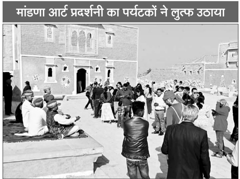
देशी-विदेशी सैलानियों ने स्थानीय मांडणों को बारिकी से देखा एवं अपने कैमरों में कैद किया।

जैसलमेर, (निसं)। मरू महोत्सव के अंतिम दिवस 12 फरवरी बुधवार को प्राचीन ऐतिहासिक कुलधरा में मांडणा आर्ट प्रदर्शनी व रंगोली का कार्यक्रम आयोजित किया गया। मांडणा आर्ट प्रदर्शनी व रंगोली को