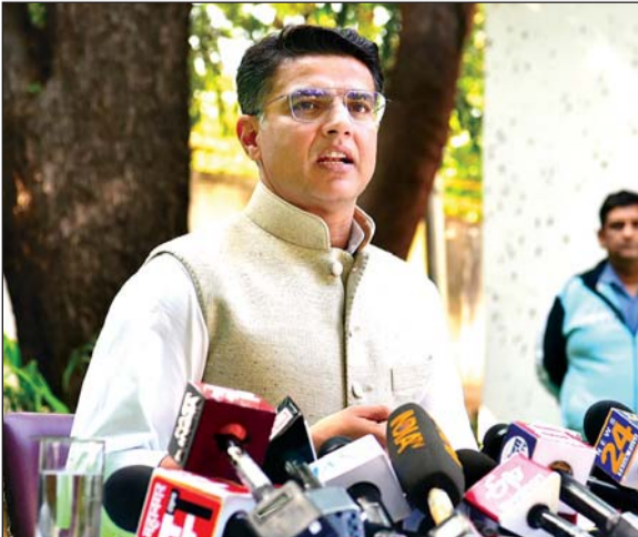
कांग्रेस महासचिव सचिन पायलट ने जयपुर में अपने आवास पर राजस्थान में फोन टैपिंग के मुद्दे पर मीडिया से वार्ता की।

उन्होंने कहा कि नये एमओयू में राजस्थान को पहले से कम पानी मिल रहा है। सरकार को विधानसभा में इस पर जवाब देना चाहिये।