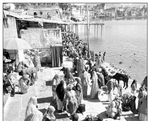
माघ मास की पूर्णिमा पर श्रद्धालुओं ने सरोवर में स्नान किया।