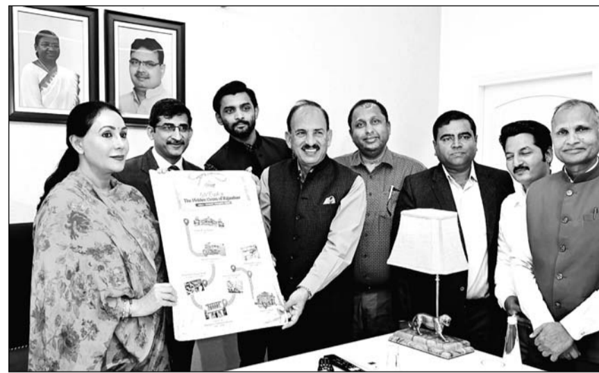
उप मुख्यमंत्री दीपा कुमारी ने होटल एवं रेस्टोरेंट एसोसिएशन राजस्थान के प्रतिनिधियों के साथ जयपुर-आभानेरी-भानगढ़-जयपुर यात्रा के पोस्टर का विमोचन किया।