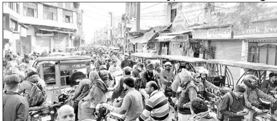
जाम में एम्बुलेंस फंस्तने से मरीज को परेशानी हुई।

भरतपुर, (निर्स)। शहर के मुख्य बाजार में ट्रैफिक इतना बढ़ गया है कि लोगों को कई घंटे जाम में फंस्तने को मजबूर होना पड़ता है। सोमवार को मथुरा गेट पुलिस चौकी के पास लम्बा जाम लग गया। करीब दो घंटे से अधिक समय तक लगे इस जाम की वजह से मथुरा गेट क्षेत्र में आवागमन बुरी तरह प्रभावित रहा। वहीं जाम में दो एम्बुलेंस भी फंस्त गईं। जिन्हें जाम खुलने का इंतजार करना पड़ा।