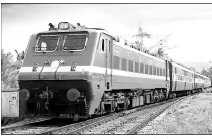
15 जनवरी से 6 मार्च तक नॉन इण्टरलॉकिंग कार्य के कारण रेल सेवा बाधित रहेगी।

अजमेर, (निर्स)। उत्तर रेलवे के फिरोजपुर मण्डल पर जम्मूतवी स्टेशन पर पुनर्विकास कार्य के कारण 15 जनवरी 25 से 06 मार्च 25 तक नॉन इण्टरलॉकिंग ब्लॉक लिया जा रहा है। इस कार्य के कारण रेल यातायात प्रभावित रहेगा। रद्द रेलसेवाएं (प्रारम्भिक स्टेशन से):- गाड़ी संख्या 12414, जम्मूतवी-अजमेर रेलसेवा 06 फरवरी 25 से 06 मार्च 25 तक (29 टिप) रद्द रहेगी। गाड़ी संख्या 12413, अजमेर-जम्मूतवी रेलसेवा 07 फरवरी 25 से 07 मार्च 25 तक (29 टिप) रद्द रहेगी। गाड़ी संख्या 19027, बान्ना टर्मिनस -जम्मूतवी रेलसेवा 22 फरवरी 25 व 01 मार्च 25 को (02 टिप) रद्द रहेगी। गाड़ी संख्या 19028, जम्मूतवी-बान्ना टर्मिनस रेलसेवा 24 फरवरी 25 व 03 मार्च 25 को (02 टिप) रद्द रहेगी। आंशिक रद्द रेलसेवाएं (प्रारम्भिक स्टेशन से):- गाड़ी संख्या 19223, गांधीनगर कैपिटल-जम्मूतवी रेलसेवा जो 14 जनवरी 25 से 05 मार्च 25 तक गांधीनगर कैपिटल से प्रस्थान करेगी वह पठानकोट तक संचालित होगी अर्थात् यह रेलसेवा पठानकोट-जम्मूतवी स्टेशनों के मध्य आंशिक रद्द रहेगी। गाड़ी संख्या 19224, जम्मूतवी-