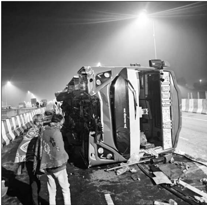
जिले के मांडल थाना क्षेत्र के धूल खेड़ा के पुलिया पर पलटी स्लीपर बस।