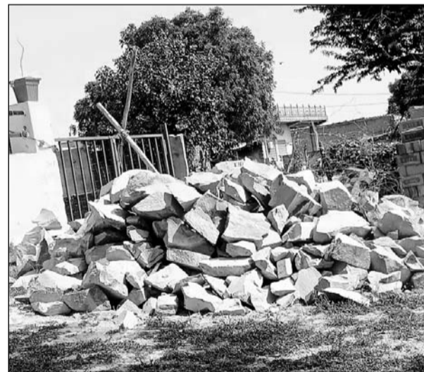
भांकरोटा पंचायत मुख्यालय पर स्थित मालियों की ढाणी के पिछवाड़े में खेत के रास्ते पर पत्थर डालकर अतिक्रमण करते हुए दबंग लोग।