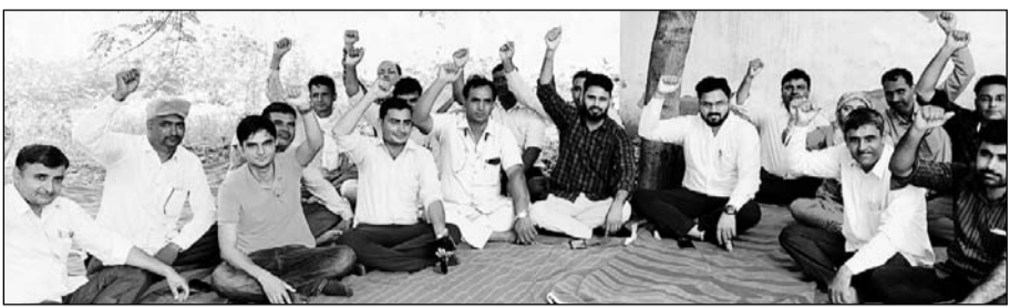
राजस्व सेवा परिषद की ओर से पैन डाउन हड़ताल कर तहसील कार्यालय के प्रदर्शन किया गया।

खेतड़ी, (निसं)। अतिक्रमण की रिपोर्ट बना कर देने पर पटवारी को जान से मारने की धमकी व गाली-गलौज के मामले ने तूल पकड़ लिया है। सोमवार को राजस्व सेवा परिषद की ओर से पैन डाउन हड़ताल कर तहसील कार्यालय के सामने नारेबाजी कर विरोध प्रदर्शन किया गया।