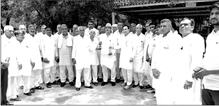
जिला कलेक्टर चूक से क्रॉप कटिंग की रिपोर्ट को किसानों के सामने सार्वजनिक करने की मांग को लेकर वार्ता करते पंचायत समिति राजगढ़ के सरपंच व प्रबुद्धजनों।