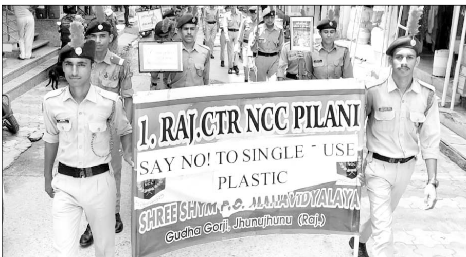
जागरूकता रैली निकालते श्री श्याम पीजी महाविद्यालय के एनसीसी कैडेट्स।