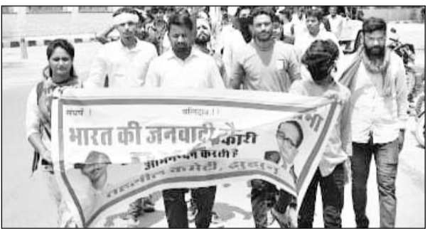
समस्याओं को लेकर डीवाईएफआई के कार्यकर्ताओं ने रैली निकाली।

झुंझुं, (निसं)। झुंझुं शहर के वार्ड नंबर 53 व 54 की समस्याओं के समाधान के लिए डीवाईएफआई ने सोमवार को प्रदर्शन किया। सबसे पहले दोनों वार्डों और डीवाईएफआई के कार्यकर्ता शहीद स्मारक पर इकट्ठा हुए। इसके बाद रैली के रूप में नगर परिषद पहुंचे और जमकर नारेबाजी करते हुए नगर परिषद का घेराव किया।