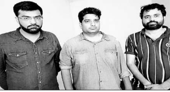
जयपुर कमिश्नरेट की स्पेशल टीम ने सी-स्कीम में अग्रसेन सर्किल पर स्थित स्काई जा रेस्टोरेंट में छापेमारी कर संचालक समेत 3 लोगों को गिरफ्तार किया।