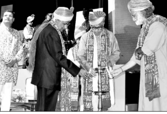
जेकेके के रंगायन सभागार में सोमवार को भक्ति प्रधान ग्रंथ श्री गुरु भागवत का लोकार्पण समारोह आयोजित हुआ। अतिथियों ने दीप प्रज्वलन के साथ कार्यक्रम का आगाज किया।