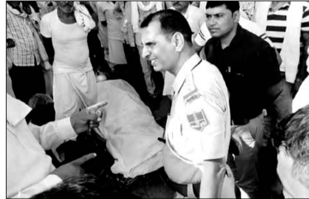
आरोपियों से समझाइश करते पुलिस अधिकारी।

वहीं मोक्षधाम तक जाने के लिए बनाये गये आम रास्ते पर हो रहे