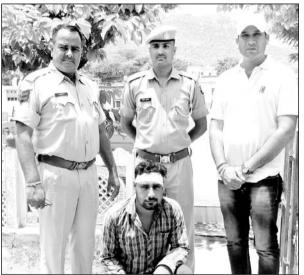
सेफरागुवार शराब ठेके के पास अवैध देशी कट्टा लेकर घूम रहे युवक को पुलिस ने गिरफ्तार किया।

खेतड़ी, (निसं)। अपनी सोशल मीडिया अकाउंट पर हथियारों के साथ फोटो अपलोड कर वायरल करने व किसी बड़ी घटना को अंजाम देने वाले सेफरागुवार शराब ठेके के पास देशी कट्टा लेकर घूम रहे एक युवक को पुलिस ने देशी कट्टे सहित गिरफ्तार किया है।