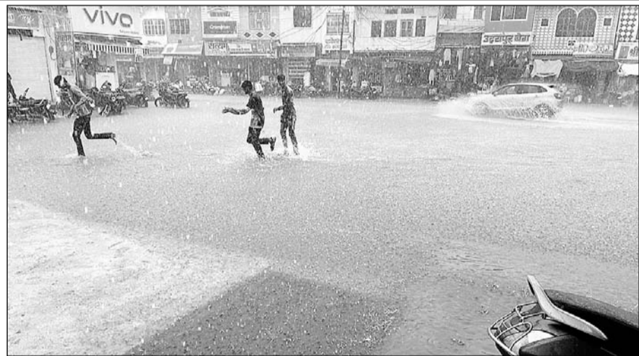
निम्बाहेड़ा करवे में बरसात का लुत्फ उठाते युवक।

लगाया। नवलखा ने बताया कि भाजपा के शासन काल में जिस प्रकार वर्षा ऋतु से पूर्व ही नगर के नालों आदि की सफाई समय रहते करवा ली जाती थी। दूसरी ओर वर्तमान कांठोस बोर्ड ने वर्षों से पूर्व नालों की सफाई के लिए निविदा तक निकालना उचित नहीं समझा, जिस वजह से नालों की सफाई के अभाव में नगर के बस स्टैंड, मोतीबाजार, शेखावत सर्कल, इंद्र कॉलोनी, निवेदिता कॉलोनी, शास्त्री मार्केट, छोटीदांडी रोड सहित नगर के विभिन्न क्षेत्रों में जलभराव की स्थिति होकर लोगों के घरों में नालों का गन्दा पानी भर गया जिससे आम लोगों को परेशानी उठानी पड़ी। यदि कांठोस शासित नगर पालिका बोर्ड यदि समय रहते नगर के प्रति गम्भीर हो जाता तो आज यह स्थिति नहीं होती।