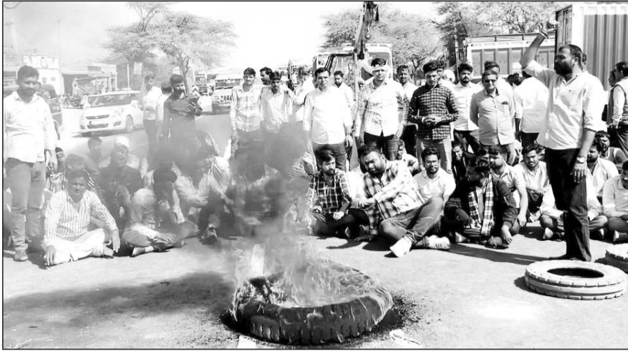
लूणकरणसर में सिंचाई के लिए नहरी पानी देने की मांग को लेकर चक्का जाम के दौरान टायर जलाकर विरोध-प्रदर्शन किया।

शनिवार को सुबह से ही किसानों के दल लूणकरणसर कस्बे के साथ ही आसपास के गांवों में भी सक्रिय हो गए। हर तरफ दुकानें बंद हैं और कामकाज ठप रहा। मुख्य बाजार से लेकर अंदर की गलियों तक में दुकानें बंद रही। हालांकि कुछ दुकानदारों ने अपनी दुकानें खोल ली हैं। आवश्यक सेवाओं को वैसे ही बंद नहीं किया जा रहा।