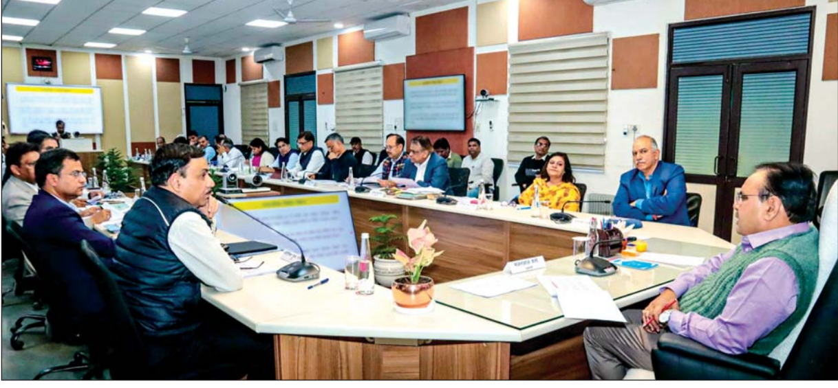
मुख्यमंत्री भजनलाल शर्मा ने मुख्यमंत्री निवास पर भरतपुर व डीग जिले के विकास कार्यों की समीक्षा की। उन्होंने कहा, राज्य सरकार विकास कार्यों के रोडमैप के जरिए भरतपुर व डीग जिले का चहुमुंबी विकास सुनिश्चित कर रही है।