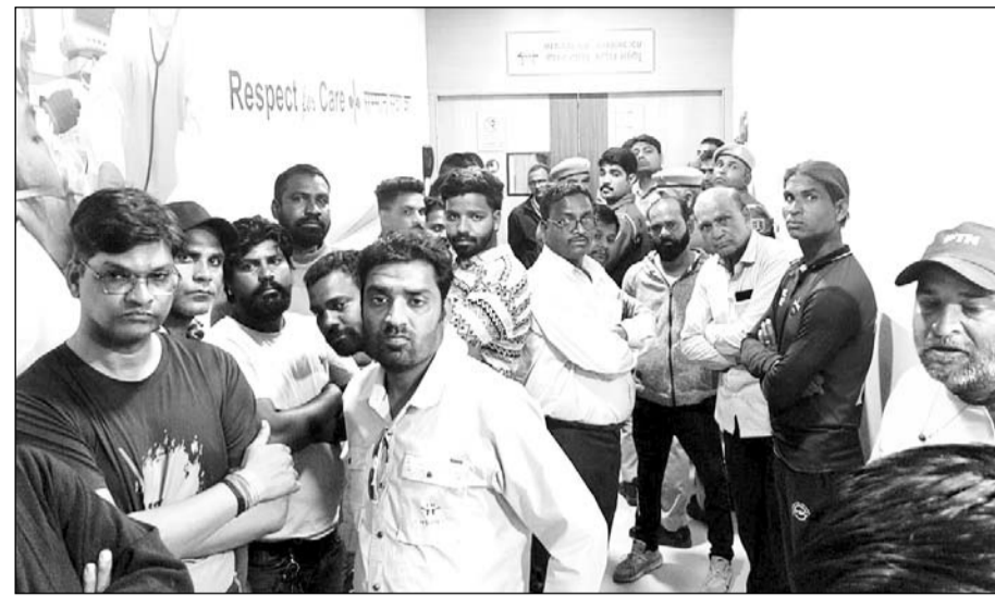
परिजनो ने चिकित्सकों पर लापरवाही का आरोप लगाते हुए हंगामा किया।