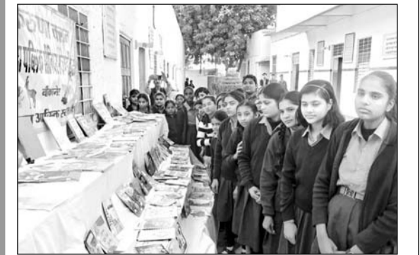
विद्यार्थियों ने बाल साहित्य दिशा एवं दशा कार्यक्रम में पुस्तक प्रदर्शनी का अवलोकन किया।