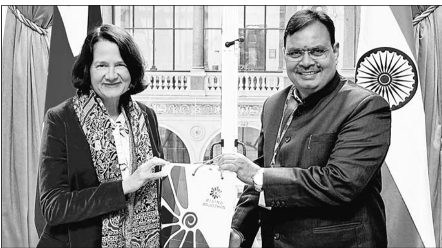
मुख्यमंत्री भजनलाल शर्मा, उप मुख्यमंत्री दीपा कुमारी और राजस्थान सरकार के उच्चस्तरीय प्रतिनिधिमंडल ने ब्रिटेन सरकार की मंत्री (इंडो पैसिफिक क्षेत्र) कैथरीन वेस्ट के साथ मुलाकात की और लंदन के पैलेस ऑफ वेस्टमिंस्टर में ब्रिटेन की संसद का दौरा किया।

प्रतिनिधिमंडल के सदस्यों के साथ मुख्यमंत्री भजन लाल शर्मा ने लंदन के