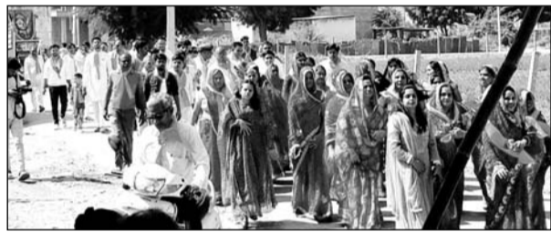
आसिंद में धूमधाम से मनाई गई महाराजा की जयंती।

समाज के वरिष्ठ जनों द्वारा अजमीढ़ जी महाराज की जीवनी के बारे में