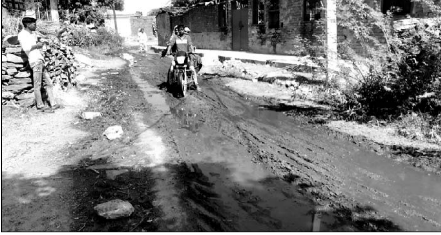
ग्राम लाछूडा में छाया है गंदगी का आलम।

आसिन्द, (निसं)। आसिंद उपखंड क्षेत्र के अंतर्गत लाछूडा ग्राम पंचायत के लाछूडा गांव एवं छापरीया खेड़ा गांव में चारों ओर कीचड़ फैला हुआ है। ग्रामीणों ने जानकारी देते हुए बताया कि गांव में फैली गंदगी के कारण मौसमी बीमारियों एवं डेंगू चिकनगुनिया सहित विभिन्न बीमारियों के खतरे का अंदेशा बना हुआ है। लाछूडा मुख्य बस स्टैंड पर ही स्थित एक निजी विद्यालय के शिक्षक ने बताया कि विद्यालय के बाहर कूड़ा कचरा अस्त व्यस्त तरीके से फैला हुआ है जिससे विद्यालय के बच्चों को आवागमन में परेशानी का सामना करना पड़ रहा है कई बार पंचायत प्रशासन को साफ सफाई के संबंध में अवगत करवाया लेकिन किसी भी प्रकार की सुनवाई पंचायत के द्वारा नहीं की गई। गांव में ही स्वच्छता के लिए ट्रैक्टर टाली की व्यवस्था भी नाम मात्र की कर रखी है।