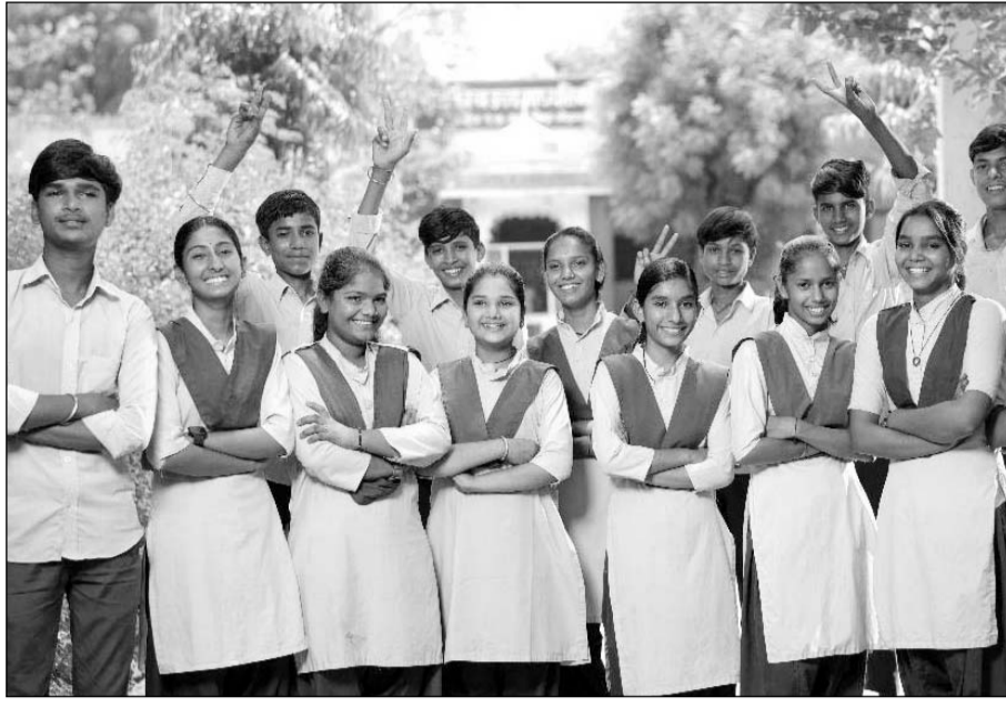
हिन्दुस्तान जिंक के शिक्षा संबल कार्यक्रम में अध्ययनरत विद्यार्थियों का उत्कृष्ट रहा परिणाम

हाल ही में घोषित माध्यमिक शिक्षा बोर्ड दसवीं के परिणामों में 92.53 प्रतिशत विद्यार्थी उत्तीर्ण हुए जिनमें से 39 प्रतिशत प्रथम श्रेणी प्राप्त है। 76 राजकीय विद्यालयों में से 37 का परिणाम शत-प्रतिशत रहा। इस वर्ष के परिणामों की उपलब्धि शिक्षा संबल कार्यक्रम के तहत छात्राओं का परिणाम है जिसमें कुल 137 छात्राओं ने 75 प्रतिशत या उससे अधिक अंक हासिल किए हैं जो कि गार्गी पुरस्कार के लिए पात्र होंगे। यह एक प्रतिष्ठित सम्मान है जो राजस्थान में छात्राओं की शैक्षणिक उत्कृष्टता के लिए प्रदान किया जाता है। इसी प्रकार हाल ही में घोषित कक्षा 12वीं की बोर्ड परीक्षा के नतीजों में 99.43 प्रतिशत विद्यार्थी उत्तीर्ण हुए, जिनमें से 86.36 प्रतिशत ने प्रथम श्रेणी हासिल की है। वित्तीय वर्ष 2016 में शिक्षा संबल कार्यक्रम शुरू होने के बाद से कुल उत्तीर्ण प्रतिशत 67 प्रतिशत से बढ़कर 92.53 प्रतिशत हो गया है, जो कि 38 प्रतिशत अधिक है। कक्षा 1वीं