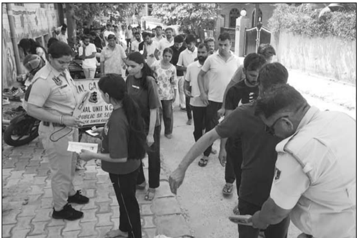
सब इंस्पेक्टर भर्ती-2025 की दो दिवसीय लिखित परीक्षा के पहले दिन रविवार को परीक्षा केंद्रों पर युवाओं की गहन तलाशी ली गई।