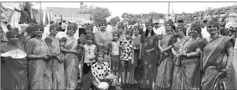
प्रांतीय गुर्जर गौड ब्राह्मण महिला सभा की ओर से हनुमान जन्मोत्सव पर भव्य शोभायात्रा निकाली गई।

जयपुर। शहर में हनुमान जन्मोत्सव पर भव्य शोभायात्रा का आयोजन अत्यंत श्रद्धा, उल्लास एवं धार्मिक उत्साह के साथ किया गया। इस अवसर पर प्रांतीय गुर्जर गौड ब्राह्मण महिला सभा द्वारा सुसज्जित भव्य मंच आकर्षण का मुख्य केंद्र रहा। मंच को पारंपरिक एवं धार्मिक सजावट से अलंकृत किया गया, जहाँ महिलाओं ने सामूहिक रूप से आरती, भजन-कीर्तन एवं सांस्कृतिक प्रस्तुतियों के माध्यम से भगवान हनुमान की भक्ति में अपनी श्रद्धा अर्पित की। इस आयोजन