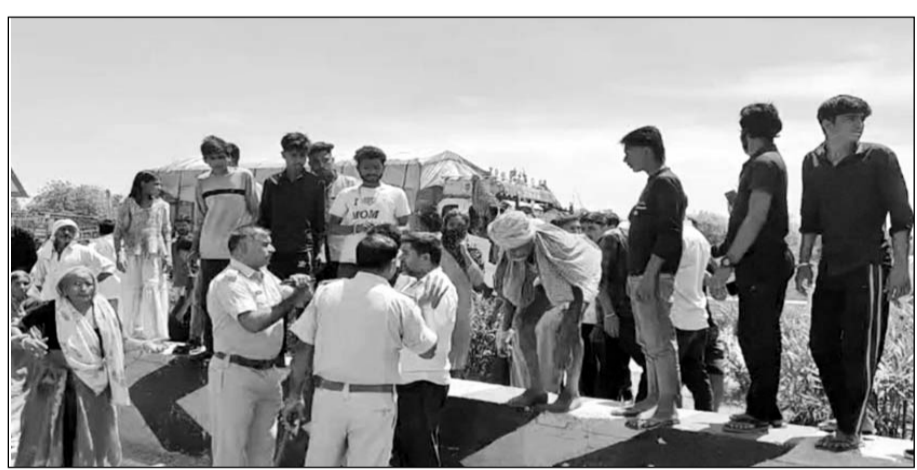
बूंदी जिले के तालेड़ा उपखंड क्षेत्र के खुराड़ गांव में खेतों में आगजनी की घटना के बाद आक्रोशित ग्रामीणों ने हाईवे जाम कर दिया जिसे पुलिस ने समझाईश कर खुलवाया।