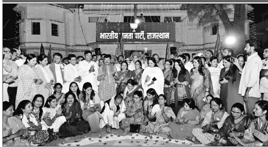
भाजपा के स्थापना दिवस की पूर्व संध्या पर प्रदेश कार्यालय में दीपोत्सव, आकर्षक रोशनी एवं भव्य आतिशबाजी की गई।

स्थापना दिवस की पूर्व संध्या पर भाजपा कार्यालय में आतिशबाजी और दीपोत्सव