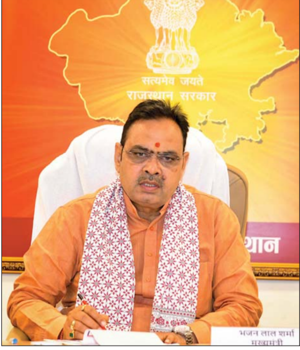
मुख्यमंत्री भजनलाल शर्मा

उन्होंने कहा कि दूसरे चरण में 337 पंचायत समितियों में एक लाख से अधिक कार्य करवाने का लक्ष्य रखा गया। जिसके विरुद्ध 2 हजार 880 करोड़ रुपये के 1 लाख 4 हजार से अधिक कार्यों का अनुमोदन किया जा चुका है। इनमें से 1 हजार 48 करोड़ से