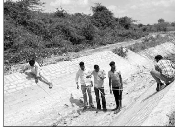
उदयपुर के उदयसागर बांध की नहरों एवं बागोलिया फीडर के निर्माण कार्य का अतिरिक्त मुख्य अभियंता वीरेंद्र सिंह सागर ने निरीक्षण किया।

निरीक्षण के दौरान बताया गया कि मावली क्षेत्र में सिंचाई से संबंधित समस्याओं के समाधान हेतु बागोलिया फीडर का निर्माण कराया जा रहा है। परियोजना पूर्ण होने पर लगभग 17 गांवों को 3676 हेक्टेयर भूमि को सिंचाई सुविधा उपलब्ध होगी तथा क्षेत्र में पेयजल आपूर्ति में भी सुधार होगा। इसके साथ ही