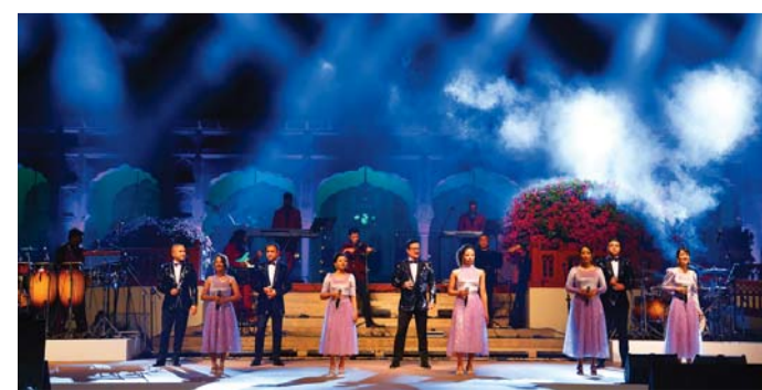
Shilong Chamber Choir Performs at the Rambagh Palace, Jaipur (1).

At the front lawns of the palace, against the resplendent facade, an exquisite fashion showcase was presented, continuing the Rambagh's timeless tradition of spot-lighting glamour and glory at all its sparkling soirees. The spectacular show was curated