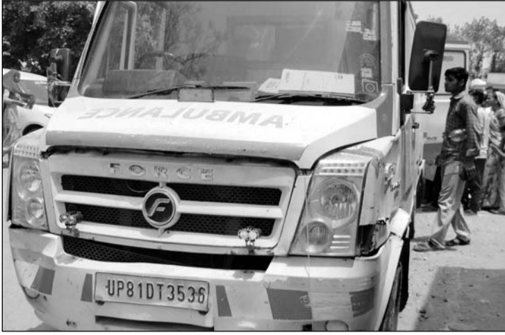
हिण्डौन सिटी के राजकीय जिला अस्पताल की 108 एंबुलेंस में कई खामियां मिलीं।

परिजनों ने आरोप लगाया कि एंबुलेंस में मौजूद खामियों के कारण मरीज की हालत लगातार बिगड़ती रही। स्थिति गंभीर होने पर एंबुलेंस कर्मियों ने दूसरी एंबुलेंस बुलाने की बात कही, जिससे मरीज को करीब आधे घंटे