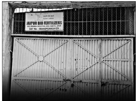
कृषि मंत्री डॉ. किरोड़ीलाल मीणा ने गुरुवार को कानोता क्षेत्र स्थित हीरावाला रीको औद्योगिक क्षेत्र में संचालित 'जयपुर बायो फर्टिलाइजर्स' इकाई पर औचक निरीक्षण कर कार्रवाई की।

■ मंत्री किरोड़ीलाल ने दोषियों पर सख्त कार्रवाई की चेतावनी दी