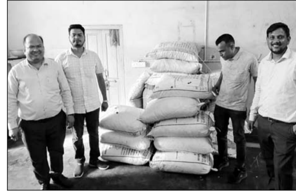
खाद्य सुरक्षा विभाग की टीम ने भीलवाड़ा में कार्रवाई की।

■ खाद्य सुरक्षा विभाग की टीम ने 1250 किलो चटगोला व आंवला कैन्डी सीला की