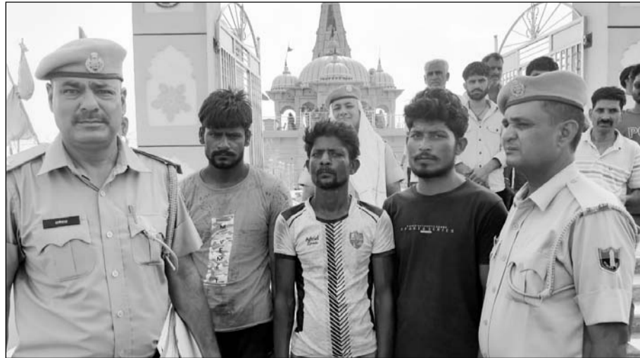
पुलिस ने मौके पर आरोपियों से सीन रिक्रिएशन कराकर साक्ष्य जुटाए और वारदात की तस्वीर की।