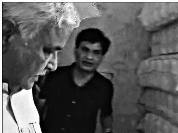
कृषि मंत्री डॉ. किरोड़ीलाल मीणा ने गुरुवार को कानोता क्षेत्र स्थित हीरावाला रीको औद्योगिक क्षेत्र में संचालित 'जयपुर बायो फर्टिलाइजर्स' इकाई पर औचक निरीक्षण कर कार्रवाई की।

-कार्यालय संवाददाता- जयपुर। प्रदेश में नकली खाद और बीज के कारोबार के खिलाफ चलाए जा रहे विशेष अभियान के तहत कृषि मंत्री डॉ. किरोड़ीलाल मीणा ने गुरुवार को जयपुर के कानोता क्षेत्र स्थित हीरावाला रीको औद्योगिक क्षेत्र में संचालित 'जयपुर बायो फर्टिलाइजर्स' इकाई पर औचक निरीक्षण कर बड़ी कार्रवाई की। मंत्री के आचानक पहुंचने