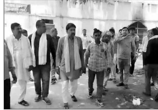
ग्रामीणों ने आरोपियों की गिरफ्तारी को लेकर प्रदर्शन किया