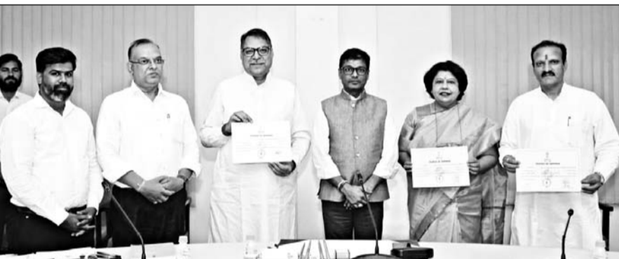
राजस्थान से राज्यसभा की तीन सीटों पर डॉ. सतीश पूनिया, डॉ. अलका सिंह व नीरज डांगी चुने गये।

-कार्यालय संवाददाता- जयपुर। राजस्थान से राज्यसभा द्वितीय निर्वाचन-2026 के तहत तीनों प्रत्याशी गुरुवार को निर्विरोध निर्वाचित घोषित कर दिए गए। भारतीय जनता पार्टी के डॉ. सतीश पूनियां और डॉ. अलका सिंह तथा कांग्रेस के नीरज डांगी को विधानसभा परिसर में निर्वाचन प्रमाण पत्र प्रदान किए गए। राज्यसभा चुनाव के रिटर्निंग