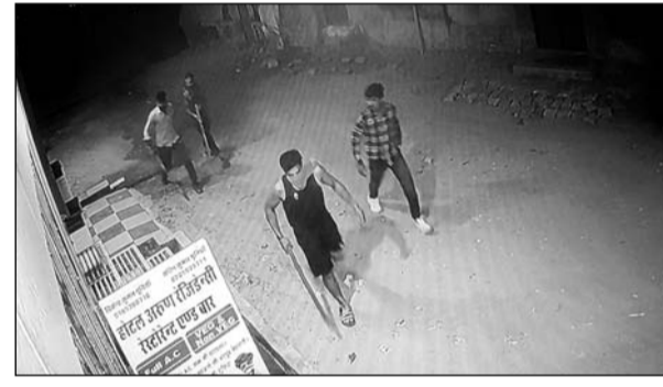
तोड़फोड़ करते बदमाश सीसीटीवी फुटेज में कैद हो गये।

सादुलपुर, (निसं)। राजगढ़ थानातर्गत रेलवे स्टेशन सादुलपुर के पास एक होटल रेस्टोरेंट एण्ड बार में बीती रात्रि को दो नामजद आरोपियों सहित 7-8 अन्य बदमाशों को दो लाख