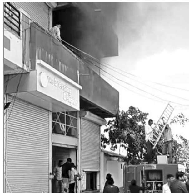
जालोर शहर के वन वे रोड स्थित कॉम्प्लेक्स में लगी आग को दमकल की सहायता से काबू में किया।