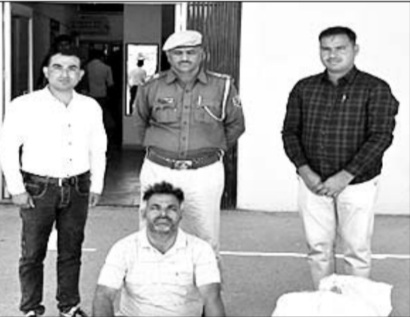
पुलिस ने डोडा तस्कर को गिरफ्तार किया।

जिला स्पेशल टीम को मुखबिर खास से सूचना मिली कि एक व्यक्ति गहलोट कॉलोनी रेलवे लाइन के पास एक प्लास्टिक के कट्टे में अवैध मादक पदार्थ डोडा पोस्ट लिपे हुए बेचने की फिंराक में मूय रहा है। जिस पर जिला स्पेशल टीम व थानाधिकारी पुलिस थाना साकेतनगर मय टीम द्वारा त्वरित कार्यवाही करते हुए गहलोट कॉलोनी रेलवे लाइन के पास पहुंचे तो मुताबिक सूचना के एक व्यक्ति प्लास्टिक का कट्टा लेकर जाता हुआ दिखा जो पुलिस टीम