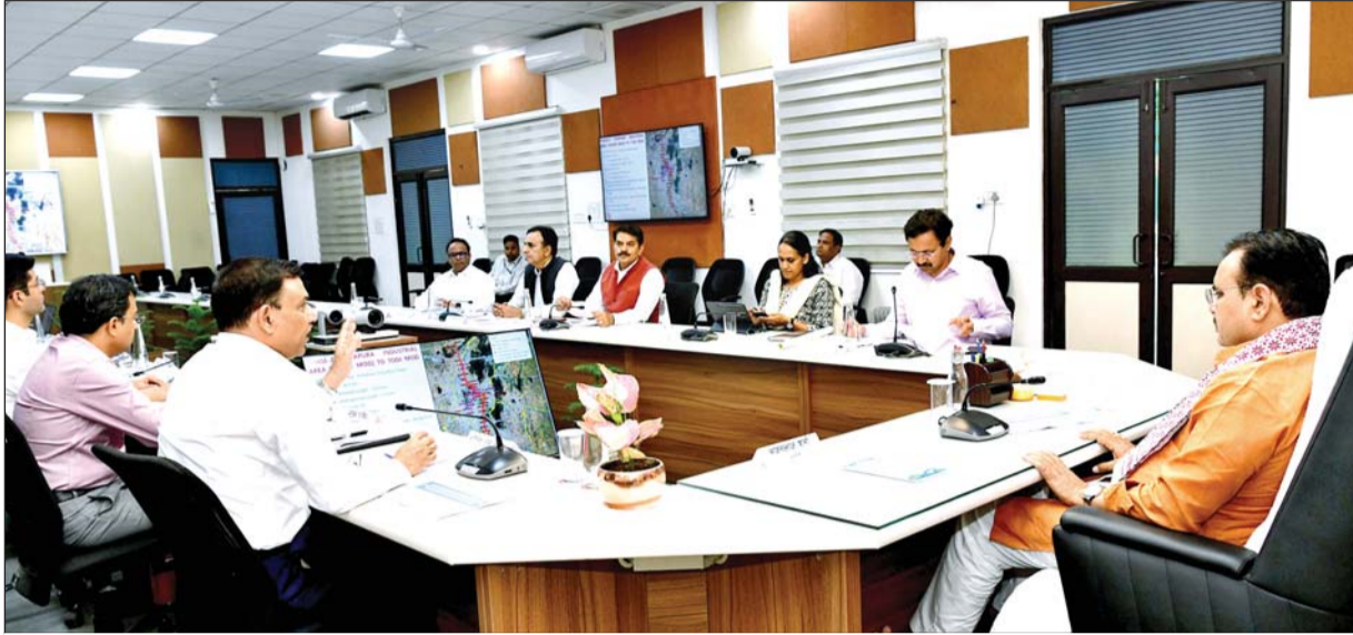
मुख्यमंत्री भजनलाल शर्मा ने मंगलवार को मैट्रो अलाइन्मेंट के संबंध में बैठक की और सीतापुरा-अंबाबाड़ी मैट्रो कॉरिडोर विस्तृत परियोजना रिपोर्ट 31 मार्च तक पूरी करने के निर्देश दिए।

मुख्यमंत्री भजनलाल शर्मा ने जयपुर में मैट्रो अलाइन्मेंट पर दिशा निर्देश दिये