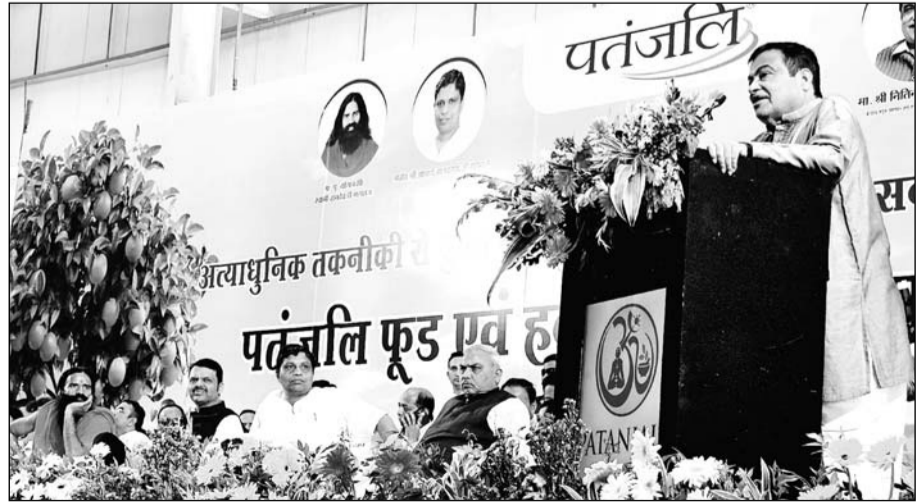
सड़क परिवहन, राजमार्ग व जहाजराणी मंत्री नितिन गडकरी तथा महाराष्ट्र के मुख्यमंत्री देवेन्द्र फडणवीस ने मिहान, नागपुर में स्थापित संतरा प्रोसेसिंग के एशिया के सबसे बड़े प्लांट ‘पतंजलि मेगा फूड एंड हर्बल पार्क’ का विधिवत उद्घाटन किया। इस दौरान स्वामी रामदेव और आचार्य बालकृष्ण मौजूद थे।

हिन्दवी साम्राज्य के संस्थापक छत्रपति शिवाजी महाराज को नमन करते हुए फडणवीस ने कहा कि हमारे इंफ्रास्ट्रक्चर में नमन नितिन गडकरी, स्वामी रामदेव व आचार्य बालकृष्ण ने प्रदेश में पतंजलि के सेवा विस्तार का जो सपना देखा था वह अब भव्य रूप से साकार हो रहा है। इसकी स्थापना में अनेक बाधाएँ व विघ्न आए लेकिन स्वामी का संकल्प था कि चाहे जितनी भी बाधाएँ आएँ हम यह संकल्प पूर्ण करके रहेंगे और आज वह संकल्प पूर्ण हो रहा है। पतंजलि का उद्देश्य यहाँ के किसानों को समृद्धि है। उन्होंने बताया कि आचार्य जी से वार्ता के अनुसार क्षेत्र के सारे संतरों का केंद्र भी यही फूड पार्क बनेगा। उद्घाटन अवसर पर नितिन गडकरी ने कहा कि मैं सर्वप्रथम स्वामी