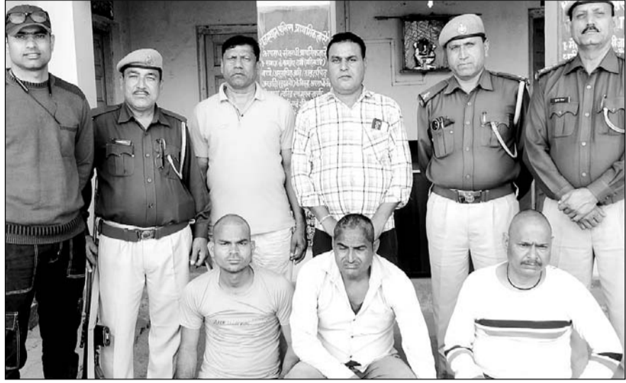
एंटी गैंगस्टर टास्क फोर्स, सीआईडी सीबी एवं थाना गद्दी बाजना की पुलिस टीम ने संयुक्त कार्रवाई कर तीन बदमाशों को गिरफ्तार किया।