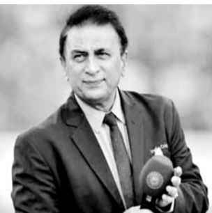
गावस्कर से इस बारे में सवाल किया गया तो जाने उन्होंने क्या जवाब दिया। सुनील गावस्कर से हाल ही में स्पोर्ट्स सेंट्रल पर पाकिस्तानी क्रिकेट शो ड्रेसिंग रूम में ये सवाल पूछा गया था और उन्होंने कहा कि जब तक सीमा पर शांति नहीं हो जाती, तब

नई दिल्ली, 28 फरवरी। भारत और पाकिस्तान के बीच आखिरी द्विपक्षीय सीरीज खेले हुए एक दशक से भी ज्यादा का समय हो गया है। राजनीतिक मसलों के कारण से ये दोनों टीमों बहुराष्ट्रीय टूर्नामेंट में ही एक दूसरे के खिलाफ खेलती नजर आती हैं। वहीं इंडिया वर्ल्ड चटना जैसे पाकिस्तान आखिरी द्विपक्षीय सीरीज 2012-13 में खेली गई थी जिस पाकिस्तान ने भारत का दौरा किया था, वहीं टीम इंडिया तो 2005-06 में आखिरी बार पाकिस्तान गई थी। हालांकि, पाकिस्तान अक्सर भारत के खिलाफ द्विपक्षीय सीरीज खेलने को इच्छा जताता रहा है लेकिन भारत की ओर से कभी भी इसका जवाब नहीं दिया गया। इसका मुख्य कारण बॉर्डर पर अशांति है। जब टीम इंडिया के लीजेंड सुनील