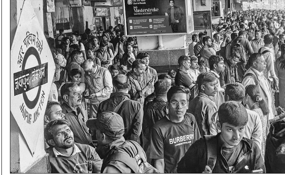
रीट की परीक्षा खत्म हुई तो घर लौटने वालों का रैला लग गया। जयपुर जंक्शन पर जान जोखिम में डालकर अभ्यर्थी रैलागाड़ी पर चढ़ने का प्रयास कर रहे थे।