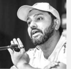
दुबई, 28 फरवरी। आईसीसी चैंपियंस ट्रॉफी 2025 में टीम इंडिया का अगला मुकाबला न्यूजीलैंड से 2 मार्च को है। भारत सेमीफाइनल में अपनी जगह पक्की कर चुका है ऐसे में ये मैच सिर्फ एक औपचारिकता ही है। ऐसे में हैमस्ट्रिंग इंजरी से जूझ रहे रोहित शर्मा को इस मैच के लिए आराम दिया जा सकता है। इंडियन एक्सप्रेस की रिपोर्ट के अनुसार टीम मैनेजमेंट इस मुद्दे पर विचार भी कर रहा है।

भारत का सेमीफाइनल मुकाबला 4 मार्च को होगा। ऐसे में टीम मैनेजमेंट रोहित शर्मा पर कम से कम दबाव बनाना चाहेगी। अगर रोहित शर्मा को न्यूजीलैंड के खिलाफ रेट्ट दिया जाता है तो कुछ देर के लिए गुला ने ही टीम को कप्तान संभालनी थी। हालांकि, कुछ देर बाद ही रोहित वापस मैदान पर आ गए थे। लेकिन वह 100 प्रतिशत फिट नहीं दिखाई दे रहे थे। रिपोर्ट्स के अनुसार रोहित शर्मा और शुभमन गिल दोनों ने ही बुधवार को हुए ब्रेकिंग प्रैक्टिस सेशन में हिस्सा नहीं लिया था। चोटिल होने के कारण रोहित की जगह गिल अच्छा महसूस नहीं कर रहे थे।