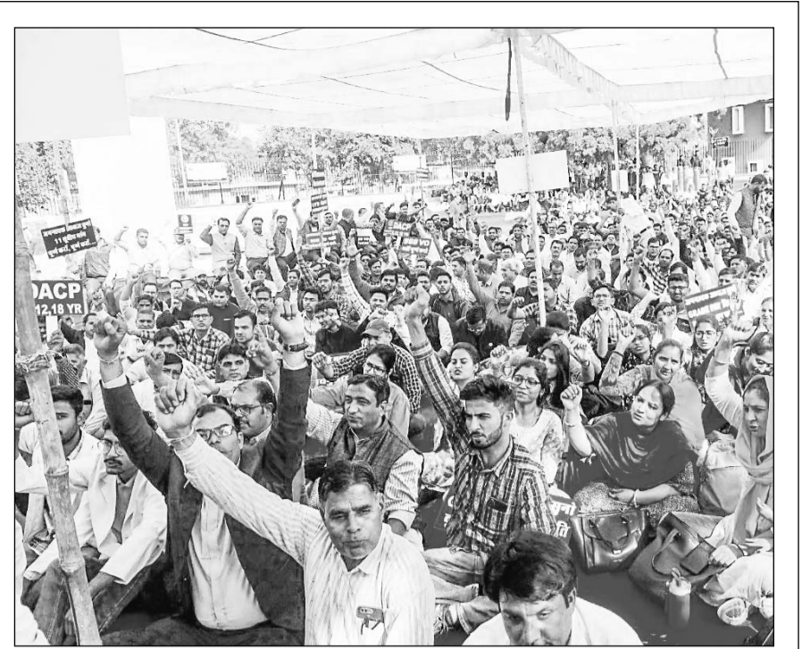
प्रदेशभर से जयपुर पहुंचे पशु चिकित्सकों ने अपनी 11 सूत्रीय मांगों को लेकर मंगलवार को एमआई रोड स्थित शहीद स्मारक पर एकत्रित होकर राज्य सरकार के खिलाफ नारेबाजी कर धरना दिया।

अधिवेशन में कार्यकर्ताओं ने हुनरबाज मंच के माध्यम से प्रतिभा प्रदर्शन कर विभिन्न प्रस्तुतियां भी दी। रंगारंग कार्यक्रमों में भारत के विभिन्न प्रांतों की मनमोहक परंपराओं का चित्रण सजीव हो उठा। अधिवेशन के अंतिम दिन परिषद की नवीन राष्ट्रीय कार्यकारिणी की भी घोषणा हुई।