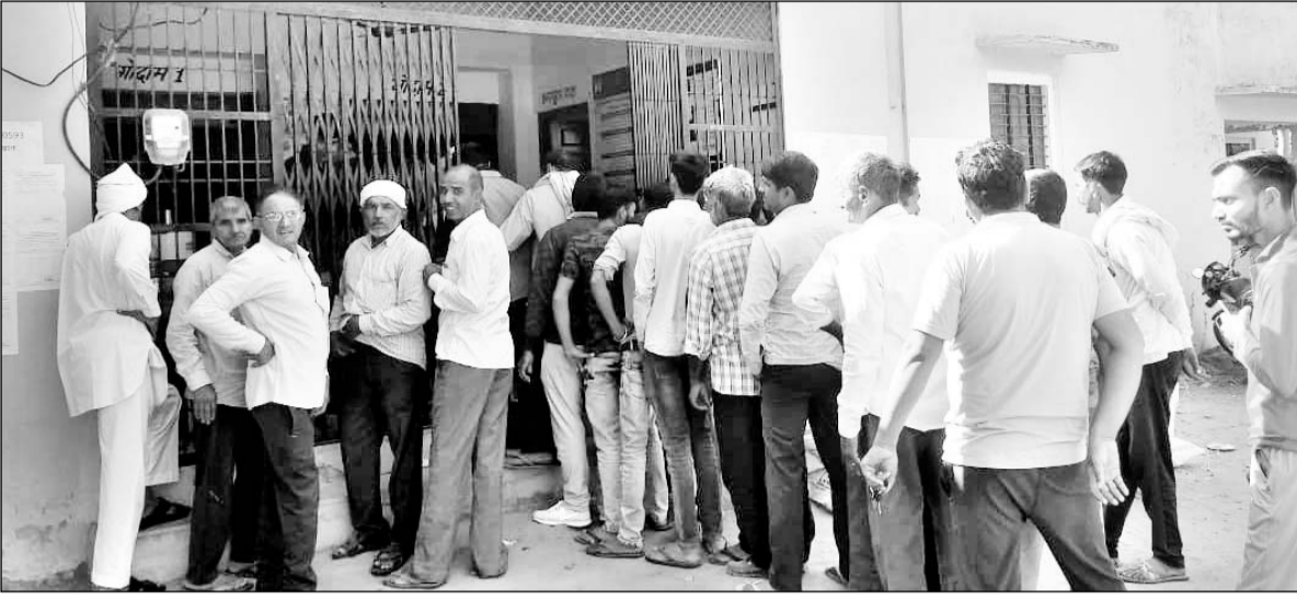
भैसावता ग्राम सहकारी समिति कार्यालय के बाहर लगी किसानों की लाइन।

यूरिया के लिए लाइन में खड़े किसान निराश होकर लौटे