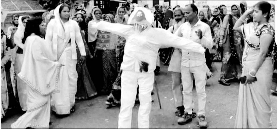
जिला कलेक्ट्री के बाहर बाबा रामदेव का पुतला दहन करते कांग्रेस महिला मोर्चा के कार्यकर्ता।