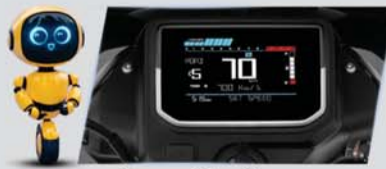
मल्टीकलर डिस्प्ले 60+ फीचर्स