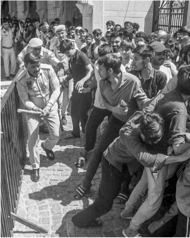
जयपुर में इंडियन प्रीमियर लीग-2026 मैच के स्टूडेंट्स के टिकट 4 घंटे में बिके : टिकट नहीं मिलने युवाओं ने फाड़ें बैनर और पुलिस ने चलाये डंडे।