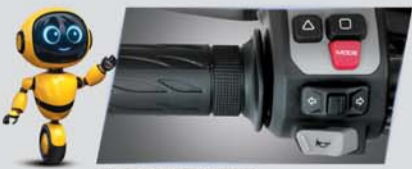
राइड बाय वायर 3 राइड मोड्स