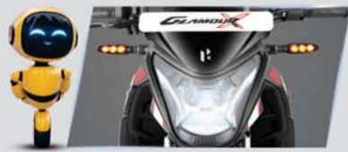
ऑल LED सेटअप