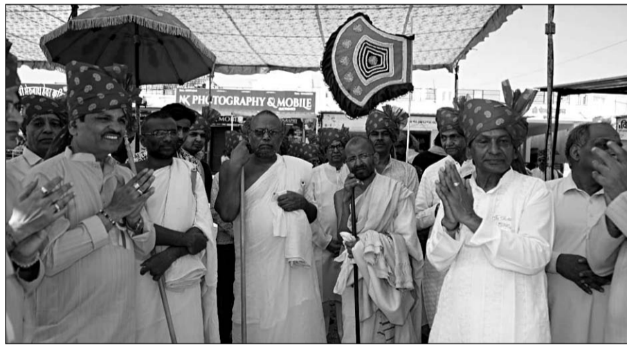
राजसमंद के श्री नाकोड़ा धाम पड़ासली में आयोजित प्रतिष्ठा महोत्सव में जैन संतों का मंगल प्रवेश हुआ।

मंगल प्रवेश के दौरान श्रद्धालुओं की बड़ी संख्या उपस्थित रही, जिन्होंने जयकारों और भक्ति भाव से संतों का अभिनंदन किया। इस अवसर पर 35 फीट ऊंची नाकोड़ाजी की भव्य प्रतिमा सभी के आकर्षण का केंद्र रही। संतों ने प्रतिमा के दर्शन कर इसे ऐतिहासिक एवं दुर्लभ स्थल बताया और इसकी भव्यता की सराहना की। उन्होंने कहा कि इस प्रकार के धार्मिक स्थल समाज में आस्था और संस्कृति के संवाहक होते हैं। कार्यक्रम समिति के संयोजक