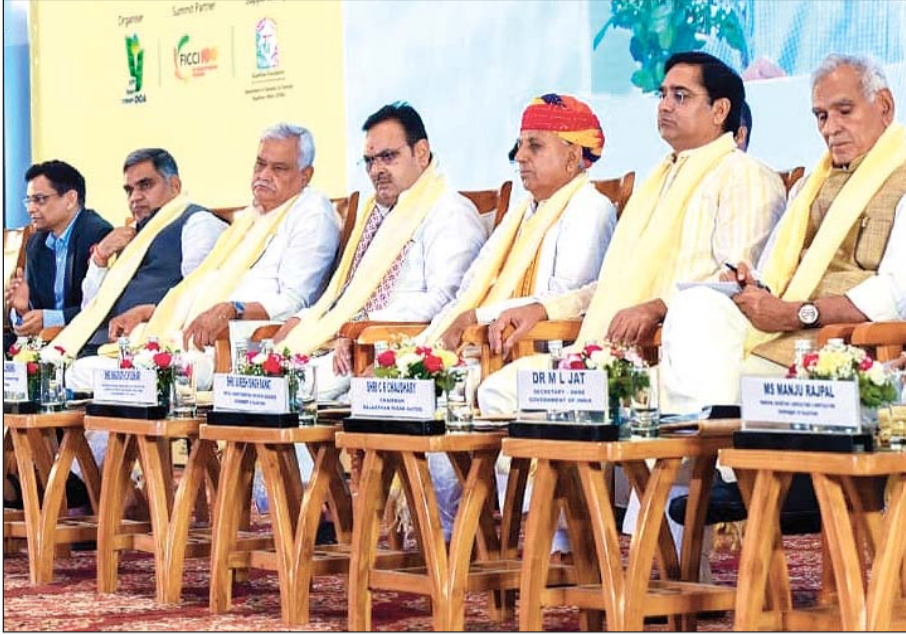
मुख्यमंत्री भजनलाल शर्मा ने गुरुवार को नई दिल्ली में आयोजित ग्राम-2026 इन्वेस्टर मीट को संबोधित किया।

■ मुख्यमंत्री भजनलाल शर्मा ने कहा कि बाजरा, सरसों, तिलहन, जौ, ग्वार, ईसबगोल व जीरे के उत्पादन में राजस्थान का देश में प्रथम स्थान है। दलहन उत्पादन के लिए झालावाड़ व टोंक को मॉडल जिले के रूप में विकसित किया जा रहा है।