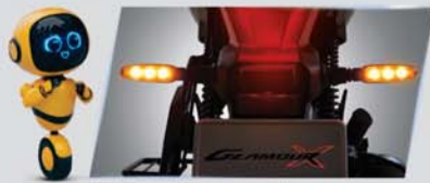
पैनिंक ब्रेक अलर्ट