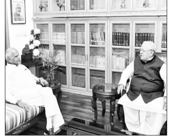
राज्यपाल कलराज मिश्र से पंजाब के राज्यपाल बनवारीलाल पुरोहित ने शुक्रवार को राजभवन में मुलाकात की। राज्यपाल मिश्र से उनकी यह शिष्टाचार भेंट थी।