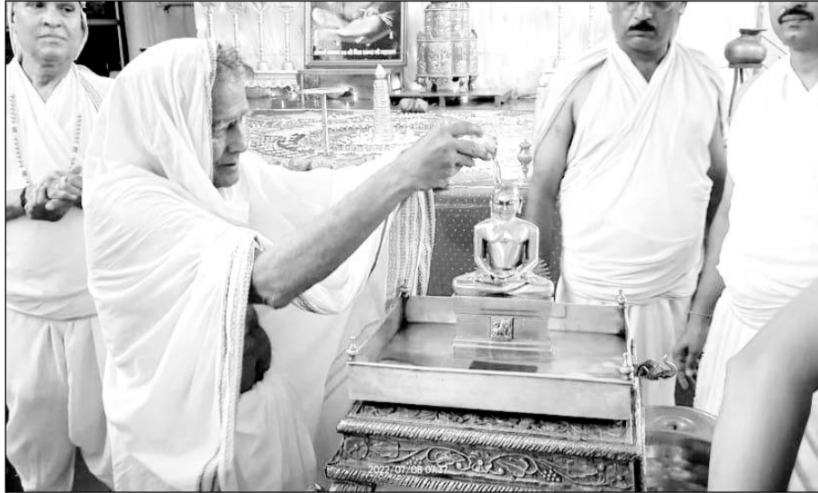
शहर के श्री शांतिनाथ दिगंबर जैन मंदिर में अष्टानिका पर्व पर सिद्धों की आराधना की जा रही है।

रामगंजमंडो (निर्स)। शहर के श्री शांतिनाथ दिगंबर जैन मंदिर में अष्टानिका पर्व पर सिद्धों की आराधना की जा रही है। सिद्धचक्र महामंडल विधान हो रहा है।