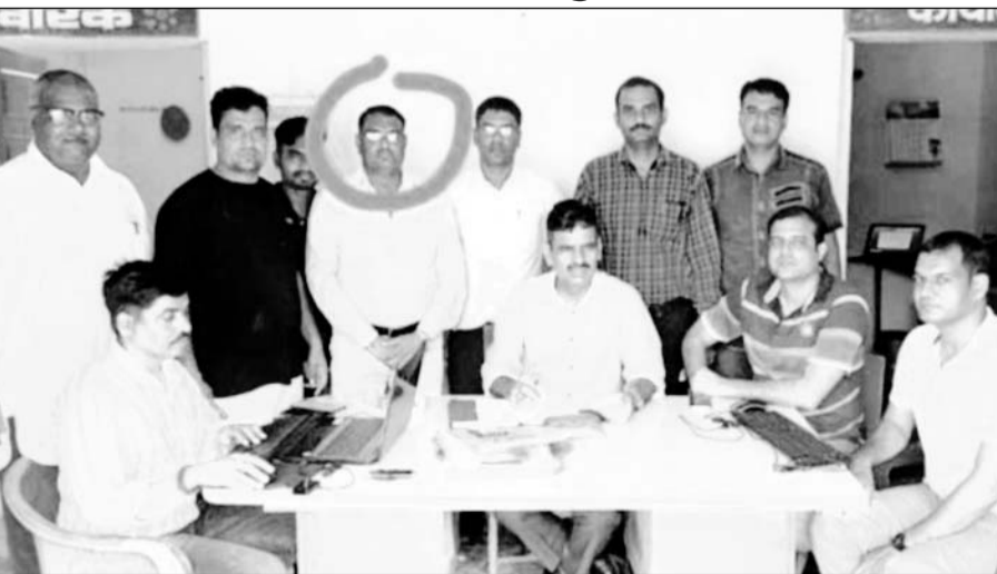
कोटा एसीबी ने बारां शहर की हाउसिंग बोर्ड पुलिस चौकी में कारवाई की।