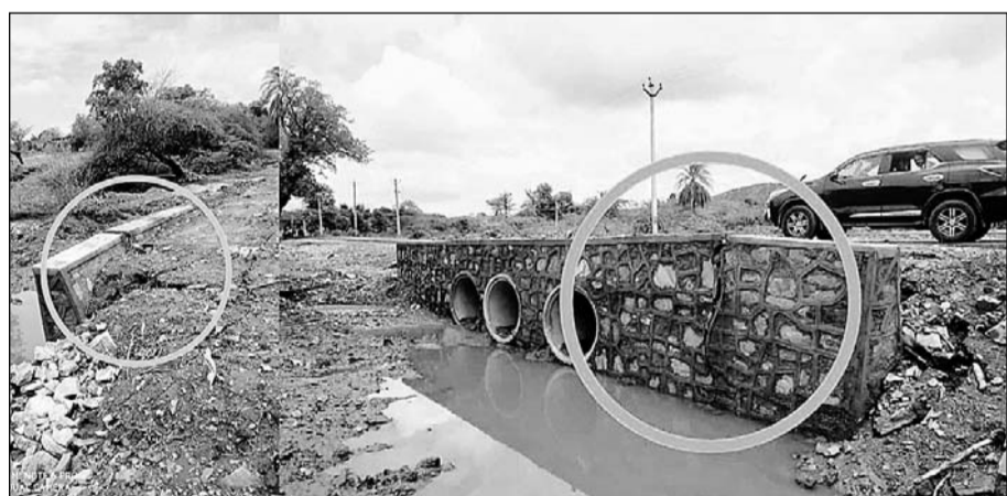
खैरवाड़ा-डूंगरपुर मार्ग पर बारो का शेर के निकट क्षतिग्रस्त निर्माणाधीन पुल की दीवारें।

इस पूरी सड़क के निर्माण के लिए केन्द्रीय सड़क परिवहन द्वारा डेढ सौ करोड़ की लागत से बनाने का कार्यदिश व वित्तीय स्वीकृति जनवरी 2022 में जारी की गई है। इसके तहत कार्यकारी एजेन्सी द्वारा पहले चरण में बीते सात माहों में केवल पुलियाओं के निर्माण भी पूरी तरह नहीं कर पाई है और अभी से पुल क्षतिग्रस्त होने लग गये हैं। प्राप्त जानकारी के अनुसार