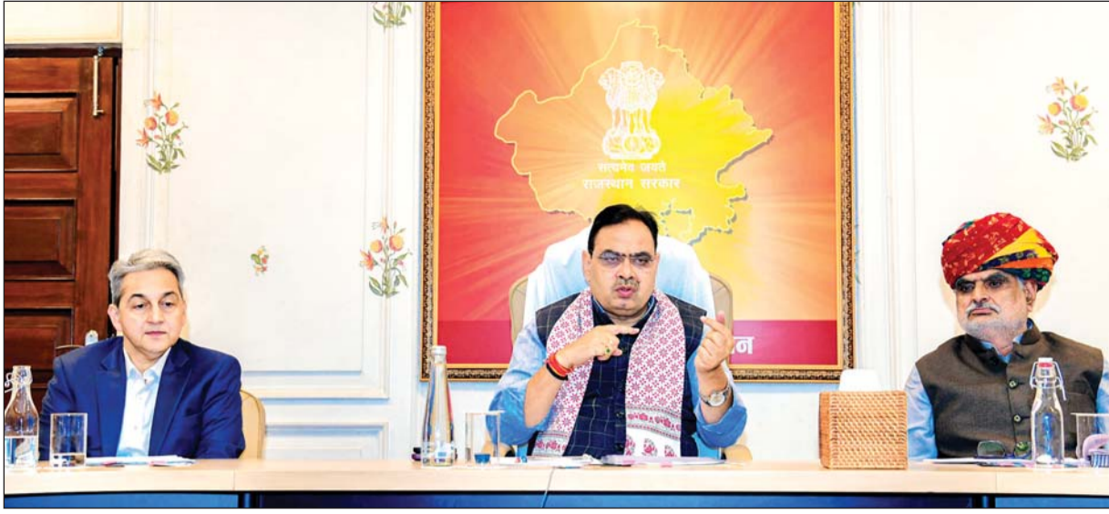
मुख्यमंत्री भजनलाल शर्मा ने नगरीय विकास विभाग की समीक्षा बैठक में विभागीय घोषणाओं की समीक्षा कर उनकी कार्यप्रगति की जानकारी ली तथा उन्हें शीघ्र पूरा करने के निर्देश दिए।