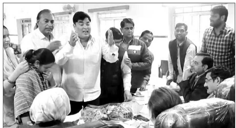
नगरपरिषद चौमू की साधारण सभा की बैठक में पार्षदों ने हंगामा किया।

जैसे ही मीटिंग शुरू हुई भाजपा पार्षदों ने पूर्व में किए गए भ्रष्टाचार के खिलाफ सभापति से जवाब मांगा