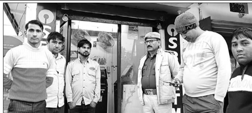
दौसा से आई एमओबी व एफएसएल की टीम सहित पुलिस ने साक्ष्य जुटाए।

गोजगढ़ चौकी प्रभारी सोबरन सिंह ने बताया कि रात्रि करीब तीन बजे कस्बे के मुख्य बाजार में लगे एसीबीआई बैंक के एटीएम को लूट की वारदात को अंजाम देने के लिए बदमाश गैस कटर व अन्य उपकरण लेकर पहुंचे। बदमाश इतने शांति थे