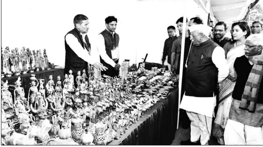
राज्यपाल हरिभाऊ किसनराव बागडे ने जवाहर कला केंद्र के शिल्प ग्राम में जनजातीय कार्य मंत्रालय, भारत सरकार, ट्राइफेड द्वारा आयोजित “आदि महोत्सव” का शुभारम्भ किया।

जयपुर। भारत सरकार के जनजातीय कार्य मंत्रालय के ट्राइफेड क्षेत्रीय कार्यालय, जयपुर की ओर से आदि महोत्सव 2024 का आयोजन 29 नवंबर से 8 दिसंबर तक किया जा रहा है। राज्यपाल हरिभाऊ किसनराव बागडे ने आज जवाहर कला केंद्र के शिल्प ग्राम में जनजातीय कार्य मंत्रालय, भारत सरकार, ट्राइफेड द्वारा आयोजित “आदि महोत्सव” का शुभारम्भ किया। उन्होंने इस अवसर पर महोत्सव में देशभर के राज्यों से भाग लेने वाले शिल्पकारों, कलाकारों का अभिनंदन करते हुए आम जन से आभार किया कि दैनिक जीवन में जनजातीय उत्पादों का अधिकाधिक उपयोग किया जाए।