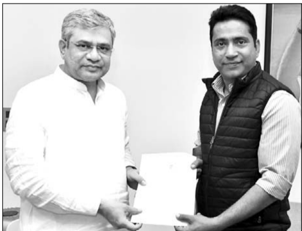
चुरू सांसद राहुल कस्वा ने रेलमंत्रि अश्विनी वैष्णव से मुलाकात की।

सांसद कस्वा ने रेल मंत्री को बताया कि रींगस से खाटू श्यामजी होते हुए सालासर धाम तक नई रेलवे लाइन बिछाने का कार्य होना है, जिसकी डीपीआर कार्य चल रहा है। चूंकि सालासर आकर यह मार्ग बंद हो जायेगा, जिसके चलते आगे की कनेक्टिविटी नहीं होने से इस मार्ग का व्यापक लाभ नहीं मिल पायेगा। अतः इस मार्ग निर्माण के कार्य को विस्तारित कर सुजानगढ़ तक किया जाना अति आवश्यक है, जिससे इन दोनों धार्मिक स्थलों की कनेक्टिविटी और भी बेहतर हो सके। यह मार्ग सुजानगढ़ से जुड़ते ही लाखों करोड़ों भक्तों के लिए सुगम हो जायेगा और बीकानेर, दिल्ली, श्रीगंगानगर व जोधपुर रूट से आने वाले भक्तों को काफी लाभ मिलेगा। अतः