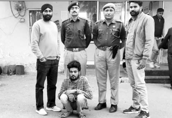
सुभाष नगर थाना पुलिस ने आरोपी को गिरफ्तार किया।

डोडा-चूरा तस्करी मामले में एक साल से फरार था