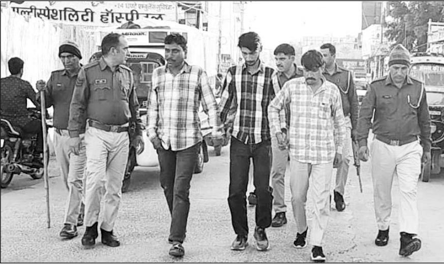
राजगढ़ थाना पुलिस ने गिरफ्तार आरोपियों को राजगढ़ कस्बे में पैदल घुमाकर जुलूस निकाला।

सादलपुर, (निस)। राजगढ़ कस्बे में बंद मकान में चोरी की घटना को अंजाम देने के मामले में अवैध हथियार और जिंदा कारतूस सहित गिरफ्तार आरोपियों को पुलिस ने शुक्रवार को न्यायालय में पेश कर तीन दिन का पुलिस रिमांड लिया है। शाम छह बजे पुलिस ने तीनों आरोपियों को शहर के मुख्य बाजार, बस स्टैंड, रेलवे स्टेशन, घंटाघर, शीतला चौक, पिलानी मोड़ पैदल घुमाकर आमजन को पुलिस में विश्वास अपराधियों में भय का संदेश दिया।