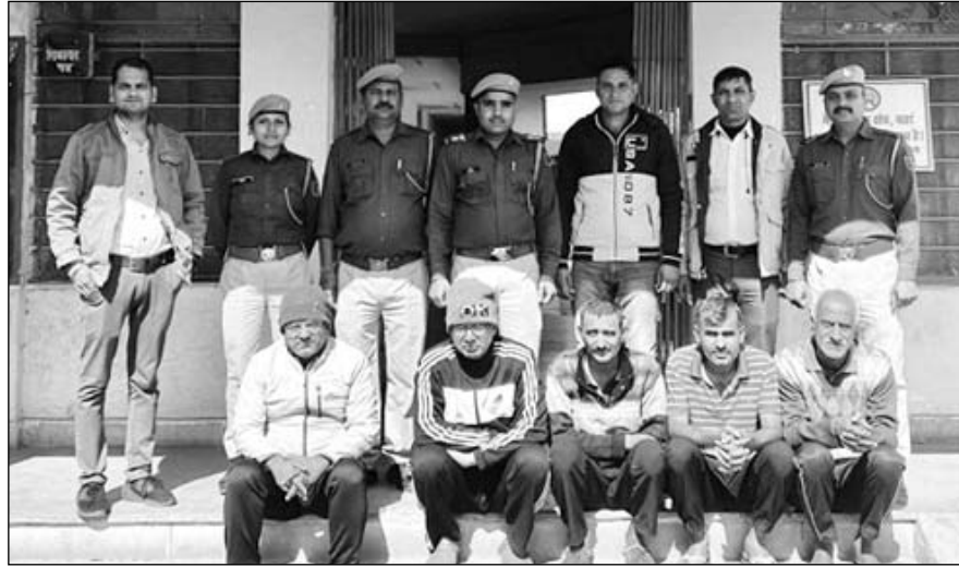
संजीवनी क्रेडिट को-ऑपरेटिव घोटाले के मास्टरमाइंड सहित पांच आरोपियों को गिरफ्तार किया।

शहर एसपी ने कहा कि फरियादी महिला ने शिकायत में कहा कि 8