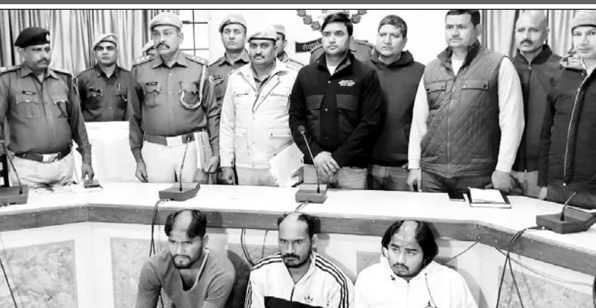
उद्योग नगर थाना पुलिस ने आरोपियों को गिरफ्तार किया।

भरतपुर, (निस)। मेडिकल कॉलेज के स्टूडेंट से रंगदारी की मांग करने वाले एवं स्कॉर्पियो लूट कर ले जाने के मामले में तीन आरोपियों को उद्योग नगर थाना पुलिस ने गिरफ्तार कर लिया। इसमें खास बात यह रही कि पीड़ित मेडिकल कॉलेज स्टूडेंट का दोस्त भी अपहरणकर्ताओं के साथ मिला हुआ था। पुलिस से बचकर भागते समय तीनों आरोपियों के पैर में चोट आई है।