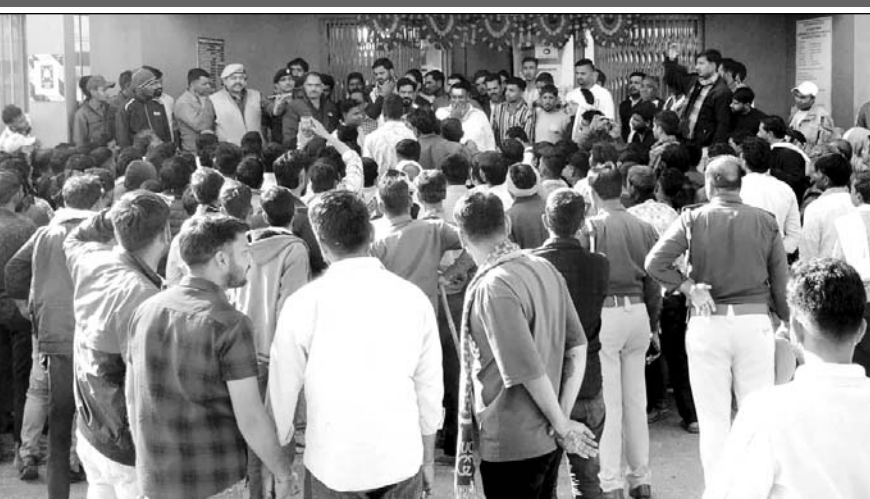
मुआवजे की मांग को लेकर परिजनों और ग्रामीणों ने प्रदर्शन किया।

परिजन और ग्रामीणों ने मृतक आश्रितों को मुआवजे सहित मांगों को लेकर प्रदर्शन किया