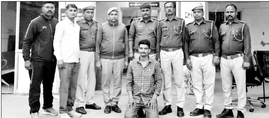
पुलिस ने अवैध हथियार सहित एक जने को गिरफ्तार किया।

फुलेरा, (निर्स)। फुलेरा थाना में संगठित अपराधियों के खिलाफ एमजीटीएफ की सूचना पर अवैध हथियारों के विरूद्ध बड़ी कार्रवाई की गई है। पुलिस ने अवैध हथियार 3 पिस्टल मय 5 मैगजीन मय 21 कारतूस जप्त कर एक आरोपी को गिरफ्तार किया।