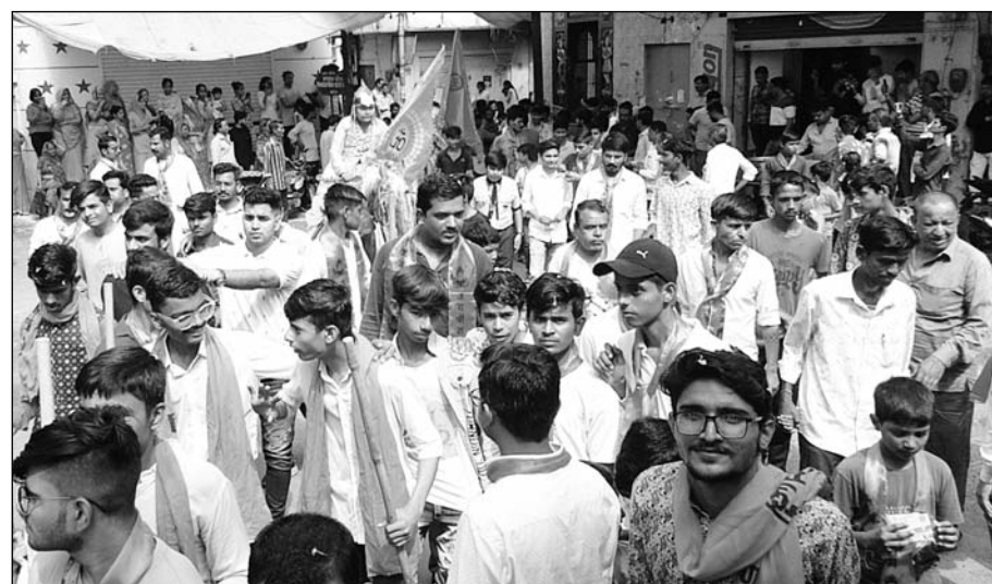
जालोर शहर में गणेश चतुर्थी पर्व पर शोभायात्रा निकाली।

स्वागत किया गया। वहीं शोभायात्रा में विभिन्न निजी विद्यालय की ओर से देवी देवताओं की श्रृंगारिया आकर्षक का केन्द्र रही। शोभायात्रा में साधु संतों का भी भक्तों को आशीर्वाद प्राप्त हुआ। वहीं विभिन्न संगठनों की ओर से गणेश प्रतिमाओं के समक्ष अपनी आस्था प्रकट की गई। वहीं दिनभर गणेश प्रतिमाओं की स्थापना जालोर शहर में विभिन्न जगह की गई। गाजो बाजो के साथ भक्तों ने गणेश प्रतिमाओं को विराजमान किया। गणेश महोत्सव के तहत प्रतिदिन अरती व भक्ति भजनों से माहौल पूर्णतः भक्तिमय नजर आयेगा। जिलेभर में गणेश चतुर्थी पर्व उत्साह, उमंग व उल्लास के साथ मनाया गया।