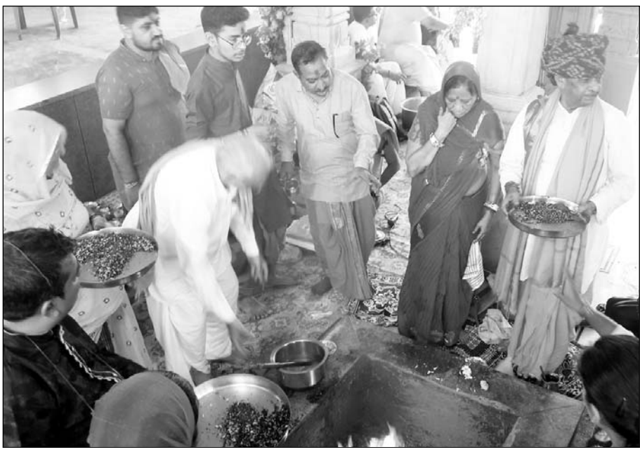
पाली में नागा बाबा की बगीची सहित मंदिरों में कई कार्यक्रम हुए।

जोधपुर, (कासं)। विभ्रतहर्ता गणपति महाराज का जन्मोत्सव यानि की गणेश चतुर्थी पर्व सूर्यनगरी में मंगलवार की धूमधाम व श्रद्धापूर्वक मनाया गया। इस अवसर पर मंदिरों के साथ घरों में भी भगवान गणेश की पूजा-अर्चना की गई। मंदिरों में स्थापित गजानन को विभिन्न तरह की रत्नजड़ित पोशाक और सोने-चांदी के मुकुट धारण कराए गए। गणेश मंदिरों में कई धार्मिक कार्यक्रम आयोजित हुए। यहां दिनभर श्रद्धालुओं की दर्शनों के लिए भीड़ लगी रही।