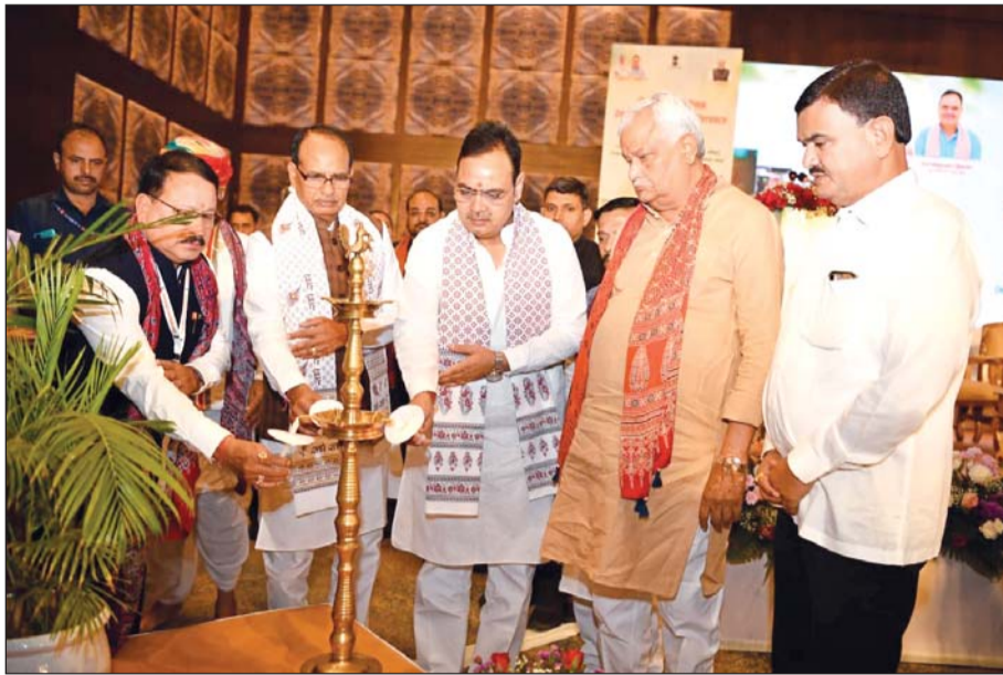
केन्द्रीय कृषि एवं किसान कल्याण मंत्री शिवराज सिंह चौहान व मुख्यमंत्री भजनलाल शर्मा ने मंगलवार को जयपुर में आयोजित पश्चिमी क्षेत्रीय सम्मेलन का उद्घाटन किया।

उद्घाटन सत्र को संबोधित कर रहे थे। उन्होंने कहा कि देश की भौगोलिक विविधताओं को ध्यान में रखते हुए प्रधानमंत्री के मार्गदर्शन में क्षेत्रीय कृषि सम्मेलनों के आयोजन का निर्णय लिया गया है। इसी क्रम में पहले क्षेत्रीय कृषि सम्मेलन का शुभारंभ राजस्थान से किया गया है। उन्होंने खेती से जुड़े इस महत्वपूर्ण सम्मेलन का राजस्थान में आयोजन होने पर धन्यवाद दिया।