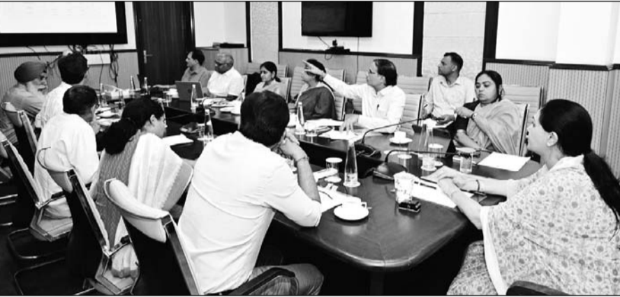
उपमुख्यमंत्री तथा महिला एवं बाल विकास मंत्री दिया कुमारी की अध्यक्षता में मंगलवार को सचिवालय में विभागीय योजनाओं एवं कार्यक्रमों की समीक्षा बैठक हुई।