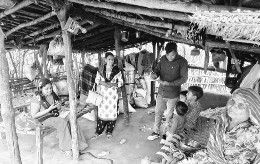
सलूम्वर जिले में बच्चों की अज्ञात बीमारी से मौतों के बाद चिकित्सा विभाग की टीम ने मौके पर जांच की।