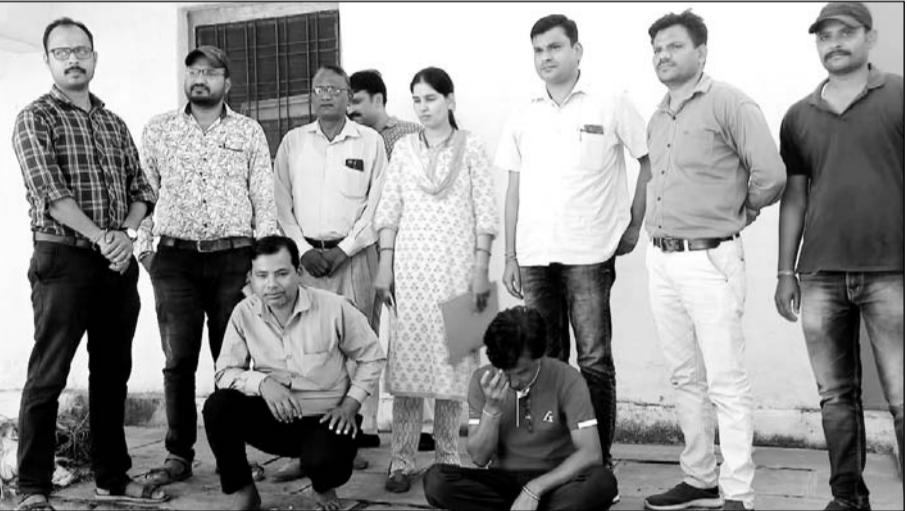
कोटा एसीबी की गिरफ्त में रिश्वत के आरोपी ग्राम विकास अधिकारी और सरपंच पति।

अलग-अलग समय में करीब बीस हजार पांच सौ रुपए पहले ही ग्राम विकास अधिकारी और सरपंच पति को पट्टा बनाने के लिए दे दिये थे लेकिन फिर भी ग्राम विकास अधिकारी द्वारा पट्टा नहीं बनाया गया तथा दस हजार रुपए सरपंच पति के लिए रिश्वत मांगी। रिश्वत के दस हजार रुपए और देने पर पट्टा बनाने के लिए तैयार हो गए। जिस पर पीड़ित ने कोटा एसीबी टीम को सूचना दी।