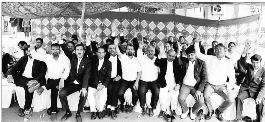
एडीजे भर्ती में अधिवक्ता कोटे की सीटों को भरने की मांग को लेकर अधिवक्ताओं ने हाईकोर्ट परिसर में बुधवार को धरना दिया।

सूत्रों के अनुसार मुख्य परीक्षा का परिणाम 1 अक्टूबर को घोषित किया जिसमें सिर्फ 4 अधिवक्ता को इंटरव्यू हेतु काल किया गया। पूर्व की एडीजे भर्ती परीक्षा में भी अधिवक्ता कोटा की सीटों को नहीं भरा गया था। अधिवक्ता कोटा की खाली सीटों को जुडिशियल ऑफिसर्स द्वारा एडहॉक प्रमोशन से भर दिया जाता है। इस परीक्षा की कॉपी भी उन जिला जज द्वारा जंची गयी जिन्होंने वकील कोटा की सीनियरिटी को सुप्रीम कोर्ट में चुनोती दी थी तथा जिनके भाई