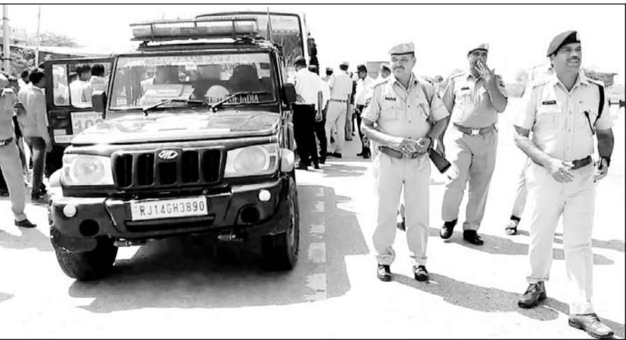
सड़क हादसे के बाद पुलिस ने मौका मुआयना किया। इस दौरान लोगों की भीड़ जमा हो गई।

गलत साइड में गई लोक परिवहन बस के टायर में मोटरसाइकिल फंसी हुई मिली