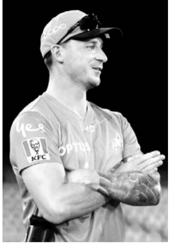
फुट से भी कुछ खूबसूरत कवर ड्राइव खेले हैं। ऑस्ट्रेलिया में पिचें बल्लेबाज के अनुकूल हैं। वह '360 डिग्री' खिलाड़ी हैं, और जो मुझे एबी डिविलियर्स की याद दिलाते हैं। वह एबी डिविलियर्स का भारतीय संस्करण बन सकते हैं। वह इस समय जिस फॉर्म में हैं, विश्व कप में निश्चित रूप से गेंदबाजों के लिए खतरनाक साबित हो सकते हैं।

स्टेन ने स्टार स्पोर्ट्स के कार्यक्रम क्रिकेट लाइव पर कहा, वह उस तरह के खिलाड़ी हैं जो गेंद की गति का उपयोग करना पसंद करते हैं। वह विकेट के पीछे शॉट खेलना पसंद करते हैं। पर्थ, मेलबर्न जैसी जगहों पर इन सभी मैदानों पर थोड़ी अतिरिक्त गति है। आप गति का उपयोग करके फाइन लेग पर और विकेट के पीछे खेल सकते हैं।