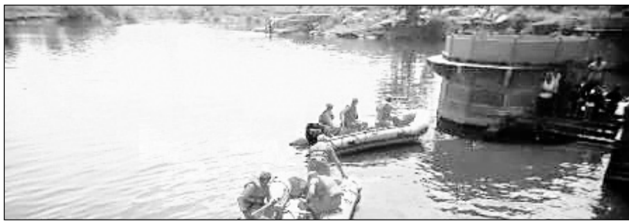
करोली के रणगंगा तलाब के पानी में सिविल डिफेंस व एनडीआरएफ के जवानों ने माँकड्डिल किया।