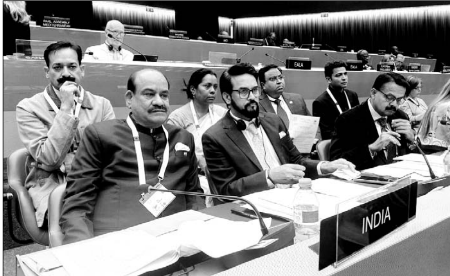
जिनेवा में अंतर-संसदीय संघ की बैठक में लोकसभा अध्यक्ष ओम बिरला के नेतृत्व में भारतीय संसदीय शिष्टमंडल ने भाग लिया।

स्पीकर ओम बिरला समापन दिवस पर आईपीयू की शासी परिषद की बैठक में शामिल हुए। बिरला ने कहा कि भारतीय शिष्टमंडल ने एसेम्बली के मुख्य विषय से जुड़े उन प्रमुख वैश्विक मुद्दों की ओर ध्यानाकर्षित किया, जिनमें भारत ने उल्लेखनीय प्रगति की है और सर्वोत्तम प्रथाओं को साझा किया। इसके साथ ही भारत की वैश्विक प्रतिबद्धताओं को दोहराते हुए परस्पर सहयोग की नीतिगत चर्चा-संवाद में शामिल होकर योगदान दिया। संसदीय सहयोग के माध्यम से समावेशी विकास और शांति की स्थापना के लिए वैश्विक प्रतिबद्धता को आगे बढ़ाने के लिए