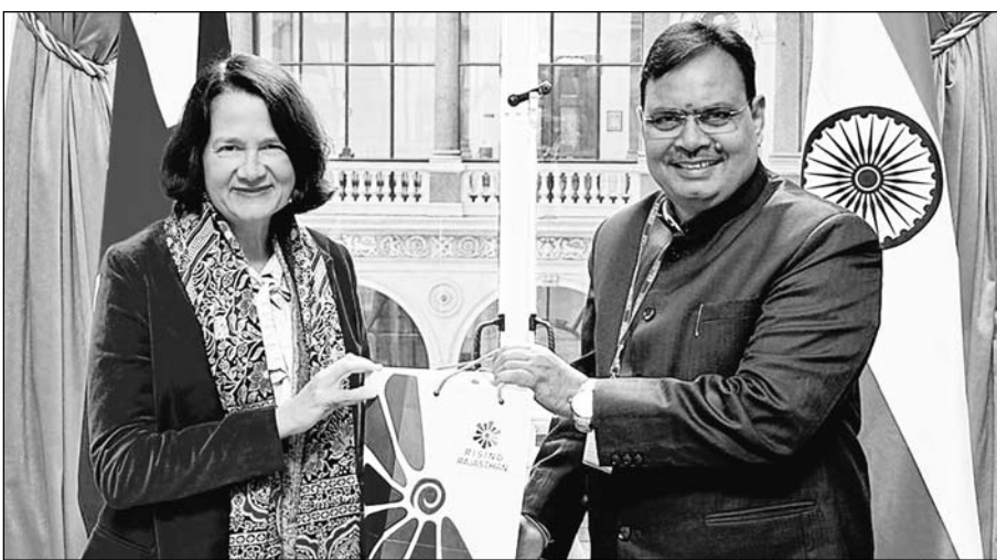
मुख्यमंत्री भजनलाल शर्मा, उप मुख्यमंत्री दीपा कुमारी और राजस्थान सरकार के उच्चस्तरीय प्रतिनिधिमंडल ने ब्रिटेन सरकार की मंत्री (इण्डो पैसिफिक क्षेत्र) कैथरीन वेस्ट के साथ मुलाकात की और लंदन के पैलेस ऑफ वेस्टमिंस्टर में ब्रिटेन की संसद का दौरा किया।

लंदन, 17 अक्टूबर। यूरोप की सबसे बड़ी अर्थव्यवस्था जर्मनी में निवेशकों के साथ सफल संपर्क के बाद, मुख्यमंत्री भजन लाल शर्मा, उपमुख्यमंत्री दिया कुमारी और राजस्थान सरकार के उच्च स्तरीय प्रतिनिधिमंडल के अन्य सदस्यों ने आज