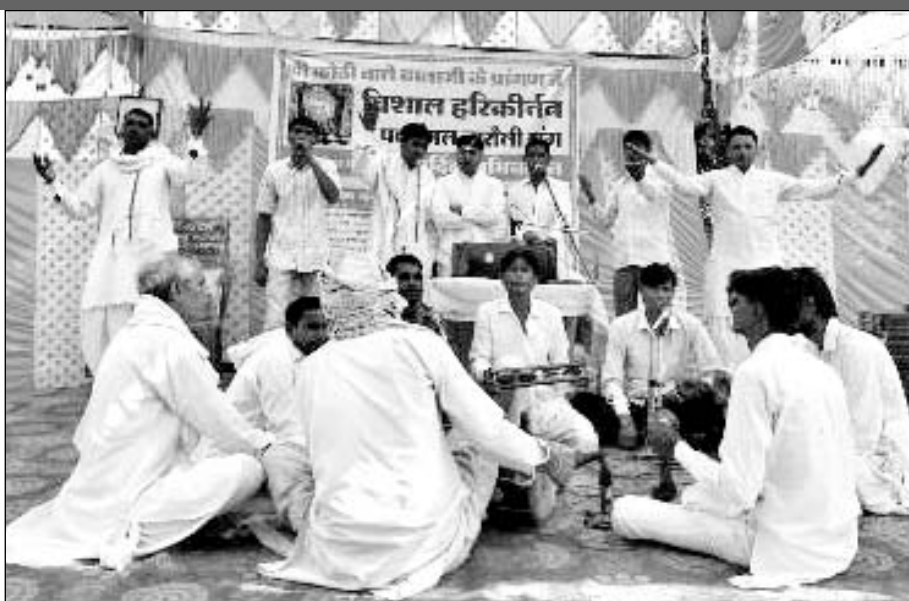
ग्राम पंचायत नारौली डोंग के श्री कोठी वाले बालाजी मंदिर परिसर में पद दंगल में कई पार्टियों ने भाग लेकर धार्मिक और पौराणिक कथाओं पर आधारित गीतों की प्रस्तुति दी।