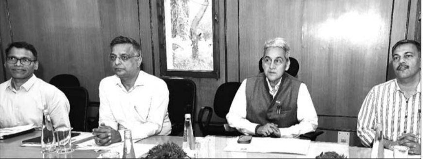
मुख्य सचिव सुधांशु पंत की अध्यक्षता में शुक्रवार को राज्य स्तरीय सैंकशांनिंग एवं मॉनिटरिंग कमेटी की बैठक हुई। लाख रुपये राज्य सरकार की ओर से प्रदान किया जाएगा। इस निर्णय से कुल 244.07 करोड़ रुपये की सैंकशिडी पात्र परिवारों को उपलब्ध होगी। इन आवासों की अंतिम स्वीकृति केंद्र सरकार की 17 सितंबर 2025 को आयोजित होने वाली सीएसएमसी की बैठक में प्रदान की जाएगी। प्रधानमंत्री आवास योजना (शहरी) 2.0 के तहत आर्थिक रूप से कमजोर वर्ग के परिवारों को पक्के मकान उपलब्ध कराने के लिए राज्य सरकार प्रतिबद्ध है। इस दिशा में किये जा रहे प्रयास ने केवल शहरी गरीबों के जीवन स्तर में सुधार लाएंगे बल्कि उन्हें गरिमायुक्त जीवन जीने का अवसर भी प्रदान करेंगे।

जयपुर। प्रधानमंत्री नरेन्द्र मोदी के सबसे पक्का मकान उपलब्ध कराने के विजन को साकार करने की दिशा में मुख्यमंत्री भजनलाल शर्मा के नेतृत्व में राज्य सरकार गंभीरता से कार्य कर रही है। प्रदेश सरकार ने 9 हजार 763 नये आवासों को केंद्र सरकार से स्वीकृति के लिए मंजूरी प्रदान की है। इससे प्रधानमंत्री आवास योजना (शहरी) 2.0 के अंतर्गत राजस्थान को आज बड़ी उपलब्धि हासिल हुई है। मुख्य सचिव सुधांशु पंत की अध्यक्षता में शुक्रवार को सम्पन्न हुई राज्य स्तरीय सैंकशांनिंग एवं मॉनिटरिंग कमेटी (एसएलएसएमसी) की बैठक में यह निर्णय लिया गया। इन आवासों के लिए प्रत्येक पात्र लाभार्थी को कुल 2.50 लाख रुपये का अनुदान मिलेगा, जिसमें 1.50 लाख रुपये केंद्र सरकार और एक