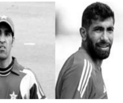
रखने में कामयाब रहे। इस पर गुल ने कहा कि पाकिस्तान क्रिकेट क व्यवस्था ऐसी है कि इससे स्थापित खिलाड़ियों में असुविधा की भावना पैदा होती है, जिसके कारण उन्हें पूरी तरह से फिट न होने पर भी मैच खेलने के लिए मजबूर होना पड़ता है। उमर गुल ने पीटीवी के एक टॉक शो गेम ऑन में कहा कि, दुर्भाग्य से हमारी व्यवस्था में हमारी संस्कृति में समस्या ये है कि जब हम खेलते थे, तो कोई भी सीनियर खिलाड़ी हिचकिचाता था। अगर वह 70-80 प्रतिशत भी फिट होता तो वह कबला भी खेलना चाहता हूँ ऐसा

नई दिल्ली, 12 सितंबर। पाकिस्तान के पूर्व तेज गेंदबाज उमर गुल ने भारतीय क्रिकेट टीम के थिंक टैंक की तारीफ की। इस दौरान उन्होंने जसप्रीत बुमराह जैसी प्रतिभा को संभालने के तरीके की बीसीसीआई की प्रशंसा की। साथ ही उन्होंने इस बारे में भी बात की कि, पाकिस्तान क्रिकेट संस्कृति ऐसी रोटेेशन नीति क्यों नहीं अपनाती, जैसा भारत करता है। रविवार को भारत और पाकिस्तान के बीच एशिया कप मुकाबले से पहले गुल से भारत की रोटेेशन नीति और बुमराह के करियर की क्षमता को अधिकतम करने के लिए कैसे संभाला गया, इस बारे में पूछा गया। गुल से खासतौर पर कार्यभार प्रबंधन के बारे में पूछा गया और वे भी कि, कैसे कभी-कभी जब खिलाड़ी खासकर गेंदबाज चोटिल हो जाते हैं तो उनकी पेस कुछ किलोमीटर कम रह जाती है लेकिन बुमराह फिर भी पहले जैसी गति बनाए