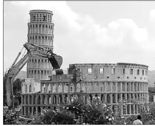
भारी भरकम क्रेन, पोकलेन मशीन और जेसीबी मशीनों से सेवन वंडर तोड़ने की कार्रवाई शुरू की।

अजमेर शहर को स्मार्ट सिटी बनाने व पर्यटन को बढ़ावा देने के उद्देश्य से करीब 12 करोड़ रुपए की लागत से बनाए गए थे सात अजूबे