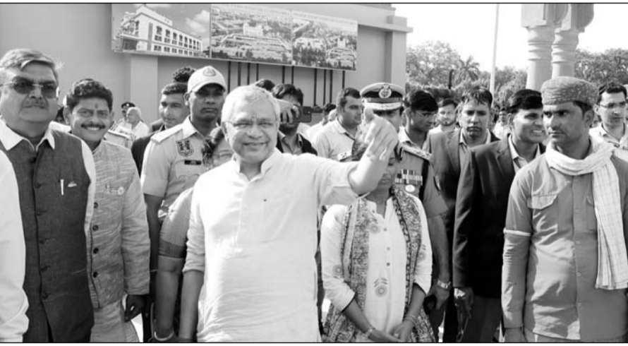
केन्द्रीय रेलमंत्री अश्वनी वैष्णव जयपुर पर पहुंचे।

ज्ञापन में बताया कि फुलेरा जंक्शन को "अमृत भारत योजना" में जोड़कर जंक्शन का जीर्णोद्धार/विस्तार/पुनर्विकास के लिए धन्यवाद देते हुए धीमी गति से चल रहे कार्यों पर चिंता भी जताई। साथ ही उन्होंने बताया कि फुलेरा जंक्शन पर यात्रियों व स्टॉफ को उपलब्ध पेयजल में टीडीएस की मात्रा अधिक होने पर भी मजबूरन वही जल पीना पड़ रहा है, यहां जोधपुर जंक्शन की तर्ज पर सेंट्रलाइज वाटर फिल्टर स्थापित करवाया जाए। अमृत भारत योजना के तहत रेलवे करोड़ों रुपए लगाकर फुलेरा जंक्शन के सौंदर्यकरण पर खर्च कर रहा है, परंतु मुख्य प्रवेश द्वार की चौड़ाई मात्र 10 फीट है, जिसके कारण प्लेटफॉर्म पर आवागमन बाधित रहता है। प्रवेश द्वार को अखिलतंत्र चौड़ा करवाया जाना