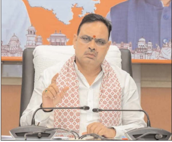
मुख्यमंत्री भजनलाल शर्मा ने गुरुवार को शहरी सेवा शिविर के संबंध में आयोजित बैठक की अध्यक्षता की। उन्होंने कहा 15 सितम्बर से 15 अक्टूबर चलने वाले इस अभियान में सभी अधिकारी गंभीरता एवं सेवाभाव के साथ कार्य करें।

उन्होंने कहा कि इन शिविरों में नागरिकों से जुड़े प्रकरणों का मौके पर समाधान किया जायेगा