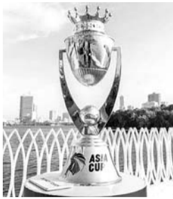
जा रहा है कि, पाकिस्तान के खिलाफ भी भारतीय टीम उसी प्लेइंग इलेवन के साथ उतर सकती है जो उसने यूएई के खिलाफ उतारी थी। क्योंकि इस टीम में बल्लेबाजी 8वें नंबर तक थी साथ ही गेंदबाजी विकल्प की भी कमी नहीं थी। अगर भारत इस टीम के साथ छेड़छाड़ करता

पाकिस्तान की टीम में कुछ अच्छे खिलाड़ी मौजूद हैं जो विश्वस्तरीय हैं और अगर वो चल निकले तो भारत के लिए मुश्किल खड़ी कर सकते हैं। इन खिलाड़ियों में फखर जमान, सईम अयूब, सलमान आगा, शाहीन