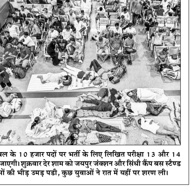
राजस्थान पुलिस में कोस्टेबल के 10 हजार पदों पर भर्ती के लिए लिखित परीक्षा 13 और 14 सितंबर को आयोजित की जाएगी। शुक्रवार देर शाम को जयपुर जंक्शन और सिंधी कैंप बस स्टैंड के आस-पास हजारों युवाओं की भीड़ उमड़ पड़ी, कुछ युवाओं ने रात में यहीं पर शरण ली।