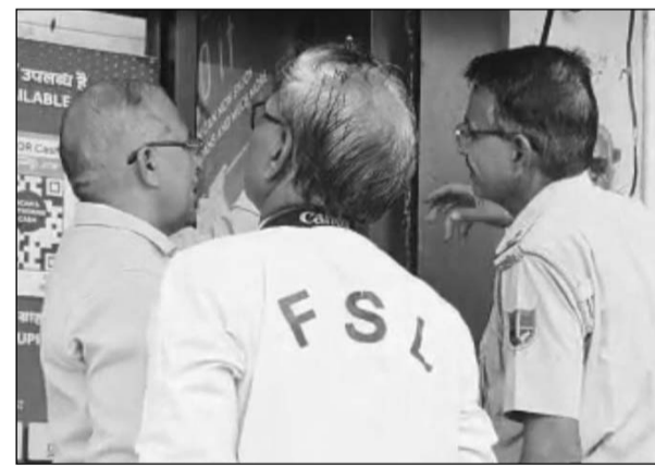
एफएसएल टीम और पुलिस ने मौके पर जाकर जांच की।