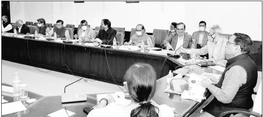
जलदाय मंत्री डॉ. महेश जोशी ने गुरुवार को जल भवन में जन स्वास्थ्य अभियांत्रिकी विभाग के अधिकारियों के साथ पहली बैठक को सम्बोधित किया।

जयपुर, (का.सं.)। जलदाय मंत्री डॉ. महेश जोशी ने प्रदेश में विभाग के तहत संचालित होने वाले नियमित अभियानों में गुणवत्ता को सुनिश्चित करने के लिए सभी कार्यों की समयबद्ध रूप से 'रैंडम चैकिंग' सुनिश्चित करने के निर्देश दिए हैं। उन्होंने कहा कि हैण्डपम्प मरम्मत