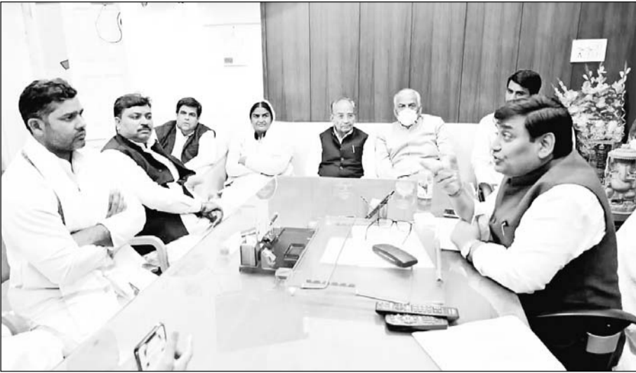
प्रदेश कांग्रेस अध्यक्ष गोविन्द सिंह डोटासरा ने गुरुवार को चार जिलों के प्रभारियों की बैठक ली।

जयपुर, (का.प्र.)। राजस्थान कांग्रेस अध्यक्ष गोविंद सिंह डोटासरा ने मंत्री पद से हटने के बाद अब चार जिलों में पंचायत राज चुनाव की तैयारियां शुरू कर दी हैं और इसके संबंध में गुरुवार को उन्होंने प्रदेश कांग्रेस मुख्यालय में संबंधित नेताओं और प्रभारी मंत्रियों की बैठक ली।