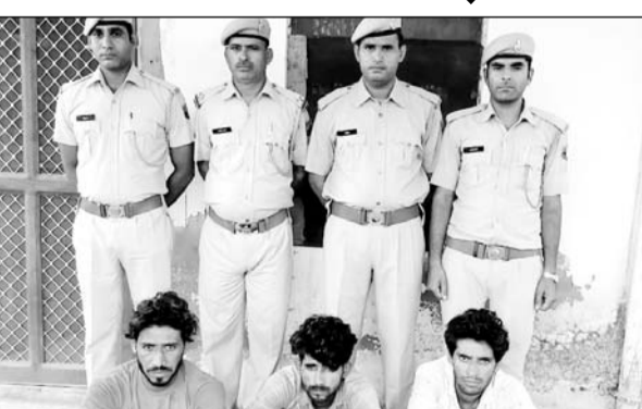
अलवर पुलिस ने कार्रवाई कर आरोपियों को गिरफ्तार किया।

सफलता पुलिस के हाथ लगी है। घटना की गम्भीरता को देखते हुये एसीपी के निर्देश के बाद घटना स्थल का एफएएसएल टीम द्वारा निरीक्षण किया गया तथा लगभग 50 संदिग्ध व्यक्तियों से पूछताछ की गई तथा तकनीकी साक्ष्यों का साईबर टीम अलवर द्वारा विश्लेषण किया जाकर उस संदिग्ध में भी अनेक संदिग्ध व्यक्तियों से पूछताछ की गई।