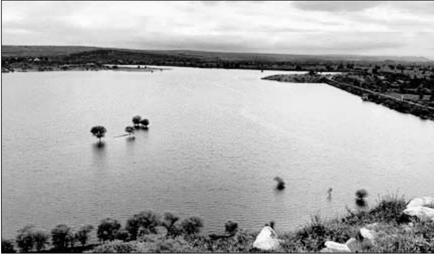
सपोटरा क्षेत्र में हो रही लगातार बारिश से कालीसिल बांध में लगातार पानी बढ़ रहा है।

सपोटरा, (नि.स.)। सपोटरा उपखंड के डांग क्षेत्र में लगातार हो रही झमाझम बारिश से अब कालीसिल बांध छलकने के कगार पर आ पहुंचा है। जिससे किसानों के चेहरे खिल उठे हैं। जल संसाधन विभाग के अनुसार कालीसिल बांध पर कुल 410 मिमी तथा सपोटरा में 306 मिमी बारिश हो चुकी है। मंगलवार को सपोटरा में 0.7 मिमी व कालीसिल बांध पर 18 मिमी बारिश दर्ज की गई। इस वर्ष सपोटरा के डांग क्षेत्र में अच्छी बारिश होने बांध में सोमवार को 23.10 फिट पानी की आवक हुई है। वहीं गुरुवार को कालीसिल बांध का गेज 24.4 फीट हो गया। एक-दो अच्छी बारिश होने से बांध पर चादर चलने की संभावना बढ़ गई है। इधर, नींदर बांध में 17 फिट के विपरीत 9 फिट पानी की आवक हुई है।