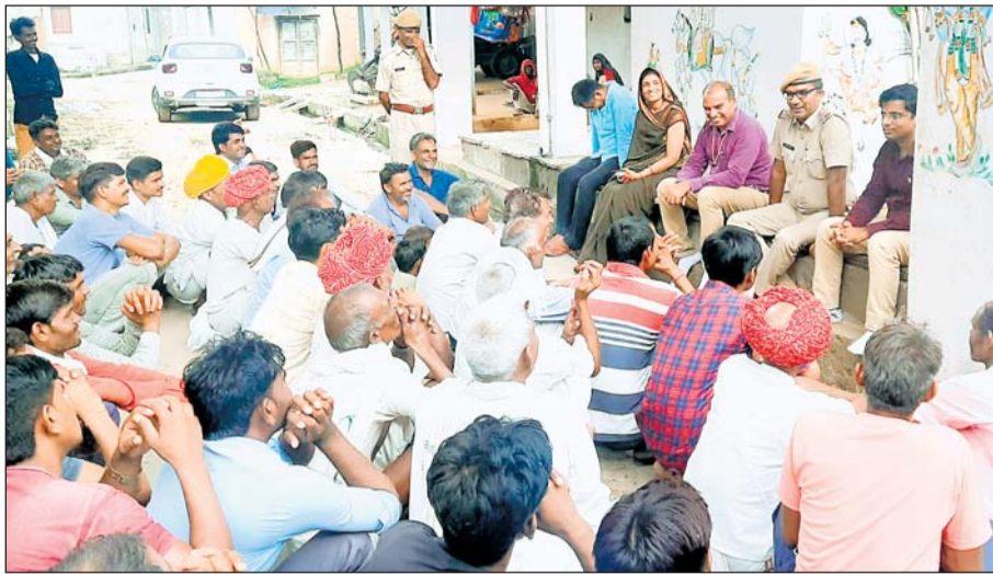
एसडीएम, एएसपी व डीवाईएसपी गांव ढाणी तक पहुंच आमजन व युवाओं से संवाद कर रहे हैं।