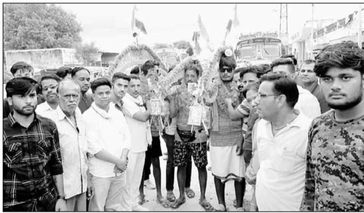
सुजानगढ़ में कावड़ियों का स्वागत करते हुए मुस्लिम समाज के लोग।