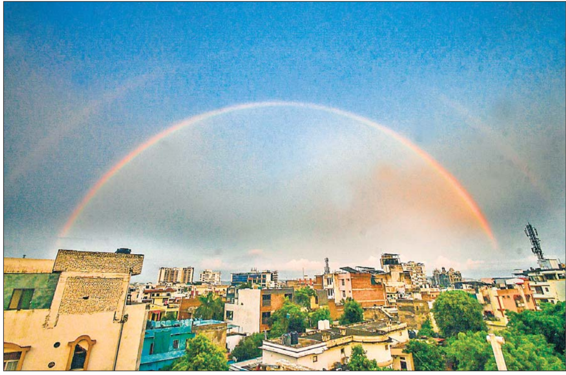
बारिश के मौसम में अक्सर इंद्र धनुष दिख जाया करता है, लेकिन जयपुर शहर में गुरुवार को लोगों को दो-दो इंद्र धनुष देखने का मौका मिला। हालांकि दूसरा वाला हल्का था।