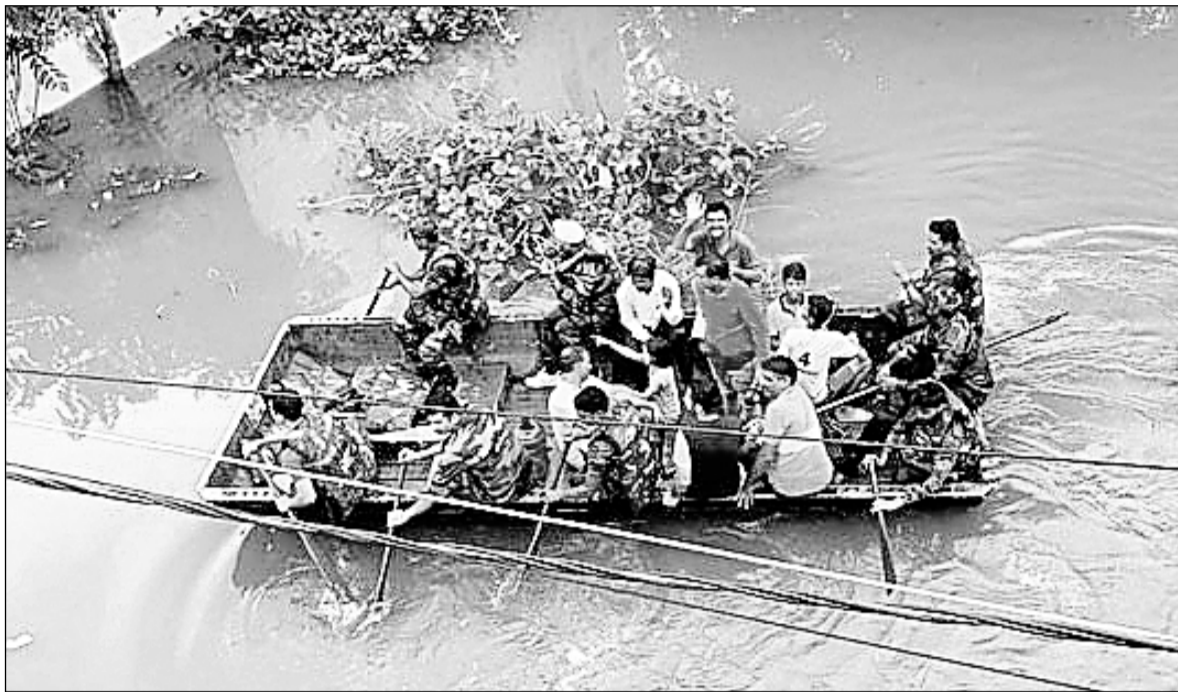
जोधपुर में सेना ने बारिश में फंसे लोगों को नाव से निकालकर सुरक्षित स्थान पर पहुंचाया।