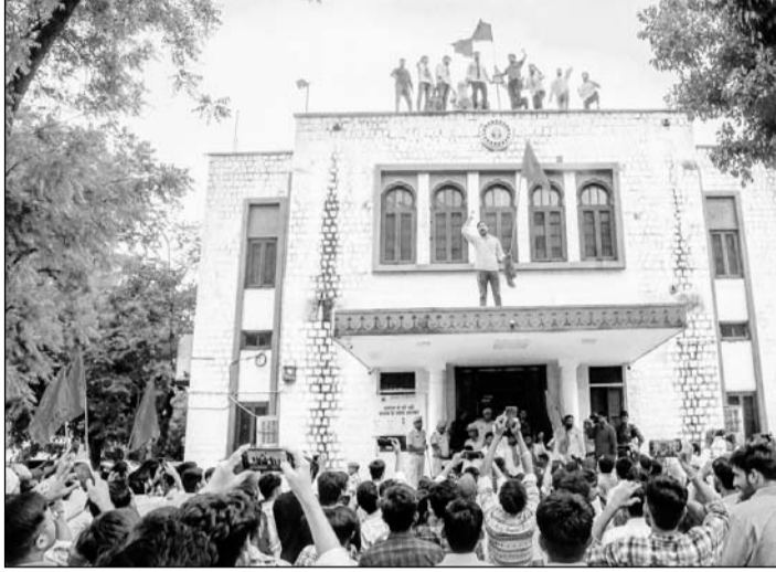
एबीवीपी कार्यकर्ताओं ने राजस्थान यूनिवर्सिटी में कुलपति सचिवालय की छत पर चढ़कर नारेबाजी की। बाद में पुलिस ने सभी प्रदर्शनकारियों को खदेड़ा।

■ 'राजस्थान यूनिवर्सिटी के कुलपति को जब तक नहीं हटाया जाता, तब तक एबीवीपी का विरोध ऐसे ही जारी रहेगा'