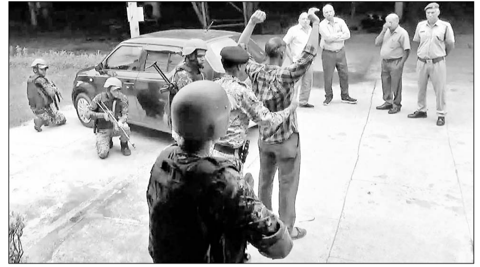
भरतपुर के टीटागढ़ वैगन लिमिटेड पर माँक ड्रिल करते जवान।

भरतपुर, (नि.स.)। गुरुवार सुबह टीटागढ़ वैगन लिमिटेड में उस वक्त हंगामा मच गया जब दो बदमाशों ने फैक्ट्री के दो प्रशासनिक अधिकारियों को एडम ब्लॉक में बंधक बना लिया। बाद में कार्यवाही के दौरान यह मामला माँक ड्रिल का निकला।