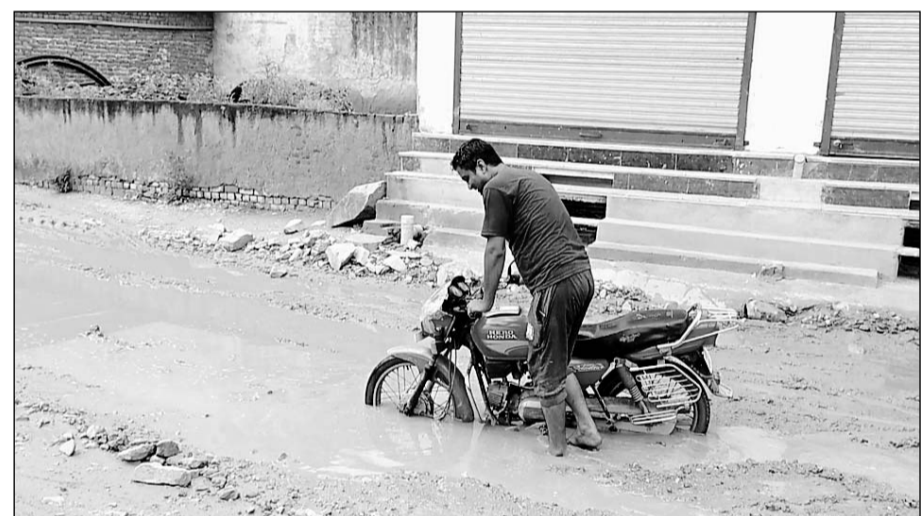
पावटा में कॉलोनीयों में भरे कीचड़ में फंसा बाइक सवार।

पावटा, (निर्सं)। बारिश के चलते जगह-जगह कॉलोनीयों में जलभराव की समस्या लोगों के लिए मुसीबत बन रही है। कुछ दिनों से रूक-रूककर बारिश होने व कॉलोनीयों में जल निकासी नहीं होने के कारण लोगों को आने-जाने में परेशानी का सामना करना पड़ रहा है।