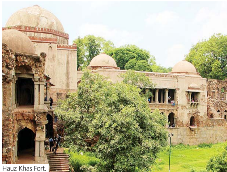
Hauz Khas Fort.

to be known as Ghiyas-ud-din-Tughlaq, the man who began the reign of the Tughlaq dynasty, which ruled for almost a hundred years. He ordered the construction of Tughlaqabad, the fourth city of Delhi. The remnants of Siri Fort's once marvellous bastions are now dwarfed and weathered down.