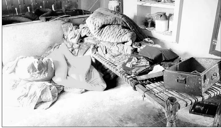
पीड़ित ने नारायणपुर पुलिस थाने में चोरी का मुकदमा दर्ज कराया।