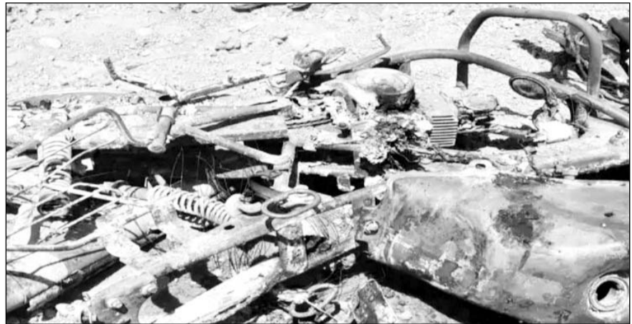
हाईटेंशन विद्युत लाइन के तार के करंट से मोटरसाइकिल कबाड़ में बदल गई।

रास्ते में टूटा बिजली का तार बाइक को छू गया, जिसके करंट से बाइक सहित तीनों झुलस गए