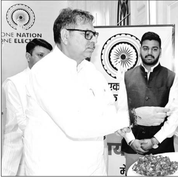
वन नेशन वन इलेक्शन को लेकर चलाए जा रहे जनजागरूकता अभियान के तहत रविवार को मानसरोवर में राज्यस्तरीय कार्यशाला को भाजपा के पूर्व प्रदेशाध्यक्ष सतीश पूनिया ने उद्घाटन किया।

जयपुर। वन नेशन वन इलेक्शन को लेकर चलाए जा रहे जनजागरूकता अभियान के तहत रविवार को राजस्थान के सोशल मीडिया एक्टिविस्ट, मीडिया इन्फ्लुएंसर, एनजीओ व नेशनल खिलाड़ियों की राज्यस्तरीय कार्यशाला