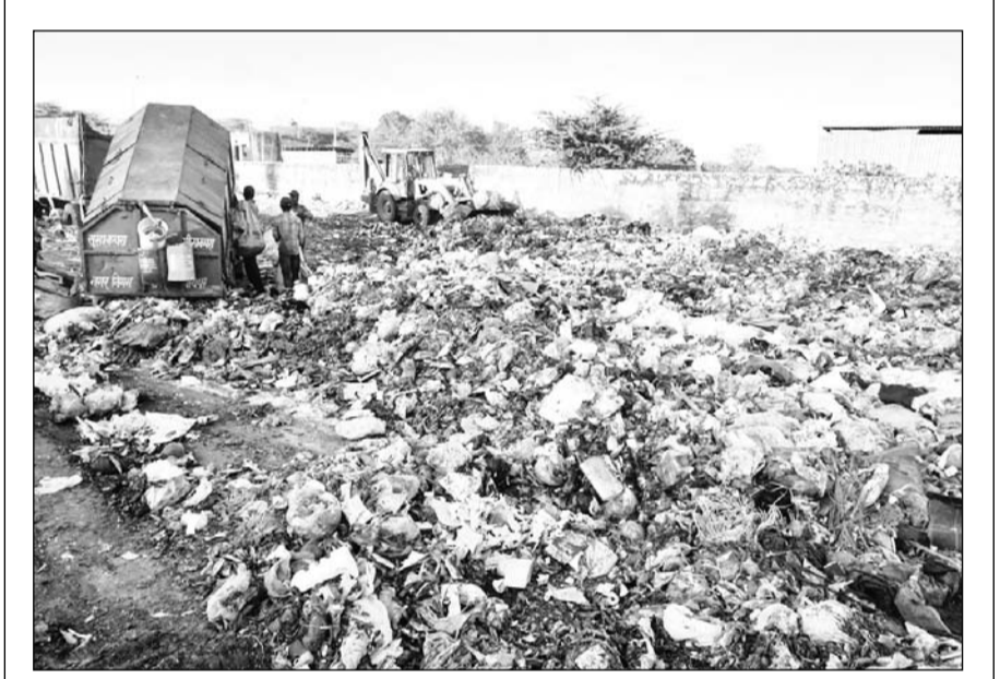
जयपुर नगर निगम ग्रेटर घर-घर कचरा कलेक्शन करके सेवापुर डंपिंग यार्ड में पहुंचा रहा था जिससे वहां कचरे का पहाड़ बन गया। अब पिछले 10 दिन से टोडी मोड़ पर एक निजी प्लॉट में कचरा डिपो बना दिया है जिससे वहां से गुजरने वाले लोगों का बदबू से हाल बुरा है।

धौलपुर जिले के पुलिस थाना बाड़ी से करीब डेढ़ साल पहले गायब हुए 11 साल के दिव्यांग बालक की तलाश पुलिस अभी नहीं कर पाई है। पुलिस की ओर से हाईकोर्ट में दायर तथ्यात्मक रिपोर्ट में पुलिस का कहना है कि 15 जून 2023 से लापता बालक की तलाश के लिए हमने 25 हजार के इनाम की भी घोषणा की है। बालक की तलाश में पुलिस टीम धौलपुर जिले, उत्तर प्रदेश और मध्य प्रदेश के सीमावर्ती जिलों में भेजी गई। बालक की तलाश के लिए उसके पोस्टर रेलवे स्टेशन और बस स्टैंड पर चस्पा किए गए। होटल, बाबों पर बालक की तलाश की गई। पिछले साल 31 दिसम्बर 2024 को बालक के पीवीसी कार्ड के लिए 50 रुपए का भुगतान हुआ। यह भुगतान किस बैंक, खाते अथवा ऑनलाइन ऐप के जरिए किया गया। उसकी जानकारी के लिए यूआईडीएआई रोजनल ऑफिस, दिल्ली को लिखा गया, लेकिन उन्होंने बिना हाईकोर्ट के आदेश के जानकारी देने से मना कर दिया।