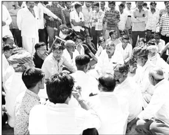
लोगों ने मृतकों के आश्रितों के लिये मुआवजे की मांग की।

और मौत हो गई। टूटे हुए तार में करंट दौड़ रहा था। आसपास के लोगों ने तुरंत बिजली विभाग को सूचना देकर सफलाई बंद कराई, लेकिन तब तक तीनों की मौत हो चुकी थी। ग्रामीणों ने बिजली विभाग की लापरवाही को लेकर आक्रोश