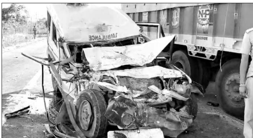
ट्रक व एंबुलेंस की टक्कर में एंबुलेंस गाड़ी क्षतिग्रस्त हो गई।