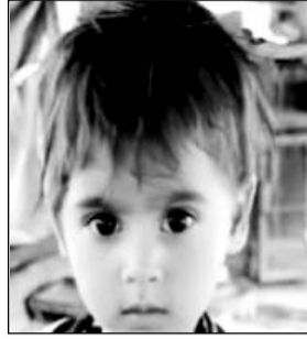
विवाहित महिला व मासूम बच्ची।

परिजनों द्वारा मां-बेटी को जगह-जगह तलाश किया गया लेकिन कोई सुराग नहीं मिला। रविवार को दोपहर ग्रामीणों