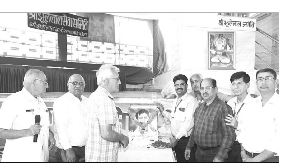
कोटा में चेट्टीचण्ड महोत्सव आयोजन की शुरुआत शहीद हेमू कलानी का जन्मोत्सव मनाकर की गई।