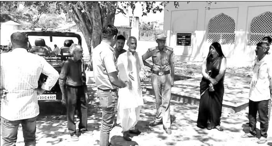
पुलिस ने मौका मुआयना कर मामले की जांच शुरू की।