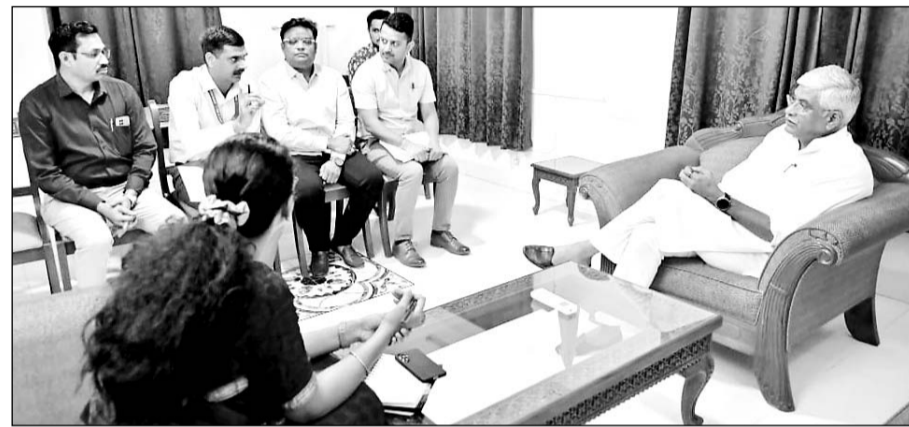
केंद्रीय मंत्री गजेंद्रसिंह शेखावत ( दांये से प्रथम ) ने सर्किट हाउस में आर्कियोलॉजिकल सर्वे ऑफ इंडिया के अधिकारियों के साथ सोनार किला की व्यवस्थाओं को लेकर चर्चा की।

जैसलमेर, (निसं)। केंद्रीय संस्कृति एवं पर्यटन मंत्री गजेंद्रसिंह शेखावत ने सर्किट हाउस में आर्कियोलॉजिकल सर्वे ऑफ इंडिया (एसआई) के अधिकारियों के साथ सोनार किले की व्यवस्थाओं को लेकर चर्चा की। उन्होंने कहा कि मुख्य विषय किले के द्वितीय द्वार को खोलने और पर्यटकों को