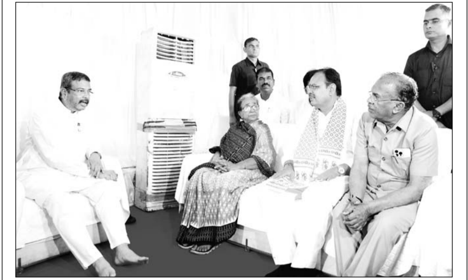
मुख्यमंत्री भजनलाल शर्मा ने रविवार को ओडिशा के तालचर में केंद्रीय शिक्षा मंत्री धर्मेन्द्र प्रधान के निज आवास पहुंचकर उनके पिता एवं पूर्व केंद्रीय मंत्री स्व. डॉ. देबेंद्र प्रधान को श्रद्धांजलि अर्पित की। शर्मा ने डॉ. देबेंद्र प्रधान के निधन पर गहरा शोक व्यक्त करते हुए शोक संतपन परिजनों को सात्वना दी। मुख्यमंत्री ने दिवंगत आत्मा की शांति के लिए और परिजनों को यह दुःख सहन करने की शक्ति प्रदान करने के लिए ईश्वर से प्रार्थना की। इस दौरान विधानसभा अध्यक्ष वासुदेव देवनानी तथा उप मुख्यमंत्री डॉ. प्रेमचंद बैरवा मौजूद रहे।