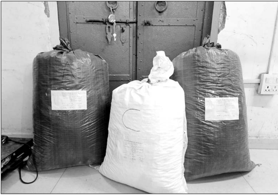
नारकोटिक्स विभाग द्वारा की गई कार्यवाही में अवैध मादक पदार्थ डोडा-चूरा जब्त किया।

कोटा, (निर्स)। राजस्थान में अवैध मादक पदार्थों की तस्करी पर रोक लगाने एवं तस्करो के विरुद्ध केन्द्रीय नारकोटिक्स ब्यूरो टीम द्वारा लगातार कार्यवाही की जा रही है।