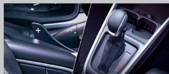
6-Speed Automatic Transmission with Paddle Shifters