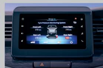
Tyre Pressure Monitoring System