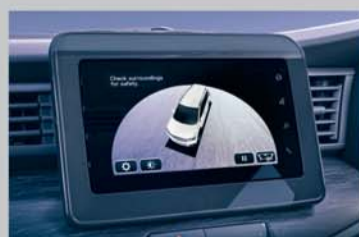
360 View Camera