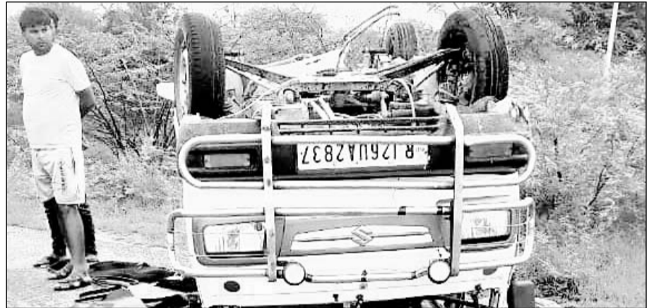
दूदू छाण स्टेट हाइवे पर अनियंत्रित हो बाइक से टक्कर के बाद पलटी वैन।