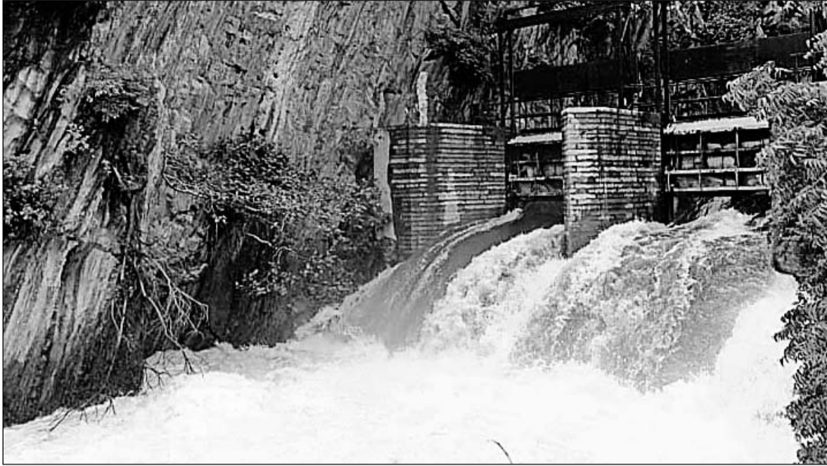
उदयपुर में लगातार बारिश व आयडू नदी से हो रही पानी की आवक के चलते उदयसागर के दोनों गेट छह फीट खोल दिए गए।