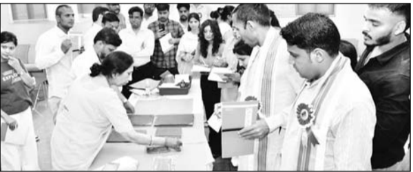
'पांडुलिपियों का निवारण एवं संरक्षण' विषय पर पांच दिवसीय कार्यशाला का आयोजन हुआ।

हरिद्वार में किया जा रहा है। इस मिशन का उद्देश्य भारत की विशाल एवं अप्रमूय पांडुलिपि विरासत का संरक्षण, दस्तावेजोक्ता तथा डिजिटलीकरण करना है, ताकि यह प्राचीन ज्ञान-संपदा भावी पीढ़ियों के लिए सुरक्षित रह सके। कार्यशाला का आयोजन पांडुलिपि संरक्षण के प्रति जागरूकता उत्पन्न करने तथा संरक्षण एवं भंडारण