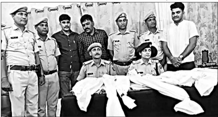
उनियारा पुलिस टीम ने भारी मात्रा में अवैध हथियार, बारूद और छर्रे बरामद किये।

टोंक, (निर्सं)। जिला पुलिस अधीक्षक के निर्देशन में अवैध हथियारों के खिलाफ चलाए जा रहे अभियान के तहत उनियारा वृत्ताधिकारी के नेतृत्व में उनियारा पुलिस टीम ने कार्यवाही करते हुए भारी मात्रा में अवैध हथियार, बारूद और छर्रे बरामद कर पांच आरोपियों को गिरफ्तार किया है।