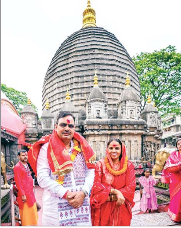
मुख्यमंत्री भजनलाल शर्मा ने मंगलवार को असम के गुवाहाटी में माँ कामाख्या मंदिर में सपत्नीक दर्शन किए।

इस अवसर पर केन्द्रीय गृह मंत्री अमित शाह, केन्द्रीय रक्षा मंत्री राजनाथ सिंह, केन्द्रीय मंत्रिमण्डल के सदस्यों सहित, विभिन्न राज्यों के मुख्यमंत्री, उपमुख्यमंत्री, मंत्रांगण एवं अन्य जनप्रतिनिधिगण उपस्थित रहे।