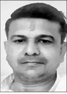
व्यापारी का फाइल फोटो