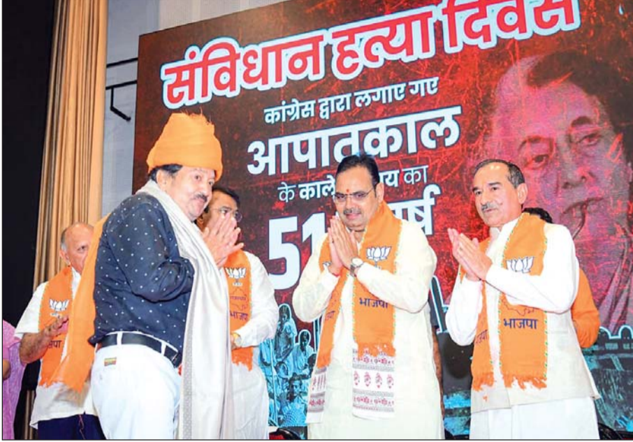
मुख्यमंत्री भजनलाल शर्मा ने गुरुवार को राज्य कृषि प्रबंधन संस्थान ऑडिटोरियम, दुर्गापुरा में "संविधान हत्या दिवस" के अवसर पर आयोजित लोकतंत्र सैनानी सम्मान समारोह में भाग लिया। इस अवसर पर आपातकाल के दौरान जेल गए लोगों का सम्मान किया गया।

मुख्यमंत्री गुरुवार को राज्य कृषि प्रबंधन संस्थान ऑडिटोरियम, दुर्गापुरा में "संविधान हत्या दिवस" के अवसर पर आयोजित लोकतंत्र सैनानी सम्मान समारोह को संबोधित कर रहे थे। उन्होंने कहा कि देश में लोकतंत्र और संविधान