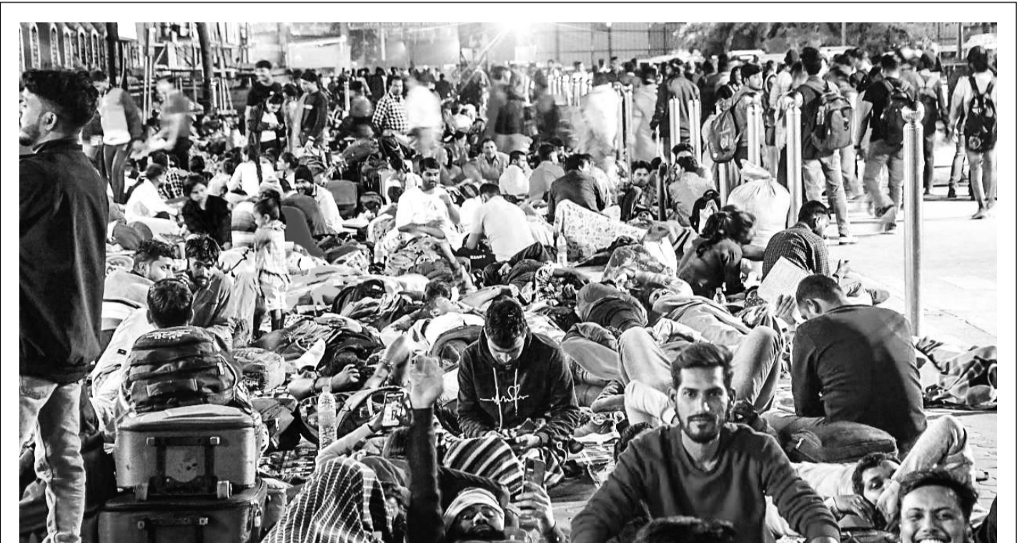
माध्यमिक शिक्षा बोर्ड, अजमेर द्वारा 27 फरवरी एवं 28 फरवरी को आयोजित होने वाली राजस्थान अध्यापक पात्रता परीक्षा (रिट-2024) के लिये जयपुर में परीक्षार्थियों का दूसरे शहरों से आना शुरू हो गया है। परीक्षार्थियों की अधिकता के कारण जयपुर रेलवे स्टेशन पर उन्हें खुले आसमान के नीचे ही सोना पड़ रहा है। गौरतलब है कि इस परीक्षा में जयपुर शहर के 233 परीक्षार्थी पर तीन पारी में 2 लाख 70 हजार 18 अर्थव्यर्थी पंजीकृत हैं। फोटो : दिनेश भारद्वाज

प्रतिबंधित पदार्थ की मात्रा को देखते हुए आरोप पत्र दाखिल किए बिना उसे अधिकतम साठ दिन के लिए ही न्यायिक अभिरक्षा में रखा जा सकता था। मामले में एफएसएल रिपोर्ट 130 दिन की देरी से आई है। याचिकाकर्ता के अधिवक्ता आरएस गुर्जर ने अदालत को बताया कि मानसरोवर थाना पुलिस ने करीब 24 ग्राम एमडीए रखने के आरोप में याचिकाकर्ता को गत वर्ष 18 मार्च को गिरफ्तार किया था। वहीं 11 सितंबर, 2024 को एफएसएल रिपोर्ट में आया कि बरामद पदार्थ एमडीए ना होकर मेथामफेटामाइन था। याचिका में कहा गया कि एमडीए की वाणिज्यिक मात्रा दस ग्राम और मेथामफेटामाइन की 50 ग्राम है। ऐसे में मामले की जांच साठ दिन में पूरी हो जानी चाहिए थी, लेकिन पुलिस ने 12 सितंबर, 2024 को आरोप पत्र पेश किया। ऐसे में उसे जमानत का लाभ दिया जाए। जिसका विरोध करते हुए सरकारी वकील ने कहा कि याचिकाकर्ता के खिलाफ श्याम नार थाना पुलिस में भी एनडीपीएस एक्ट के तहत मामला दर्ज है।