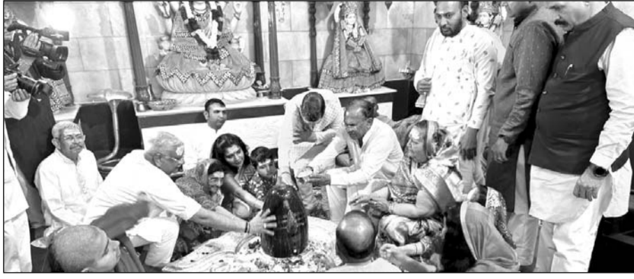
शिव मंदिरों में सभी की सुख-समृद्धि एवं प्रदेश में खुशहाली की कामना की।