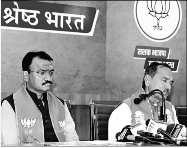
भाजपा प्रदेशाध्यक्ष मदन राठौड़ और उप मुख्यमंत्री डॉ. प्रेमचंद बैरवा बुधवार को प्रेस से रूबरू हुए।

जयपुर। भाजपा प्रदेशाध्यक्ष मदन राठौड़ ने भाजपा कार्यालय में प्रेस वार्ता की, इस दौरान साथ में उप मुख्यमंत्री डॉ. प्रेमचंद बैरवा और कैबिनेट मंत्री सुमित गोदारा भी मौजूद रहे। राठौड़ ने कहा कि जब अशोक गहलोत मुख्यमंत्री थे, तब उनकी अपने उपमुख्यमंत्री से लड़ाई चलती रहती थी। आपसी लड़ाई में विधायक होटलों में रहे, उन्हें तो सरकार चलाने का समय ही कब मिला। गहलोत सरकार में पुलिस मजबूर थी, आज मजबूत है। माफियाओं को पनपाने का काम गहलोत सरकार ने किया। भाजपा सरकार ने तो माफियाओं पर लगाम लगाकर अपराध को रोकने का काम किया है।