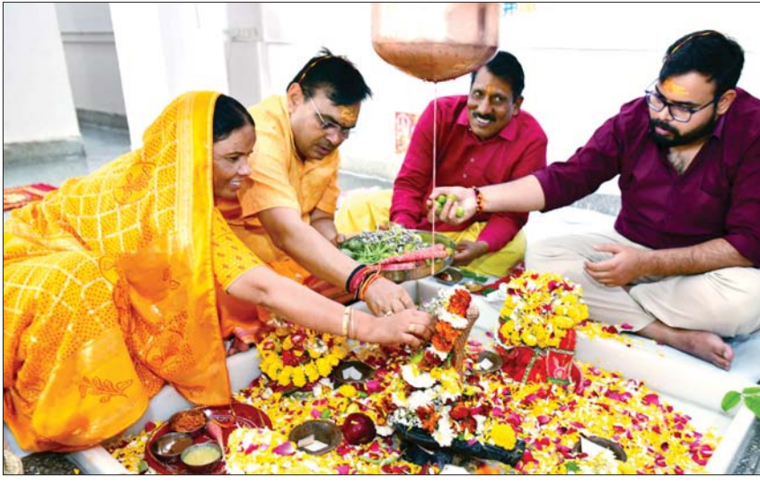
महाशिवरात्रि के पावन पर्व पर मुख्यमंत्री भजनलाल शर्मा ने परिवार के साथ मुख्यमंत्री निवास में बने राजराजेश्वरी माता के मंदिर में भगवान शिव की पूजा अर्चना की। वैदिक मंत्रोच्चार के बीच शर्मा ने भगवान शिव का जलाभिषेक किया और आरती उतारी। मुख्यमंत्री निवास पर तेनात अधिकारी व कर्मचारी भी इस दौरान मौजूद थे।