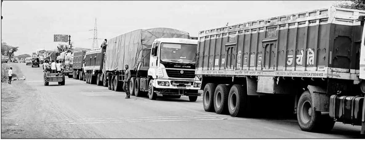
सुजानगढ़ को जिला बनाने की मांग को लेकर पांचवें दिन भी प्रदर्शन जारी रहा। इस दौरान सभी मार्ग बंद रहे।

आज से 6 घंटे के लिये खुलेंगे बाजार:- व्यापारिक संगठनों व जनहित संघर्ष मोर्चा की संयुक्त बैठक के बाद गुरुवार से 6 घंटे के लिये