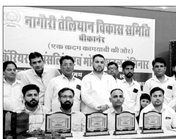
कॅरियर काउंसलिंग एवं मोटिवेशनल सेमिनार में बच्चों को बेहतर कॅरियर के लिए मार्गदर्शन दिया।

आपने बच्चों का मोटिवेशन करते हुए कहा कि मां-बाप मुश्किलों के बावजूद बच्चों को पढ़ाते हैं। जीवन में चैलेंज आते हैं और उन चैलेंज का मुकाबला करना पड़ता है। असफलताएं एक चुनौती होती हैं। आपने बच्चों को साहज्य क्राइम से सावधान रहने