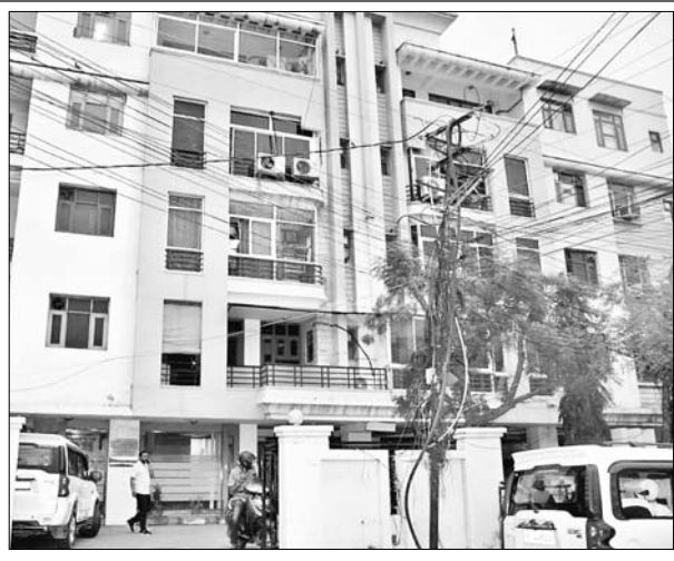
राजधानी के विधायकपुरी इलाके में गोपाल टावर अपार्टमेंट के चौथे फ्लोर पर हथियारबंद बदमाशों द्वारा बिजनेसमैन के बेटे को फ्लैट में बंधक बनाकर 75 लाख रुपए लूट की सूचना मिलने पर पुलिस ने मौके पर पहुंच कर जांच पड़ताल की।