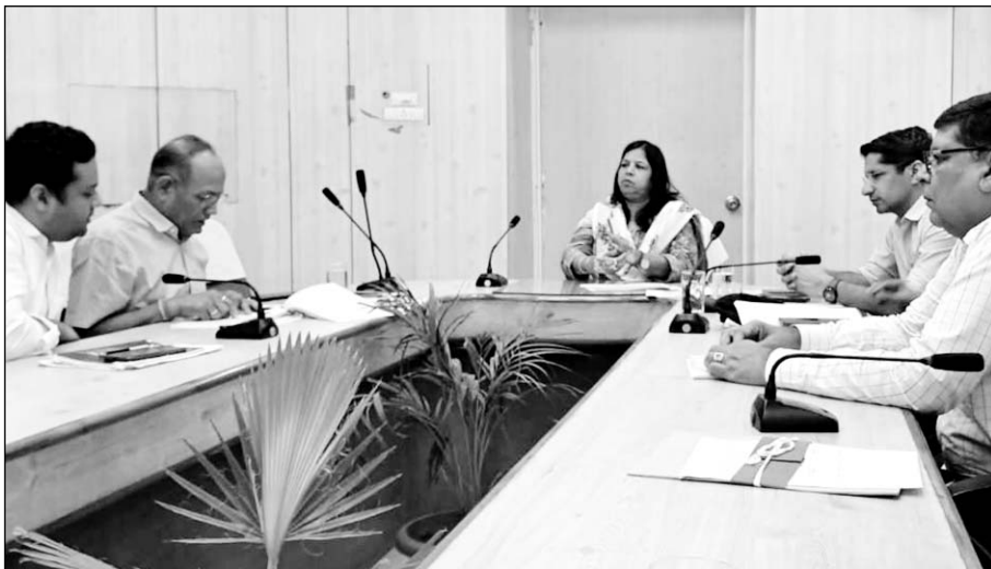
बीकानेर संभागीय आयुक्त वंदना सिंधवी ने पीडब्ल्यूडी व निगम के अधिकारियों की बैठक को संबोधित किया।

संभागीय आयुक्त ने नगर निगम, नगर विकास न्यास एवं पीडब्ल्यूडी के अधिकारियों को मानसून से दौरान बरसाती जलभराव की समस्या से निपटने की तैयारियों के निर्देश दिए। जलभराव वाले क्षेत्रों को चिन्हित करने व उन क्षेत्रों की सड़कों में गड्डे होने पर उन्हें भरवाने के साथ मैनहॉल खुले होने की स्थिति में उनके ढक्कन बंद करवाने