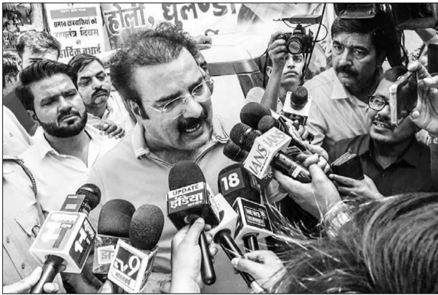
कांग्रेस सरकार में मंत्री रहे प्रताप सिंह खाचरियावास ने प्रेस को संबोधित किया।

सेबी के आकलन के अनुसार पीएसीएल की 1.86 लाख करोड़ रुपए की संपत्ति है, जो निवेशकों को जमा राशि की तुलना में 4 गुना है। पीएसीएल कंपनी की योजनाओं को अवैध मानते हुए सेबी ने 22 अगस्त 2014 को कंपनी के कारोबार बंद कर दिए थे। इसके चलते निवेशकों की पूंजी कंपनी के पास जमा रह गई। इसके बाद कंपनी व सेबी के बीच सुप्रीम कोर्ट में केस चला और सेबी जीत गई।