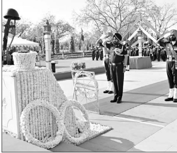
स्थापना दिवस पर प्रेरणा समारोह पर श्रद्धांजलि सभा आयोजित हुई।

सर्वदा विजयी भव के आदर्श के साथ इस कमान ने न केवल देश की सीमाओं की सुरक्षा सुनिश्चित की है, बल्कि ऑपरेशनल प्रिपेयर्डनेस और प्रोफेशनल एक्सिलेंस के उच्चतम मानकों को भी प्राप्त किया है। यह उल्लेखनीय उपलब्धि सुदृढ़ प्रशिक्षण, नवीन तकनीकों को शामिल करने तथा नवीन तकनीकों एवं सामरिक प्रक्रियाओं के विकास से संभव हुई है। इन्हीं प्रयासों से, यह कमान भविष्य के युद्धक्षेत्र की चुनौतियों से प्रभावी रूप से निपटने के लिए एक प्रभावर-रेडी, टेकनोलॉजी-ड्रिवन, लीयरल और एजाइल फोर्स के रूप में उभरी है। स्थापना दिवस के अवसर पर प्रेरणा