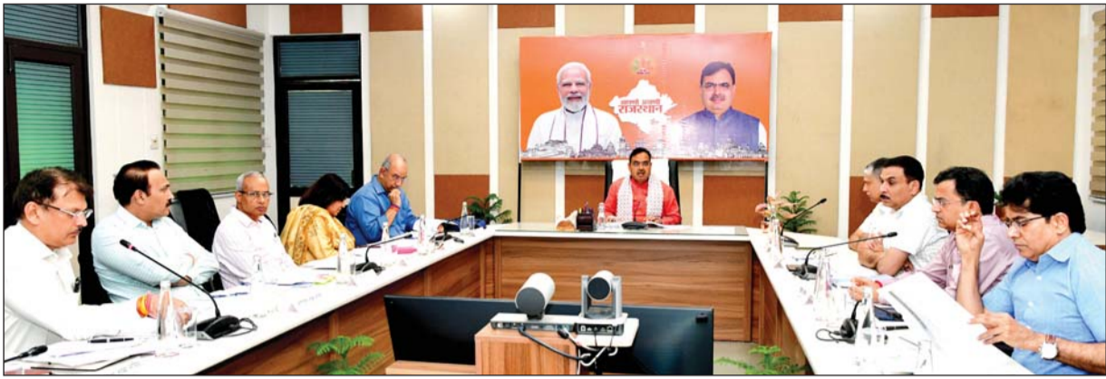
मुख्यमंत्री भजनलाल शर्मा ने मंगलवार को विभिन्न विभागों की वित्तीय वर्ष 2024-25 की बजट घोषणाओं की प्रगति की समीक्षा की। उन्होंने विकास कार्यों एवं योजनाओं की क्रियान्विति में संबंधित अधिकारी द्वारा लापरवाही बरतने पर सख्त कार्रवाई के निर्देश दिये।

बजट घोषणाओं की समीक्षा के दौरान मुख्यमंत्री भजनलाल ने पेयजल व सिंचाई को सर्वोच्च प्राथमिकता बताया