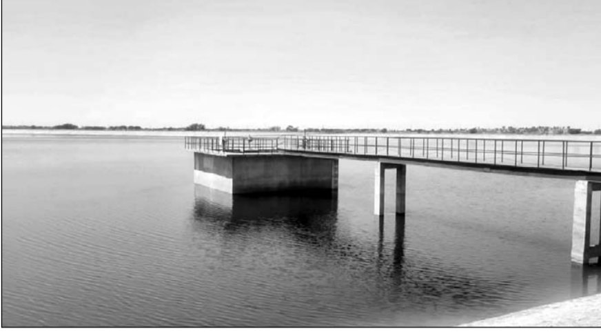
झुंझुनू के मलसीसर में स्थित डेम को फुल कर लिया गया है।