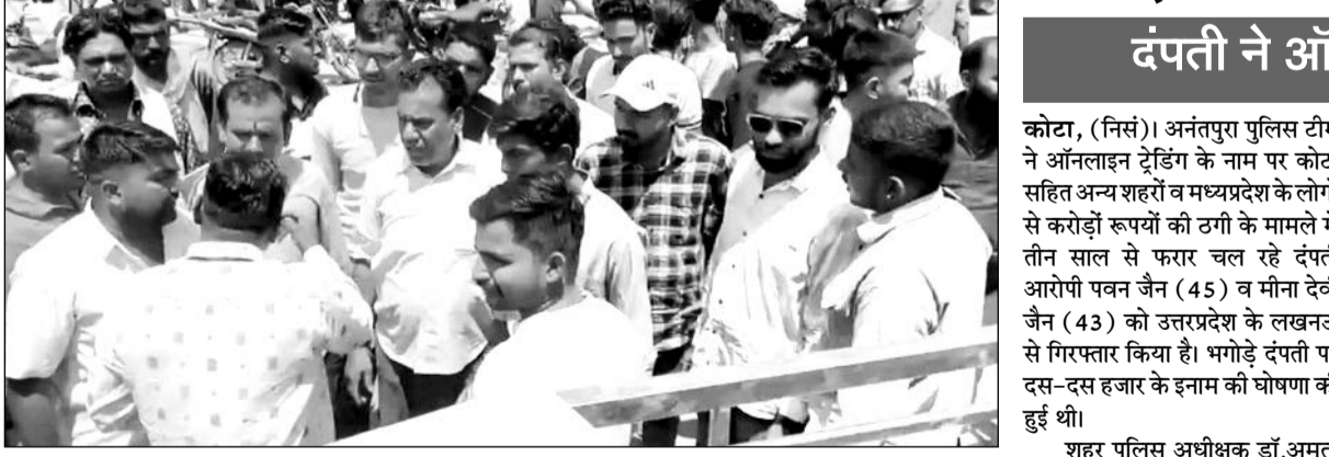
मामले को लेकर मौके पर पहुंचे हिन्दू संगठनों ने आक्रोश जताया।

पाली, (नि.सं.)। पाली में एक बाड़े में मंगलवार को एक मवेशी (बछड़े) का शव पेड़ से लटका हुआ मिला, जिसका पेट सिला हुआ था और आंखें निकाली हुई थीं और आधा मुंह भी कटा हुआ था। इसकी जानकारी मिलने पर हिन्दू संगठन से जुड़े लोग मौके पर पहुंचे और विरोध जताया। मौके पर पहुंचे पुलिस अधिकारियों ने मवेशी (बछड़े) के शव को सुरक्षित रखवाया और उनकी शिकायत दर्ज कर जांच शुरू की ताकि पता लगाया जा सके कि इस तरह की यह हरकत किसने और क्यों की। घटना के बाद पुलिस ने संदेह के दायरे में आए दो लोगों को हिरासत में लिया है जिससे पूछताछ जारी है।