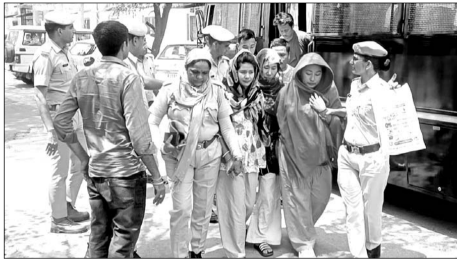
पुलिस ने गिरफ्तार सभी आरोपियों को झुंझुनू जिला मुख्यालय पर स्थित कोर्ट में पेश किया।

मंडावा, (नि.सं.)। कस्बे में पुलिस द्वारा सोमवार को माइक्रोसॉफ्ट के फर्जी कस्टमर केयर सेंटर का भंडाफोड़ कर 13 युवक-युवतियों को गिरफ्तार किया गया था। इस मामले में गिरफ्तार सभी आरोपियों को सोमवार को झुंझुनू जिला मुख्यालय पर स्थित कोर्ट में पेश किया गया, जिसमें से गिरफ्तार सभी तीन