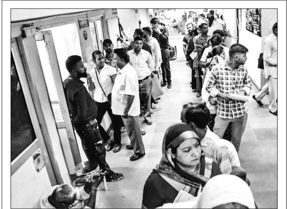
मौसम परिवर्तन के कारण सवाईमानसिंह अस्पताल के आउटडोर धनवंतरी में मौसमी बीमारियों के मरीजों की भीड़ लगी रही।