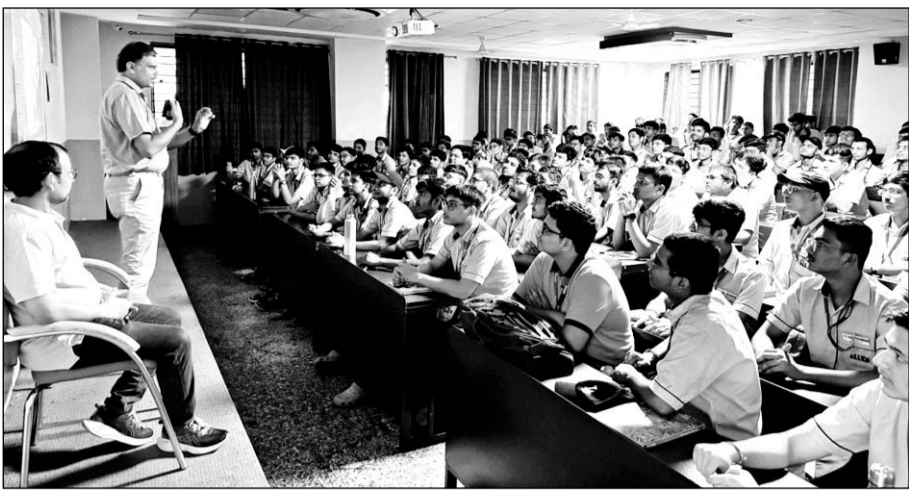
कोटा में कोचिंग स्टूडेंट्स को अंगदान के महत्व के विषय पर जानकारी दी गई है।

कोटा, (निसं)। मेडिकल कॉलेज कोटा की ओर से अंगदान जागरूकता को लेकर अलग-अलग स्तर पर प्रयास किए जा रहे हैं। इन्हीं प्रयासों के तहत कोचिंग स्टूडेंट्स को भी जागरूक किया जा रहा है। इसी क्रम में मेडिकल कॉलेज कोटा की ओर से एलन कैरियर इंस्टीट्यूट में अंगदान जागरूकता व्याख्यान आयोजित किया गया। यहां मेडिकल प्रवेश परीक्षा नीट की तैयारी कर रहे स्टूडेंट्स को अंगदान के बारे