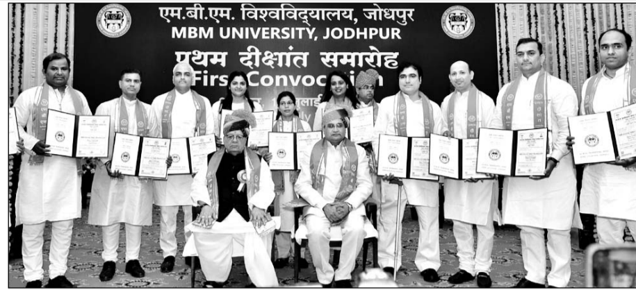
राज्यपाल कलराज मिश्र ने समारोह में विद्यार्थियों को गोल्ड मेडल प्रदान किए।

जोधपुर, (कांस)। राज्यपाल और कुलाधिपति कलराज मिश्र ने कहा कि प्रौद्योगिकी शिक्षा के तहत विश्वविद्यालय युवाओं को नवाचारों से जोड़ते हुए शोध की मौलिक भारतीय दृष्टि से संपन्न करें। उन्होंने कहा कि तकनीकी शिक्षा का उद्देश्य छात्रों में निहित अद्वितीय क्षमताओं को पहचान कर उन्हें भविष्य के अवसरों के लिए तैयार करना है। उन्होंने विद्यार्थियों से आह्वान किया कि वे अर्जित ज्ञान का उपयोग राष्ट्र और समाज के विकास के साथ ही मानवता के कल्याण में करें। राज्यपाल मिश्र जोधपुर स्थित एम.बी.एम. विश्वविद्यालय के प्रथम दीक्षांत समारोह को संबोधित कर रहे थे। समारोह में राज्यपाल कलराज मिश्र ने 19 विद्यार्थियों को गोल्ड मेडल प्रदान किए, जिसमें 13 गोल्ड मेडल यूजी के विद्यार्थियों को, 4 गोल्ड मेडल पीजी के विद्यार्थियों को एवं 2 गोल्ड मेडल एमएससी के विद्यार्थियों को प्रदान किए गए। साथ ही वर्ष 2022 एवं 2023 में उत्तीर्ण 680 विद्यार्थियों को स्नातक में उपाधियां प्रदान की। इसी प्रकार कुल 167 विद्यार्थियों को स्नातकोत्तर में, 28 विद्यार्थियों को बी.आर्किटेक्चर में, 52 विद्यार्थियों को एमएससी में एवं 11 विद्यार्थियों को पी.एच.डी की उपाधि प्रदान की गई। समारोह को संबोधित करते हुये राज्यपाल ने कहा कि शिक्षण संस्थान में गुणवत्तापूर्ण शिक्षा का प्रबंधन करना हमारी प्राथमिकता है। इस