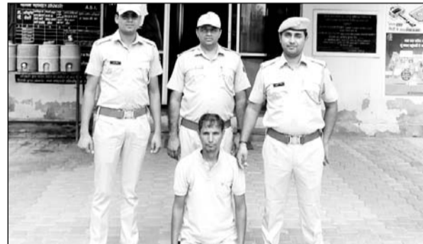
मनोहरपुर पुलिस ने फरार नकबजन को गिरफ्तार किया।