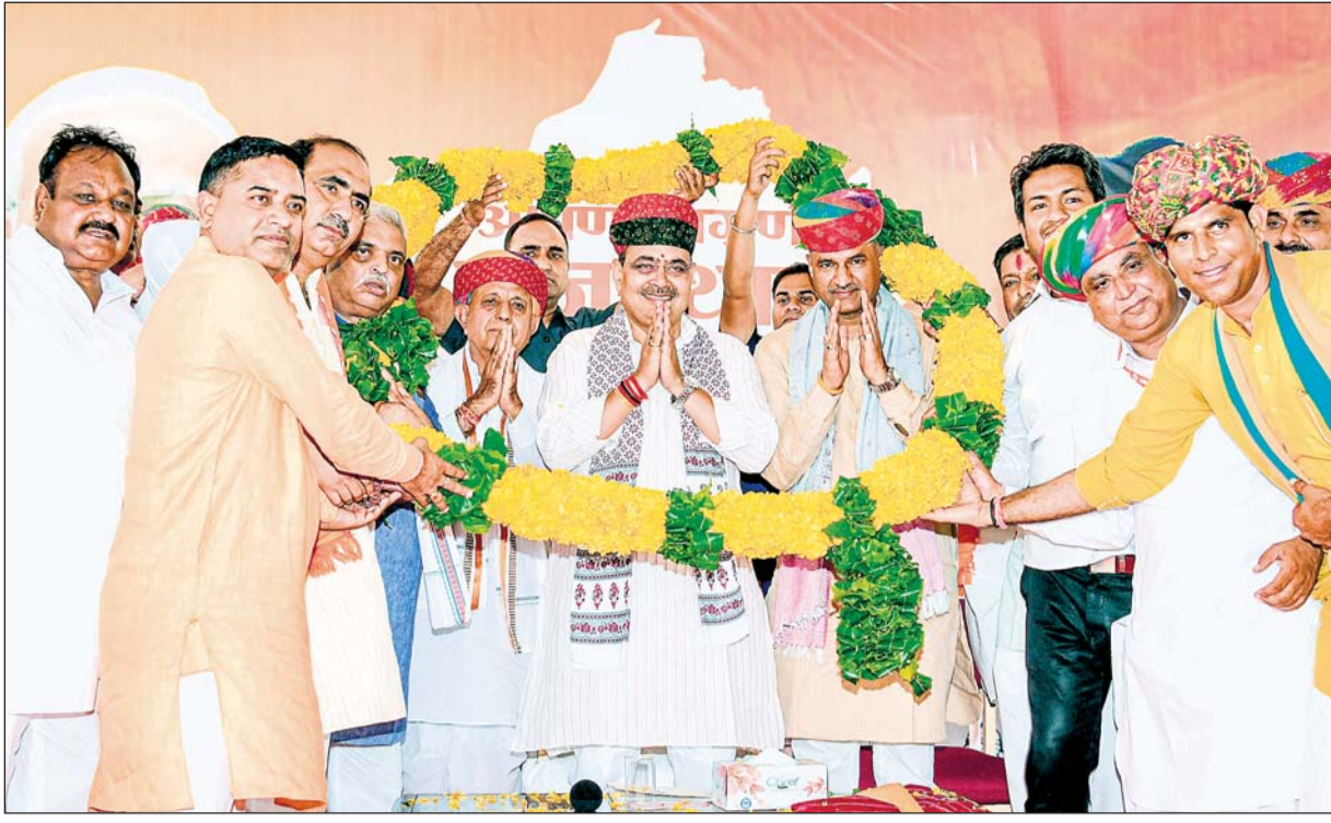
बजट पर मुख्यमंत्री भजनलाल शर्मा का आभार जताने के लिए प्रदेश भर से किसान मु.मंत्री निवास पर इकट्ठा हुये। किसानों ने बजट के प्रति प्रसन्नता जाहिर की और मुख्यमंत्री का माला पहनाकर अभिनंदन किया।