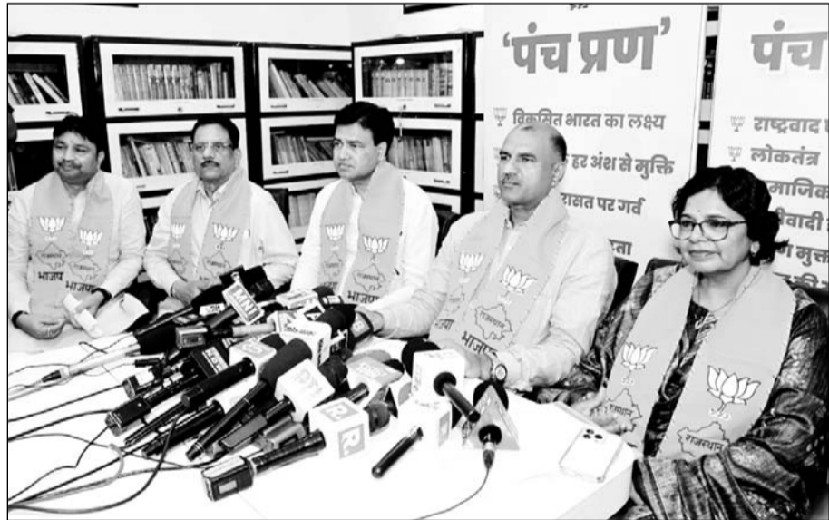
भाजपा प्रदेशाध्यक्ष सी.पी.जोशी ने शुक्रवार को भाजपा प्रदेश मुख्यालय पर प्रेसवार्ता को संबोधित किया।

जयपुर। भाजपा प्रदेशाध्यक्ष सीपी जोशी ने भाजपा प्रदेश मुख्यालय पर प्रेसवार्ता को संबोधित करते हुए कहा कि शनिवार को सुबह 9 बजे से जयपुर के सीतापुर स्थिति जेईसीसी सभागार में ऐतिहासिक वृहद कार्यसमिति का आयोजन किया जाएगा। यह कार्यसमिति ऐसे अवसर पर हो रही है जब देश में तीसरी बार प्रधानमंत्री के रूप में नरेन्द्र मोदी ने शपथ ली है, और प्रदेश में भाजपा की सशक्त भजनलाल सरकार है। कार्यसमिति में पंचायत राज के जनप्रतिनिधि, निकाय जनप्रतिनिधि, सांसद, विधायक, मंत्री मुख्यमंत्री और प्रदेश पदाधिकारियों सहित आठ हजार से ज्यादा भाजपा कार्यकर्ता भाग लेंगे। वहीं केंद्र की ओर से एमपी के पूर्व मुख्यमंत्री एच कृष्ण मंत्री शिवराज सिंह चौहान और भाजपा के राष्ट्रीय महासचिव दुष्यंत गौतम उपस्थित रहेंगे।