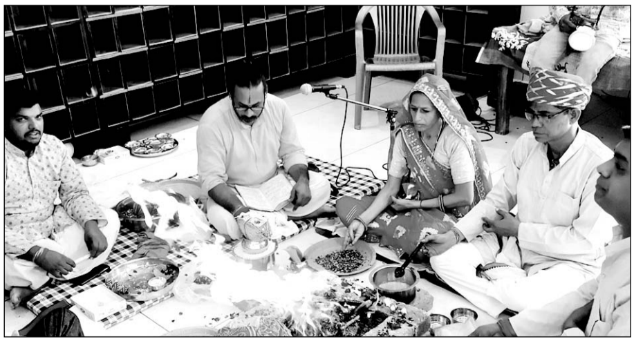
ग्रेन एण्ड सीड्स मर्चेन्ट एसोसिएशन रामगंजमंडी के नवनिर्मित भवन का उद्घाटन हुआ।