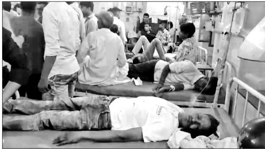
घायलों को इलाज के लिए जिला अस्पताल धौलपुर में भर्ती कराया।

धौलपुर, (निर्स)। धौलपुर शहर के सदर थाना क्षेत्र में गुरुवार-शुक्रवार की रात को पंचगांव गांव के पास भरतपुर हाईवे पर बारातियों से भरा एक डीसीएम वाहन पलट गया। हादसे में दो बारातियों की मौत हो गई तथा 14 बाराती घायल हो गए। वहीं कुछ बाराती चोटिल भी हो गए। घायलों को इलाज के लिए जिला अस्पताल धौलपुर में भर्ती कराया गया, जहां से दो घायलों को गंभीर हालत में जयपुर रेफर कर दिया गया। जैसे ही घटना की जानकारी वर व वधु पक्ष के घर पहुंची तो मातम छा गया और सनाटा पसर गया।