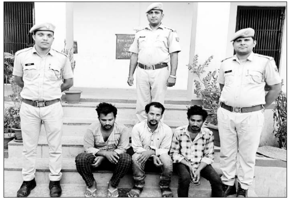
केलवाड़ा थाना पुलिस ने पानी की मोटर व केबल चुराने वालों को गिरफ्तार किया।