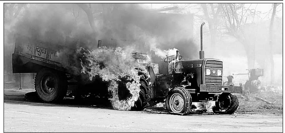
मुहाना मोड़ पर थड़ियों के पास खड़ा ट्रैक्टर धू-धू कर जलने लगा।