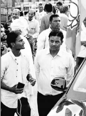
भाजपा के राष्ट्रीय प्रवक्ता और जयपुर ग्रामीण सांसद कर्नल राज्यवर्धन सिंह राठौड़ की अगुवाई में रविवार को झोटवाड़ा विधानसभा क्षेत्र में 'अमृत जन यात्रा' बाईक रैली निकाली गई।