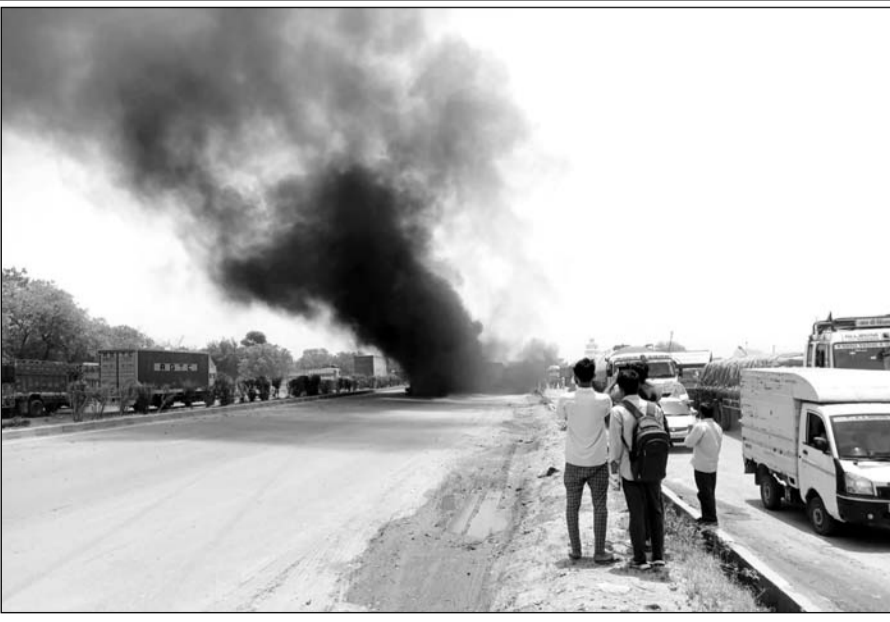
हादसे के बाद उठता धुआं।

इस दौरान ग्रामीणों ने बताया कि करीब आठ घंटे तक आग की लपटों में ट्रैलर जलता रहा। देखते ही देखते आग ने रफ्तार पकड़ी और धू धू कर