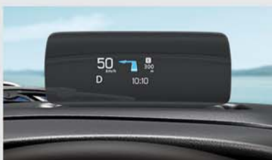
Head Up Display