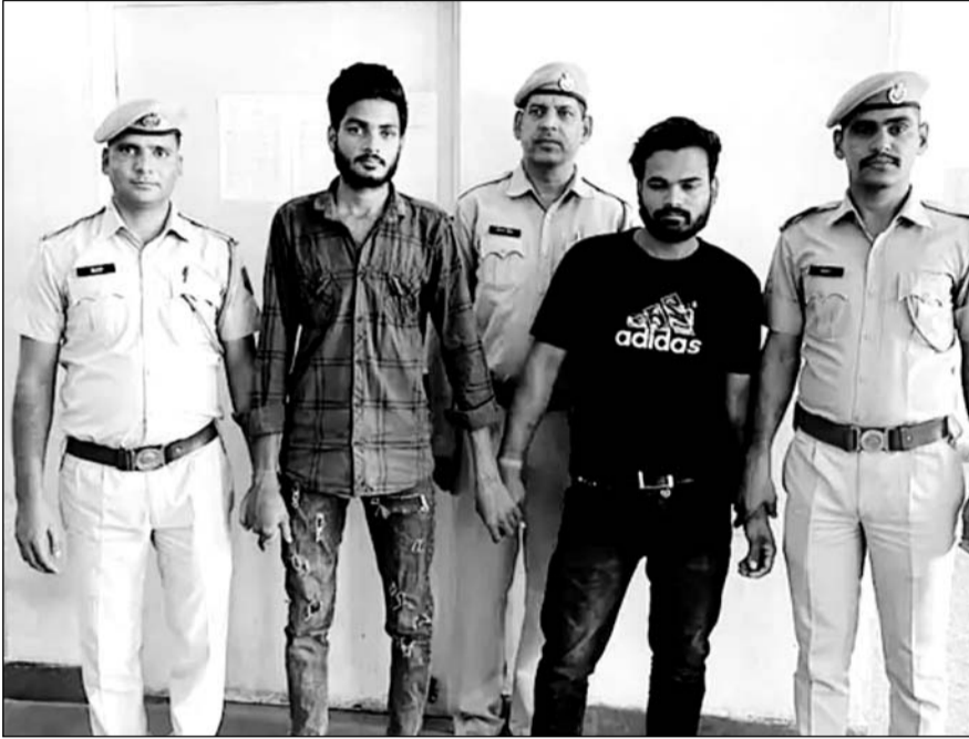
पुलिस गिरफ्त में चोरी के आरोपी कर्मचारी।