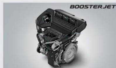
1.0L Turbo Boosterjet Engine with Progressive Smart Hybrid