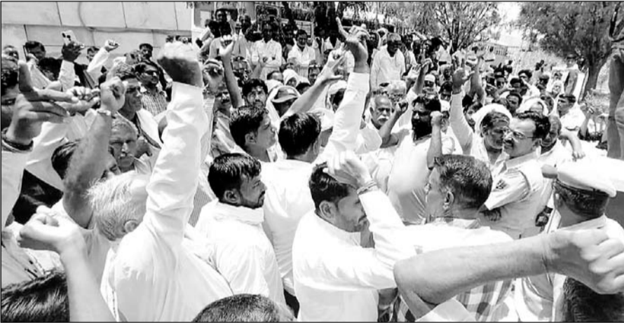
कानूना में पुलिस को गिरफ्तारियां देते ग्रामीण।