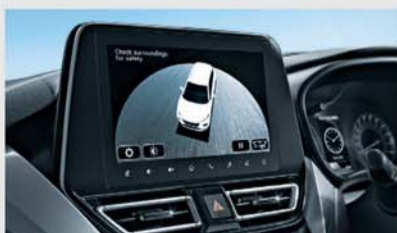
360 View Camera