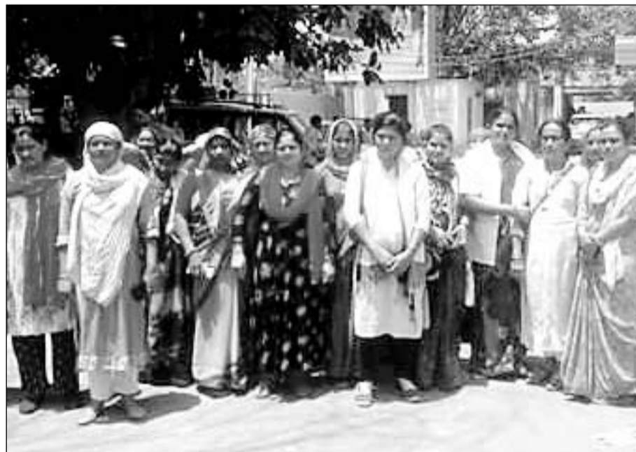
मांगों को लेकर हड़ताल पर चल रही महिला स्वास्थ्य कार्यकर्ताओं ने कलेक्ट्रेट पहुंचकर प्रदर्शन किया।

महिला स्वास्थ्य कार्यकर्ता का कम मानदेय पर काम कर रही हैं जिससे उन्हें आर्थिक तंगी के कारण परेशानियों का सामना करना पड़ता है। परिवर्तन करने और अन्य पदों पर पदोन्नति की मांग कर रही है। स्वास्थ्य कार्यकर्ताओं ने बताया कि है उनकी सरकार पर किसी प्रकार का आज भी धार नहीं पड़ेगा लेकिन फिर भी उनकी मांगों को नहीं सुना जा रहा है। उन्होंने ज्ञापन सौंपकर जल्द से जल्द मांग पूरी करने की गुहार लगाई है महिला स्वास्थ्य कार्यकर्ता गत 1 मई से लगातार हड़ताल पर चल रही है।