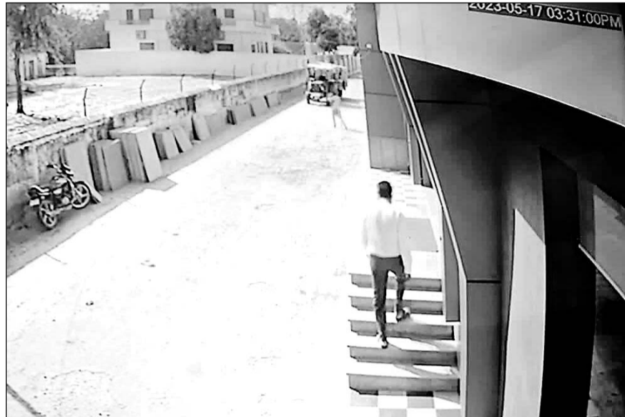
सी.सी.टी.वी. में कैद हुआ आरोपी।

पीड़ित ने पुलिस उप निरीक्षक पर कार्यवाही की मांग को लेकर एसपी को भेजा ज्ञापन