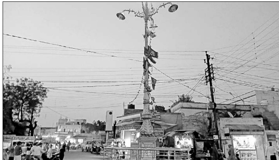
सांभर पालिका क्षेत्र में कई जगहों पर रोड लाइटें बन्द रहने से आमजन को परेशानी हो रही है।

आ रहा है। प्राप्त जानकारी के अनुसार पालिका की ओर से निगम की चल रही बकाया राशि का भुगतान का मामला अभी पूरी तरह साफ नहीं हुआ है और रोड लाइटें देर तक बंद रखकर पालिका की ओर से आर्थिक बचत किए जाने की जुगाड़ की जा रही है, ताकि रोड लाइटों का बिल कम से कम आए जबकि इन रोड लाइटों का नियमानुसार पैसा आम जनता से नगरीय उपकरण में जोड़कर भी वसूला जाता है। लोगों का कहना है कि यदि पालिका प्रशासन रोड लाइटें और सफाई व्यवस्था पर ही पूरा खर्च/खाव नहीं कर पाती है तो फिर इस डिपार्टमेंट को सरकार को रखने का औचित्य ही क्या है। इस मामले में न तो यहाँ के जनप्रतिनिधि कोई विरोध कर रहे हैं और न ही लंबे समय से प्रशासन की ओर से कुछ समाधान किया जा रहा है।