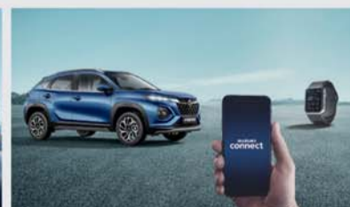
In-Built Suzuki Connect