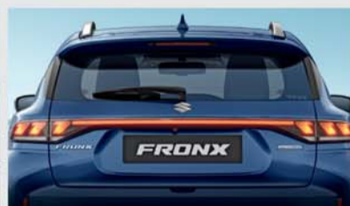
NEXTre ® Rear Combination Lights