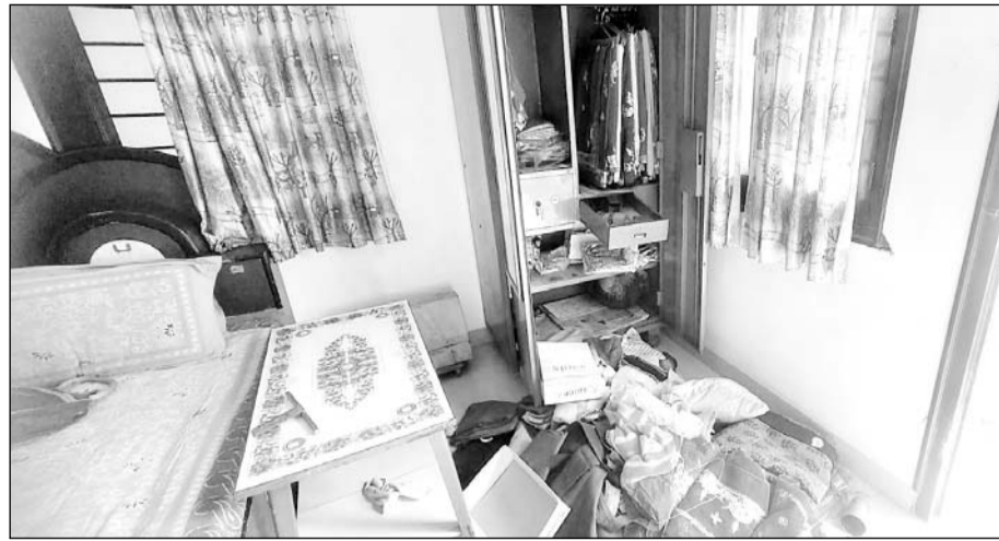
महावीर मानसिंहका कॉलोनी में दिनदहाड़े हुई चोरी के दौरान सामान बिखरा पड़ा मिला।

बिजयनगर, (निसं)। महावीर मानसिंहका कॉलोनी में दूसरे दिन दिनदहाड़े अज्ञात चोरों ने चोरी की घटना को अंजाम देते हुए डेढ़ लाख की नगदी उड़ा कर ले गए। शहर में बंद रही चोरी की घटनाओं से नागरिकों में दहशत है। शनिवार रात्रि को महावीर मानसिंहका कॉलोनी में अज्ञात चोरों ने चार जगह ताले तोड़कर चोरी की घटना को अंजाम दिया था। वही दूसरी ओर सोमवार को दिनदहाड़े महावीर मानसिंहका कॉलोनी में अज्ञात चोर करीब डेढ़ लाख की नगदी ले जाने में सफल हो गए।