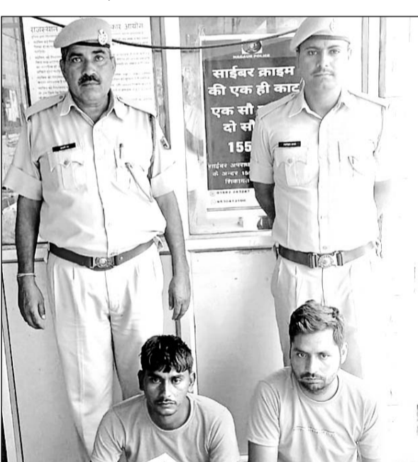
नागौर सदर पुलिस ने नकबजनी के प्रकरण में त्वरित कार्यवाही की।

नागौर, (निर्स)। सदर पुलिस ने नकबजनी के एक मामले में 10 घंटों में ही दो आरोपियों को गिरफ्तार कर लिया। अब इनसे बरामदगी के प्रयास किए जा रहे हैं। मामला निकटवर्ती ग्राम गोगेलाव का है। यहां एक बंद मकान को चोरों ने अपना निशाना बनाया। मुकदमा दर्ज होने के दस घंटों में ही पुलिस ने त्वरित कार्यवाही करते हुए दो युवकों को गिरफ्तार किया है। अब पुलिस आरोपियों से पूछताछ कर रही है।