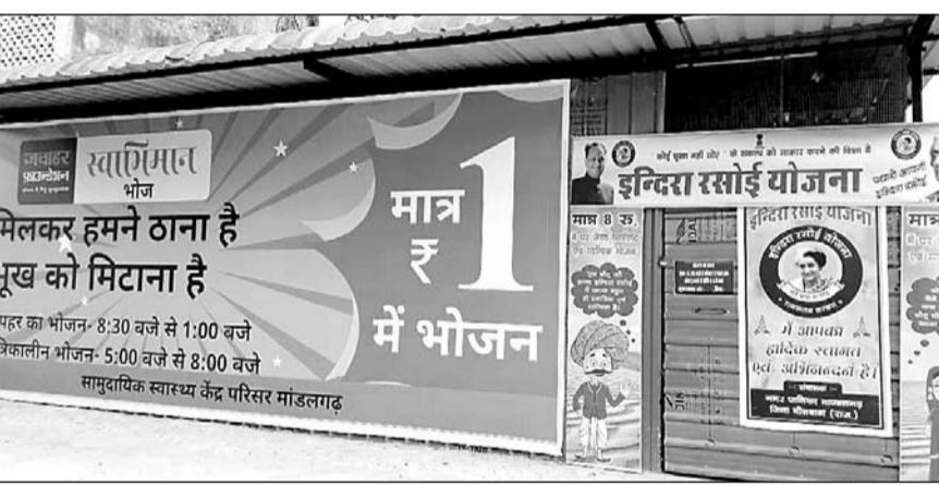
मांडलगढ़ में जवाहर फाउंडेशन द्वारा सीएचसी पर नवीनतम इंदिरा रसोई में मात्र एक रुपए में भोजन मिलेगा।

मांडलगढ़, (निर्स)। मांडलगढ़ इंदिरा रसोई में 9 नवम्बर से मात्र एक रुपए में जरूरतमंदों को भरपेट भोजन उपलब्ध होगा।