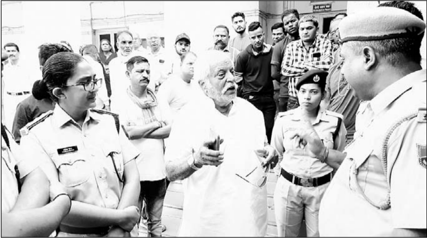
रामगंज थाना पुलिस ने चिकित्सकों और परिजनों से समझाइश कर मामला शांत करवाया।