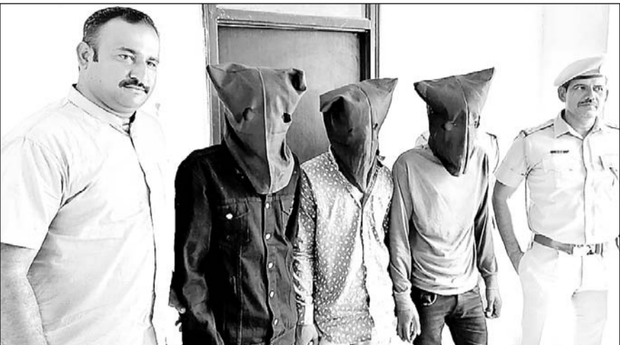
भीलवाड़ा पुलिस ने लूट की वारदातों को अंजाम देने वाले आरोपियों को गिरफ्तार किया।

भीलवाड़ा, (निर्स)। शहर में आतंक का पर्याय बनी लुटेरी गैंग का पुलिस ने खुलासा करते हुए 3 आरोपियों को गिरफ्तार करते हुए एक नाबालिग को निरुद्ध किया है। इन आरोपियों ने शहर में एक दर्जन के करीब लूट की वारदातों को अंजाम दिया था। 6 वारदातों को एक ही रात में अंजाम देने के बाद भीलवाड़ा पुलिस को नौद जागी और आरोपियों की धरपकड़ के लिए 50 से ज्यादा पुलिस कर्मियों का गठन कर मामले का खुलासा किया है।