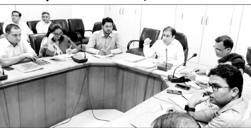
कलेक्टर पीयूष समारिया की अध्यक्षता में कलेक्ट्रेट सभागार में जिले के समस्त राजस्व अधिकारियों की मासिक बैठक का आयोजन किया गया।

नागौर, (निर्स)। जिला कलेक्टर पीयूष समारिया की अध्यक्षता में सोमवार को जिला कलेक्ट्रेट सभागार में जिले के समस्त राजस्व अधिकारियों की मासिक बैठक का आयोजन किया गया। बैठक की अध्यक्षता करते हुए जिला कलेक्टर समारिया ने कहा कि सभी राजस्व अधिकारी प्रकरणों के निस्तारण के साथ साथ ही आंकड़ों की त्वरित ऑनलाइन करना भी सुनिश्चित करें। उन्होंने जिले में विभिन्न न्यायालयों में दर्ज राजस्व प्रकरणों की स्थिति की समीक्षा कर उनके निस्तारण की बात कही। उन्होंने कहा कि सभी अधिकारी पटवारियों की नियमित बैठक लेते रहे। उन्होंने किसी राजस्व प्रकरण को ड्रॉप करने के बाद उसे रिस्टोर करने के लिए कोई मजबूत कारण सुनिश्चित करने की बात कही। जिला कलेक्टर ने कहा कि सभी राजस्व अधिकारी अपने अधिकारों का उपयोग जवाहिर में करें और नियत समय में विभिन्न प्रकरणों का निस्तारण कर आमजन को राहत प्रदान करें। जिला कलेक्टर ने कहा कि सभी