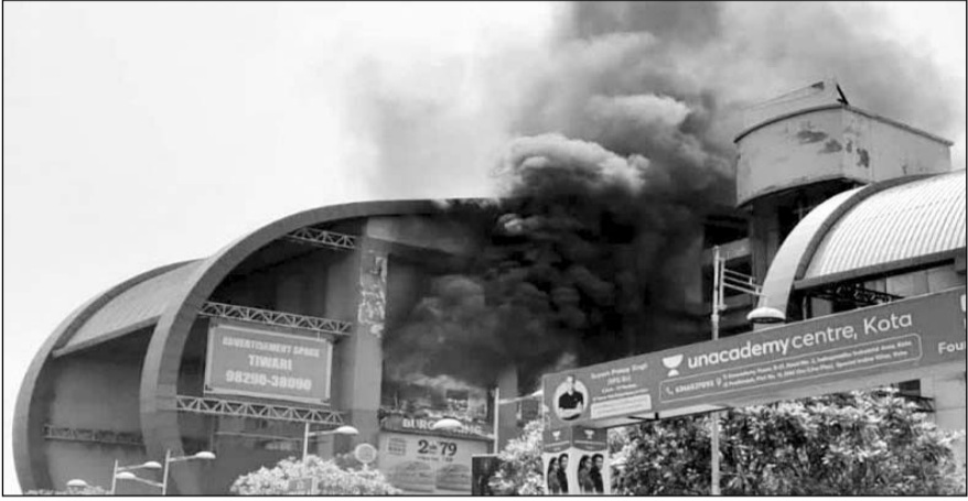
कोटा के सिटी मॉल में भीषण आग लगने के बाद दूर तक धुआं नजर आया।

घटना के बाद जिला कलैक्टर सहित प्रशासन के अधिकारियों ने घटनास्थल का निरीक्षण किया है। जिला कलैक्टर पीयूष समारिया कहना है कि उन्होंने मौके का निरीक्षण कर लिया है। घटना में कोई जनहानि नहीं हुई है। यह आग मिस्टर डीआईवाई शोरूम से शुरू हुई थी। इस शोरूम में धरेलू सामान, बच्चों के टॉयज और क्रोकरी मिलती है। आसपास के शोरूम तक भी आग पहुंची है। अधिकारियों ने प्रारंभिक तौर पर आग के कारण के संबंध में स्पष्ट कुछ नहीं बताया है, लेकिन एयर कंडीशन की लाइन से शॉर्ट सर्किट होने की बात सामने आई है। अभी इसकी पुष्टि नहीं हुई है। पूरे मामले की इंचवारी