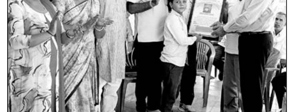
समता सेवा केन्द्र द्वारा प्रतिभावान छात्रों का सम्मानित किया।