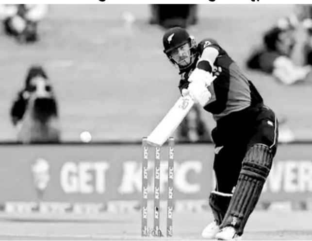
मैं अपने देश के लिए 367 मैच खेलकर भाग्यशाली महसूस करता हूं। मैं अपने

देहरादून, 8 जनवरी। उत्तराखंड में होने जा रहे 38वें राष्ट्रीय खेलों की गतिविधियां, जिन शहरों में प्रस्तावित है, वहां पर छात्र-छात्राओं को इससे जोड़ने के लिए पहले की जा रही है। युवा दिवस यानी 12 जनवरी से प्रचार के आठ कंटेनरों को स्कूल-कॉलेजों के लिए रवाना किया जा रहा है। छात्र-छात्राएं इस प्रचार कंटेनरों के माध्यम से खेल मुकाबले के लिए अपनी सीट तयूआर कोड से बुक करा सकेंगे। राष्ट्रीय खेल देखने के लिए नि:शुल्क प्रवेश की व्यवस्था है। उत्तराखंड अपनी स्थापना के रजत जयंती वर्ष में इस बार राष्ट्रीय खेलों की मेजबानी कर रहा है। राष्ट्रीय खेल 28 जनवरी से लेकर 14 फरवरी तक प्रस्तावित है। देहरादून के अलावा हरिद्वार, शिवपुरी-ऋषिकेश, कोटी कालोनी टिहरी, नैनीताल, रूद्रपुर, खटीमा, हल्द्वारी, अल्मोड़ा, पिथौरागढ़ जैसी जगहों पर विभिन्न खेलों की प्रतियोगिताएं होंगी हैं। राष्ट्रीय खेल सचिवालय तैयारियों में जुटा पड़ा है। कोशिश ये ही है कि हर वर्ग को इस आयोजन से परोक्ष या प्रत्यक्ष रूप से जोड़ा जाए। छात्र-छात्राओं को इस आयोजन से जोड़ने के लिए अब युवा दिवस के मौके को चुना गया है।