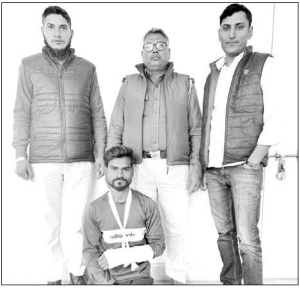
पुलिस ने शांतिर चैन स्नैचर को गिरफ्तार में लिया।