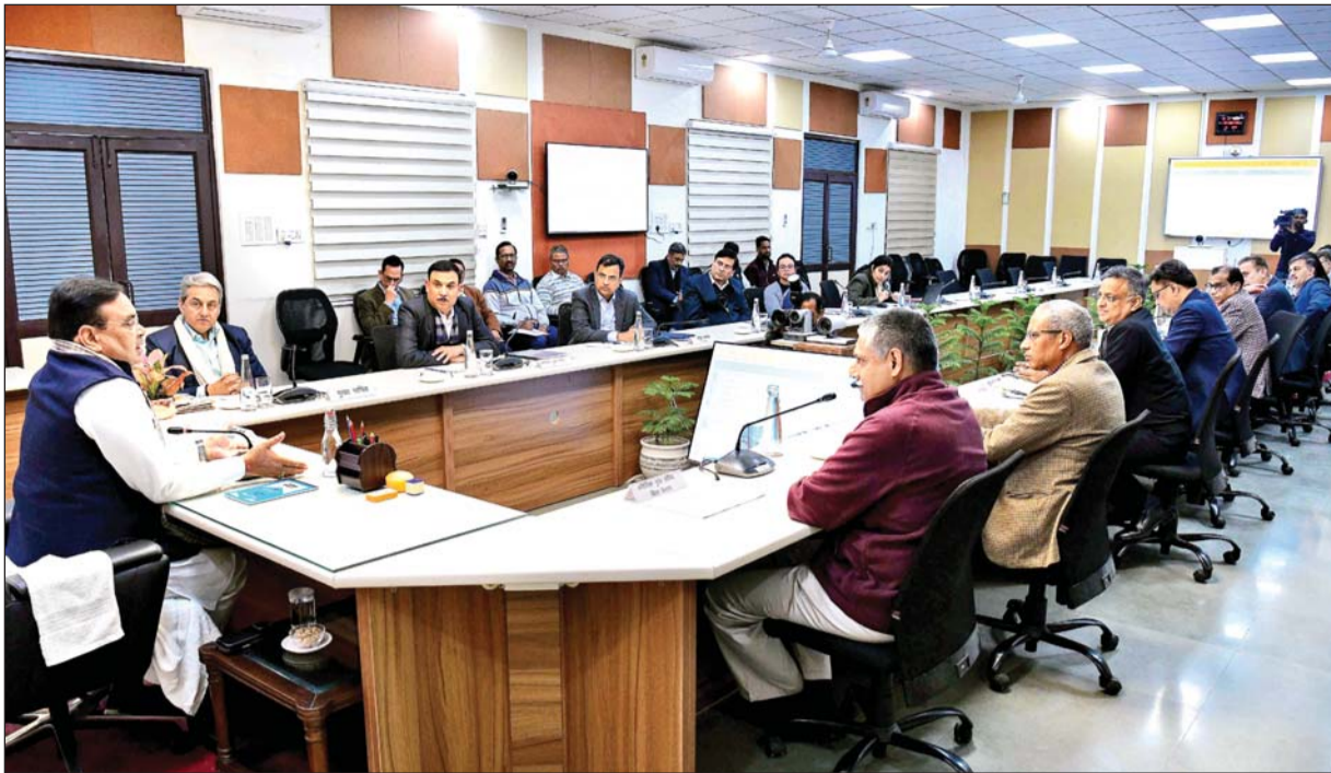
मुख्यमंत्री भजनलाल शर्मा ने युवा दिवस पर आयोजित होने वाले रोजगार उत्सव की तैयारियों की समीक्षा की। उन्होंने कहा, राज्य सरकार प्रदेश के युवाओं को रोजगार देकर उनके सपनों को साकार करने के लिए निरंतर कार्य कर रही है।