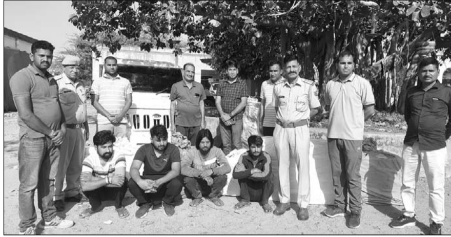
खेतड़ी पुलिस ने अवैध शराब के खिलाफ कार्रवाई करते हुए चार आरोपियों को गिरफ्तार किया।

गिरफ्तार आरोपियों से गहनता से पूछताछ की जा रही है