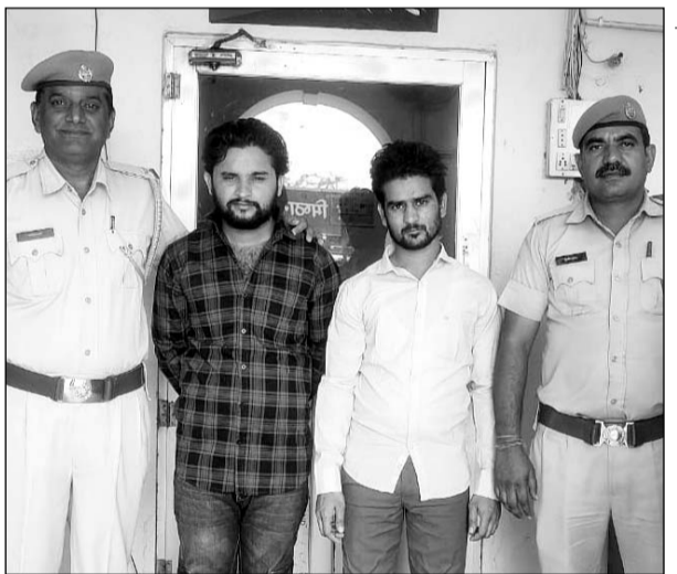
बवाई पुलिस ने फर्जी हस्ताक्षर कर रूपए निकालने के मामले में आरोपियों को गिरफ्तार किया।

खेतड़ी, (निर्स)। बवाई पुलिस ने फर्जी हस्ताक्षर कर रूपए निकालने के मामले में आरोपियों से 2.20 लाख रुपए बरामद किए हैं।