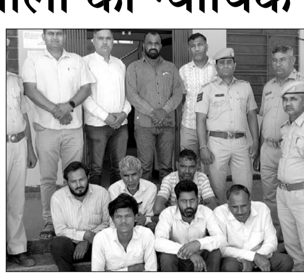
पुलिस ने गिरफ्तार आरोपियों को कोर्ट में पेश किया।