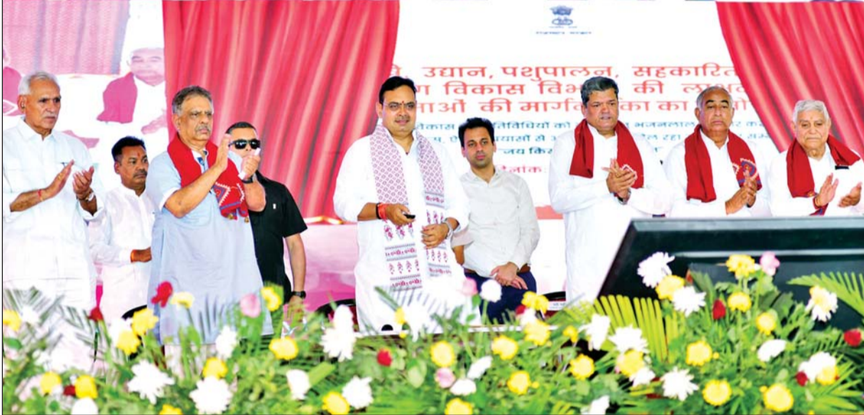
मुख्यमंत्री भजनलाल शर्मा ने बीकानेर में राजस्थान दिवस समारोह के तहत आयोजित किसान सम्मेलन एवं किसान उत्पादक संगठन कार्यक्रम को संबोधित किया। इस अवसर पर उन्होंने 30 हजार किसानों को 137 करोड़ रुपये का अनुदान, हस्तांतरण किया।

किसान सम्मेलन एवं एफ.पी.ओ. कार्यक्रम में तीस हजार किसानों को 137 करोड़ रुपए का अनुदान हस्तांतरित किया गया।