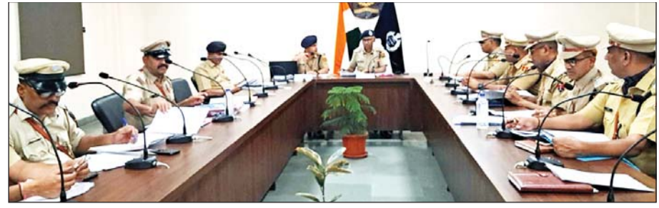
ग्रामीण पुलिस महानिरीक्षक जय नारायण शेर ने कोटा ग्रामीण पुलिस अधिकारियों के साथ बैठक ली।

कोटा, (निसं)। कोटा ग्रामीण पुलिस महानिरीक्षक (सिविल राइट्स जयपुर) जय नारायण शेर दो दिवसीय दौरे पर बुधवार को कोटा ग्रामीण पहुंचे। उन्होंने कोटा ग्रामीण के सभी थानाधिकारियों, सीओ व उच्च अधिकारियों के साथ क्राइम मिटिंग की। जिसमें जिले के संबंधित मुद्दों व अपराधों के बारे में जानकारी ली गई। दो दिवसीय दौरे पर आये कोटा ग्रामीण के पुलिस महानिरीक्षक ने क्राइम मिटिंग से पूर्व ग्रामीण पुलिस लाईन का भी निरीक्षण किया। निरीक्षण के दौरान