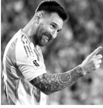
नई दिल्ली, 26 मार्च। भारतीय फुटबॉल फैंस के लिए अच्छी और बड़ी खबर है। दरअसल, दुनिया के बेहतरीन फुटबॉलरों में शुमार लियोनल मेसी अर्जेंटीना फुटबॉल टीम के साथ भारत आएंगे। अर्जेंटीना टीम इसी साल में मैच खेलने आएगी। बता दें कि, मेसी इससे पहले 2011 में आखिरी बार भारत आए थे,