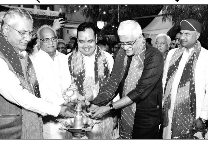
मुख्यमंत्री भजनलाल शर्मा ने नई दिल्ली के बीकानेर हाउस में दीप प्रज्वलित कर राजस्थान उत्सव का शुभारंभ किया। इस मौके पर लोकसभाध्यक्ष ओम बिड़ला और केंद्रीय मंत्री गजेन्द्र सिंह शेखावत मौजूद थे।