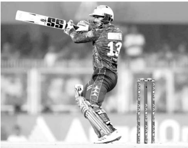
17.3 ओवर में 153 रन बनाकर आठ विकेट से जीत दिला दी। डीकॉक ने 61 गेंदों में आठ चौके और छह छक्के लगाते हुए (नाबाद 97) रनों की पारी खेली। अंगकृष रघुवंशी 17 गेंदों में 22 रन बनाकर नाबाद रहे।

गुवाहाटी, 26 मार्च। गेंदबाजों के शानदार प्रदर्शन के बाद क्विंटन डी कॉक (नाबाद 97) की विस्फोटक पारी के दम पर कोलकाता नाइट राइडर्स ने बुधवार को इंडियन प्रीमियर लीग (आईपीएल) 2025 के छठे मुकाबले में राजस्थान रॉयल्स को 15 गेंदें शेष रहते आठ विकेट से हरा दिया।