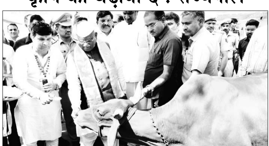
राज्यपाल हरिभाऊ बागडे ने बुधवार को जयपुर में अखिल भारतीय गौशाला सहयोग परिषद् द्वारा आयोजित राष्ट्रीय किसान एवं गौपालक सम्मेलन से पहले गौ पूजन किया और गाय को हरा चारा खिलाया।

जयपुर। राज्यपाल हरिभाऊ बागडे ने कहा कि भारत भूमि अन्नपूर्णा है। उन्होंने कहा कि फसल की वृद्धि एवं उससे उत्पादन लेने के लिए जो तत्व चाहिए वे सब भूमि में मौजूद हैं। उन्होंने गाय के गोबर का खाद के रूप में उपयोग कर रसायन मुक्त कृषि पद्धत को बढ़ावा देने का आह्वान किया। उन्होंने राजस्थान में देशी गाय के उपलब्ध दूध को महत्वपूर्ण बताया तथा गौ धन संरक्षण के लिए जो शालाओं और अन्य किए जा रहे कार्यों की सराहना भी की। बागडे बुधवार को जयपुर में अखिल भारतीय गौशाला सहयोग परिषद् द्वारा आयोजित राष्ट्रीय किसान एवं गौपालक सम्मेलन में संबोधित कर रहे थे। उन्होंने राष्ट्र स्तरीय कृषि स्टार्टअप मेले के रूप में आये गये को सपोर्ट करने का आह्वान किया। उन्होंने कहा कि प्रोत्साहन देने, किसानों के उत्पादों के प्रमाण और ब्रांडिंग के लिए भी कार्य करने का आह्वान किया।