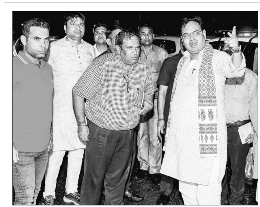
मुख्यमंत्री भजनलाल शर्मा ने सोमवार शाम को जयपुर शहर में हुई तेज बारिश के दौरान जवाहर सर्किल, मालवीय नगर अंडर पास, सांगानेर क्षेत्र, चोमू पुलिसिया, ढेर के बालाजी चौराहा, 9 नंबर और 14 नंबर चौराहे का जायजा लिया।