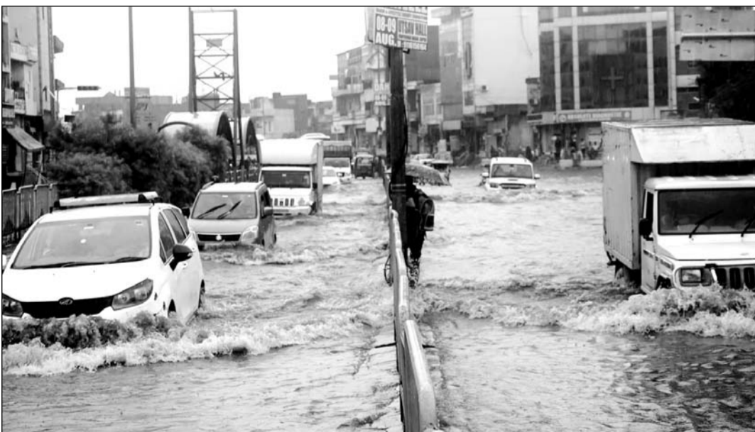
सोमवार को लगातार तीसरे दिन तेज बारिश के कारण सीकर रोड स्थित ढेहर के बालाजी क्षेत्र में मुख्य सड़क पर 3 फीट तक पानी भरा रहा। इस दौरान यहाँ से गुजरने वाले वाहन चालकों को भारी परेशानियां झेलनी पड़ीं।

यहाँ के पानी की निकासी अमानीशाह नाले से कनेक्ट कर दी जाए तो इस समस्या का समाधान हो जाएगा। कालवाड़ रोड पर रावण गेट चौराहे से