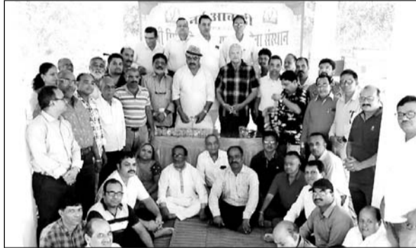
विठ्ठलदेव मंदिर में नई आबादी स्थित श्री सिद्धि विनायक गणपति मंदिर के विकास के लिये संकल्प लेते सर्व समाज के लोग।