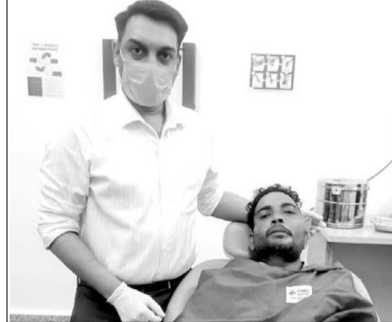
पिम्स में मेंडीबल फ्रैक्चर और सोम्य अस्थि ट्यूमर ( बेनाइन ट्यूमर ) का सफल ऑपरेशन किया गया।

उदयपुर, (कासं)। पेसिफिक इंस्टीट्यूट ऑफ मेडिकल साइंसेज, पिम्स हॉस्पिटल, उमरडा में चिकित्सकों ने मेंडीबल फ्रैक्चर और सोम्य अस्थि ट्यूमर (बेनाइन ट्यूमर) का सफल ऑपरेशन किया है।