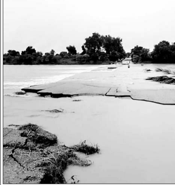
गांव काटकर के समीप स्थित पुलिया पूरी तरह क्षतिग्रस्त हो गई।