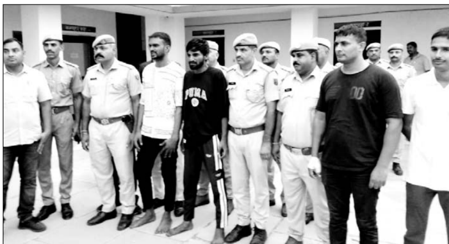
पुलिस फायरिंग मामले में दो आरोपियों को गिरफ्तार किया।