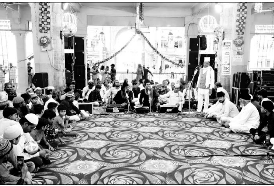
उर्स में सुफियाना कलाम पेश किए।

कपासन, (निस्)। हज़रत ख्वाजा गरीब नवाज़ र.अ. की छटी शरीफ की महफिल से हज़रत दीवाना शाह साहब र.अ. का तीन दिवसीय उर्स का आगाज़ हुआ।