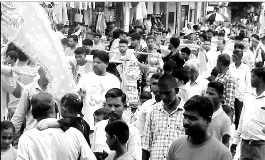
शहर में कावडियों की शोभायात्रा निकाली।